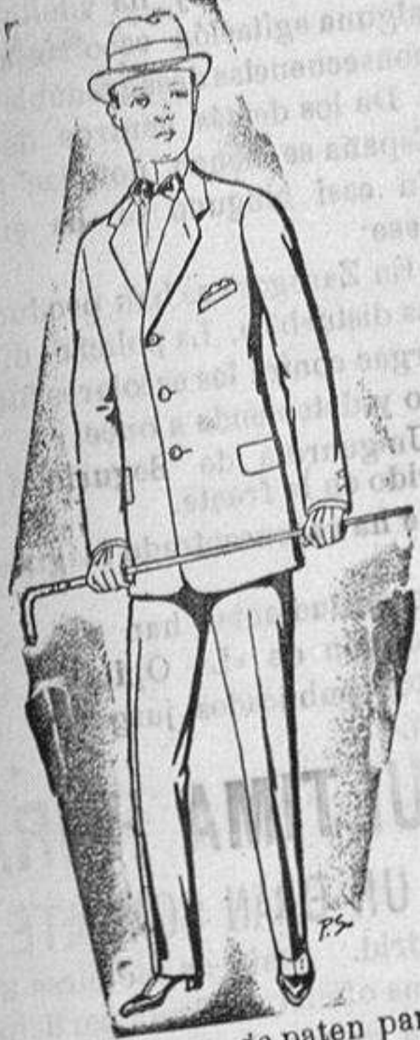
Trajes de paten para jovencitos de 10 a 16 años De 14 a 50 ptas.

Madrid, Barcelona, Almeria, Bilbao, Cádiz, Cartagena, Gijón, Granada, Málaga, Palma de Mallorca, Santander, Sevilla, Valencia, Valladolid y Zaragoza.