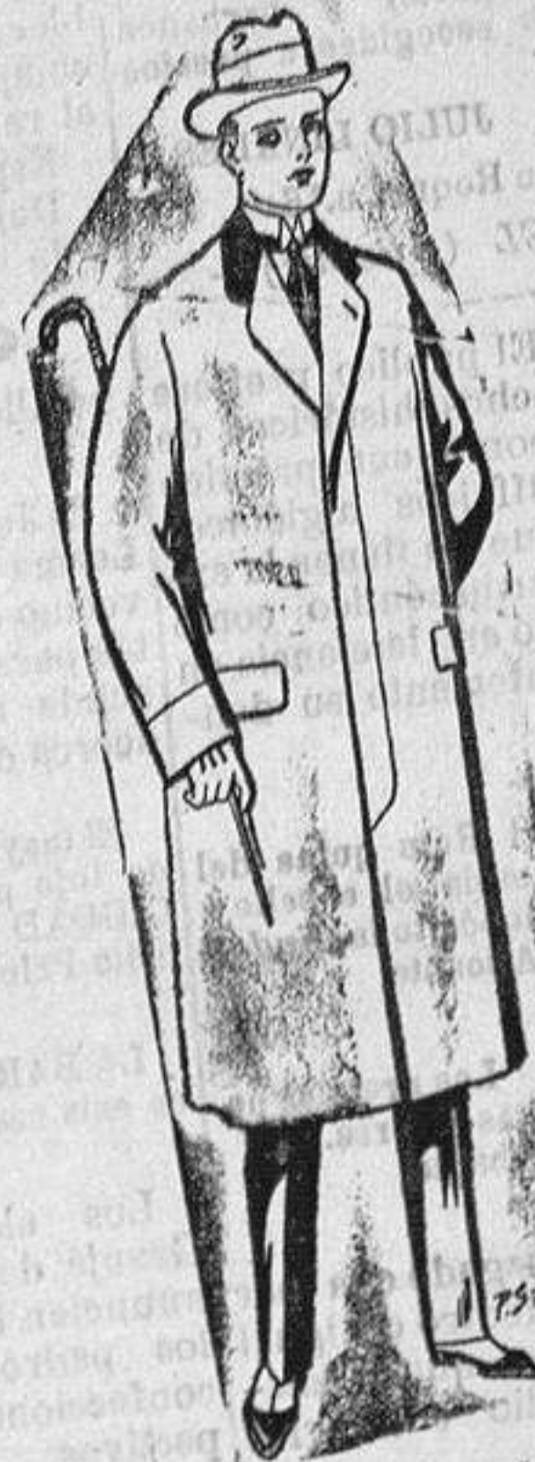
Gabanes de paten, ch-viot 6 melton De 25 a 100 ptas.

Ropas confeccionadas para Caballeros y Niño y Artículos de la Temporada