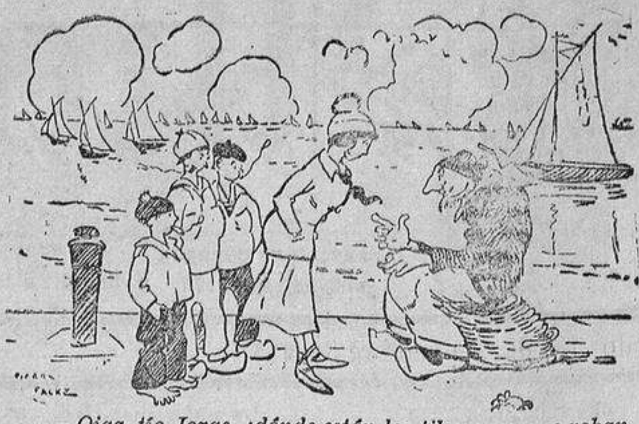
— Oiga, tío Jorge, ¿dónde están los tiburones que roban a las muchachas? — No te impacientes; ya los verás cuando seas mayor.

Se reanuda el trabajo Después de impresa la página anterior recibimos noticias de haberse reanudado el trabajo en el almacén de almendras de los señores Prytz.