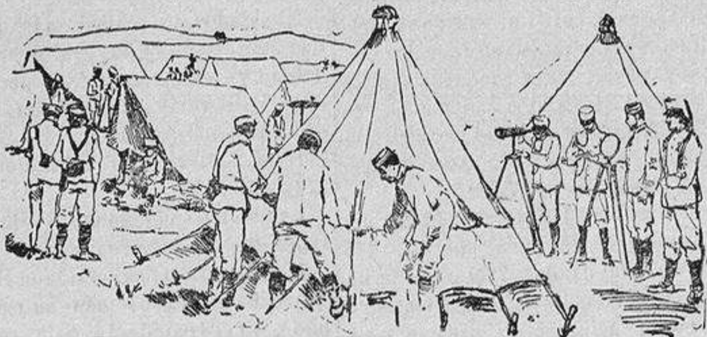
Un rincón del campamento de Laucien