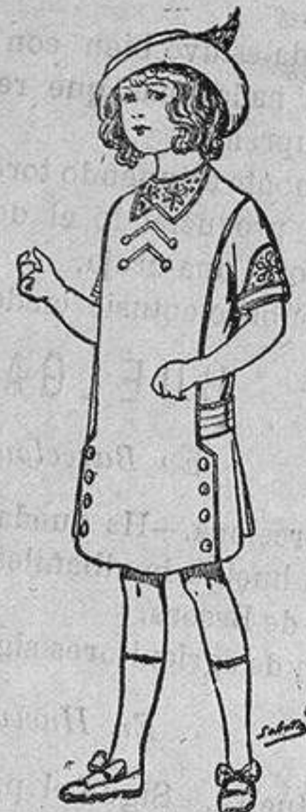
Vestidos de seda para niñas de 4 á 10 años de Ptas. 22, 24 y 26

Trajes de lana forma sastre para Señora . . . de 25 á 100 ptas. Trajes de drill, forma sastre, para Señora . . . de 14 á 40 > Vestidos de seda, lana, batista, etc. . . . de 14 á 85 > Trajes lana ó drill para Niño . . . . . de 7 á 50 > Refajos de seda ó algodón . . . . . de 8 á 50 >