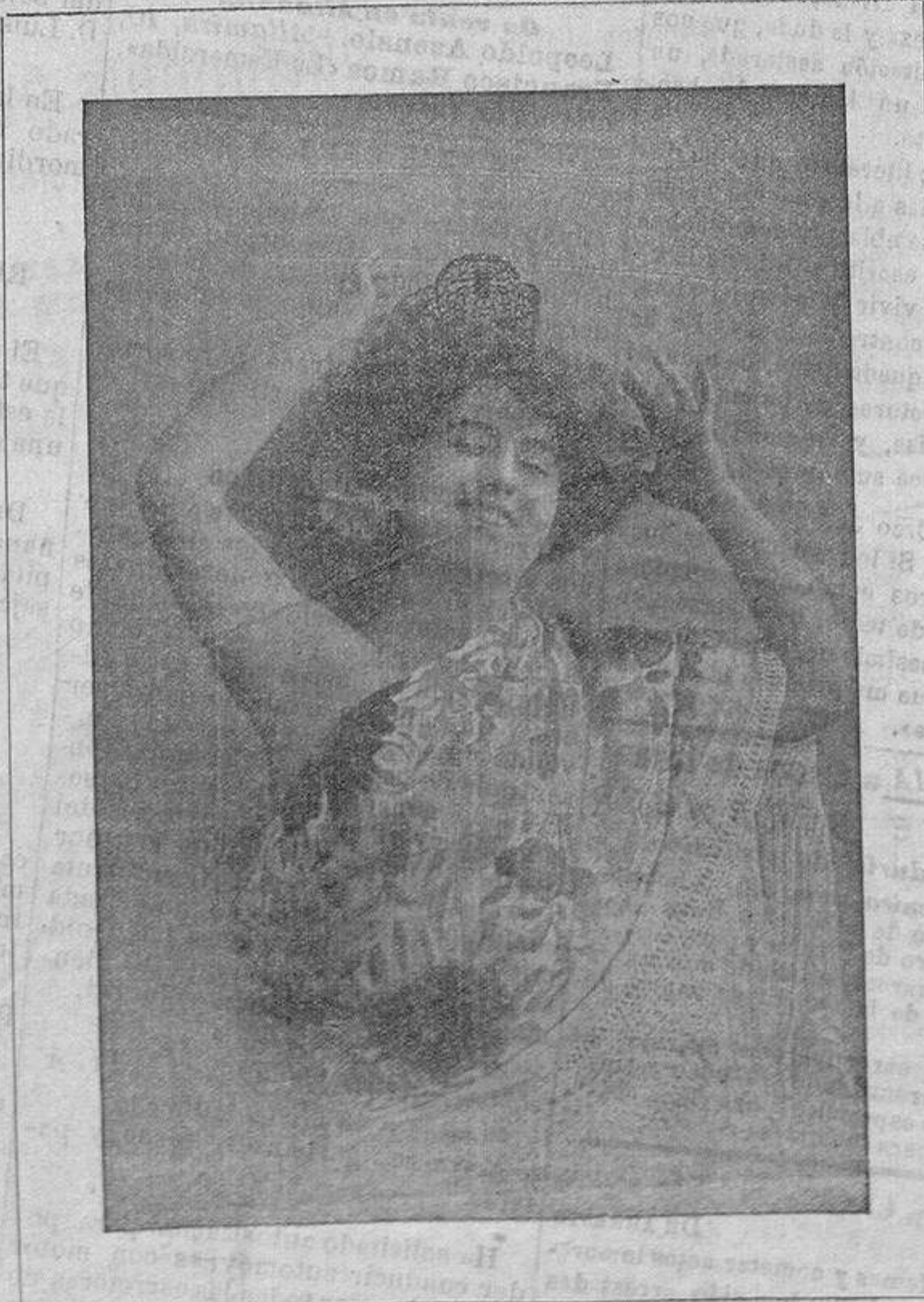
Geptísimica capzopetista que debuta hoy en el Teatro de Verano