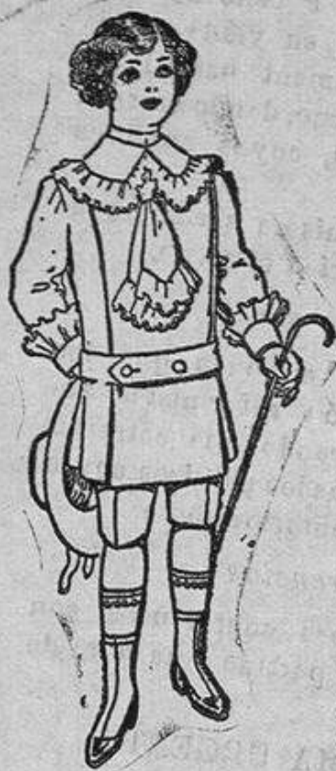
Traje de jerga azul ó alpaca blanca para niños de 4 á 10 años de Ptas. 26 á 35

Recos confeccionados para Caballeros y Niño y Artículos de la Temporada