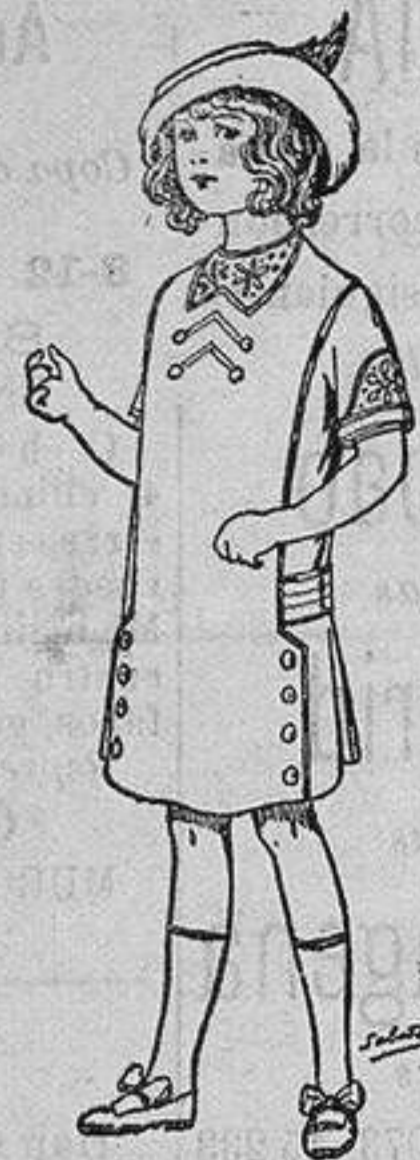
Vestidos de seda para niñas de 4 á 10 años de Ptas. 22, 24 y 26

Trajes de lana forma sastre para Señora . . . de 25 á 100 Ptas. Trajes de dril, forma sastre, para Señora. . . de 14 á 40 » Vestidos de seda, lana, batista, etc. . . de 14 á 85 » Trajes lana ó dril para Niño. . . de 7 á 30 » Refajos de seda ó algodón . . . de 3 á 50 »