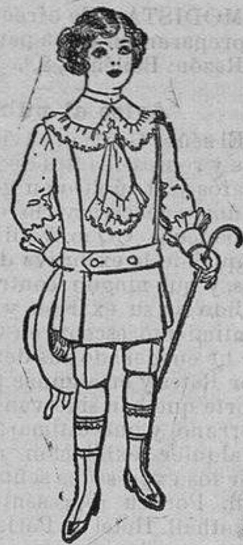
Traje de jerga azul ó alpaca blanca para niños de 4 á 10 años de Ptas. 26 á 35

Ropas confeccionadas para Caballeros y Niño y Artículos de la Temporada