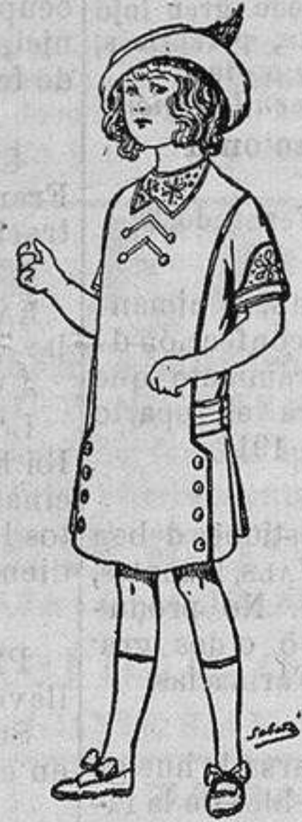
Vestidos de seda para niñas de 4 á 10 años de Ptas. 22, 24 y 26

Confecciones de todas clases para SEÑORA y NIÑA