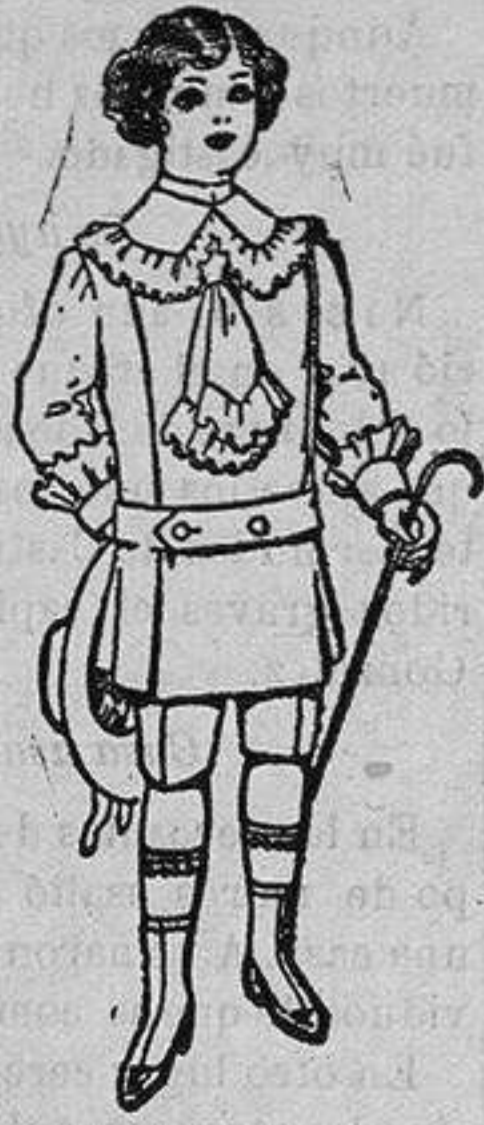
Traje de jerga azul ó alpaca blanca para niños de 4 á 10 años de Ptas. 26 á 35

Madrid, Barcelona, Almeria, Bilbao, Cádiz, Cartagena, Gijón, Granada, Málaga, Palma de Mallorca, Santander, Sevilla, Valencia, Valladolid y Zaragoza.