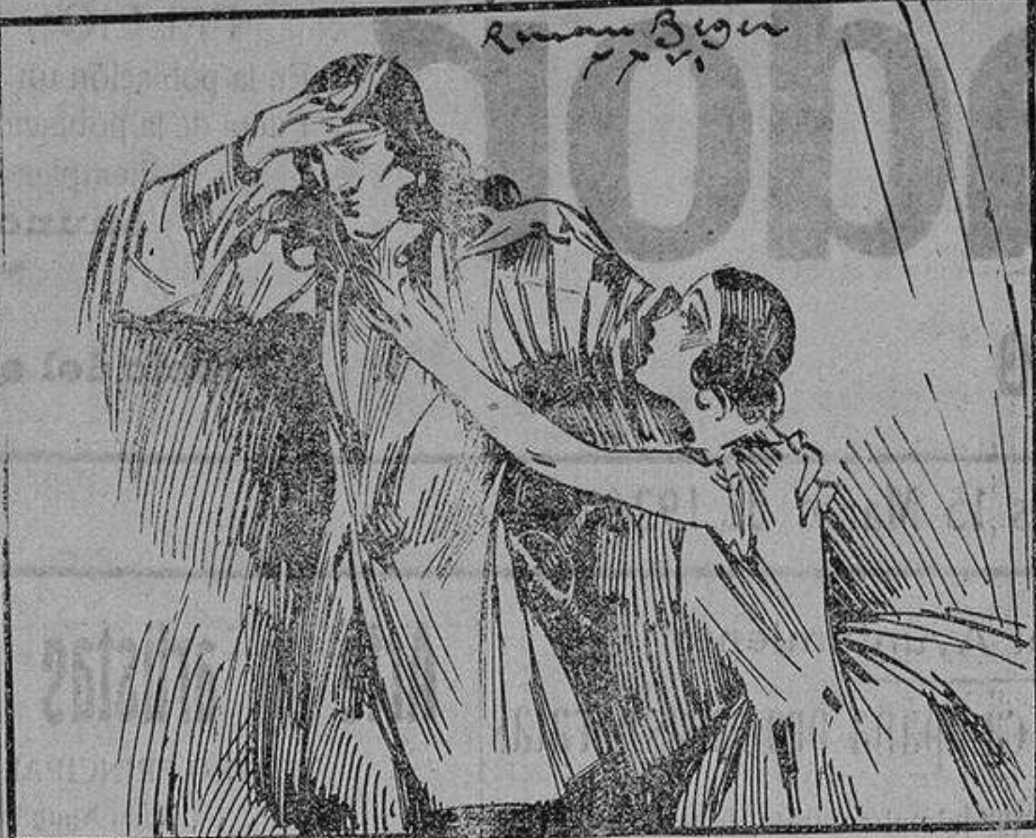
Toda la integridad y la firmeza del caballero ENRIQUE DE LAGARDÈRE vacila ante los halagos de la mujer amada; la bellísima AURORA DE NEVERS