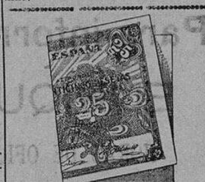
Un buen consejo vale más que estas veinticinco pesetas.

Madrid, (teléfono). — Un despacho de Washington, da cuenta de haberse acordado la adhesión al Pacto Kellogg, por 32 naciones más.