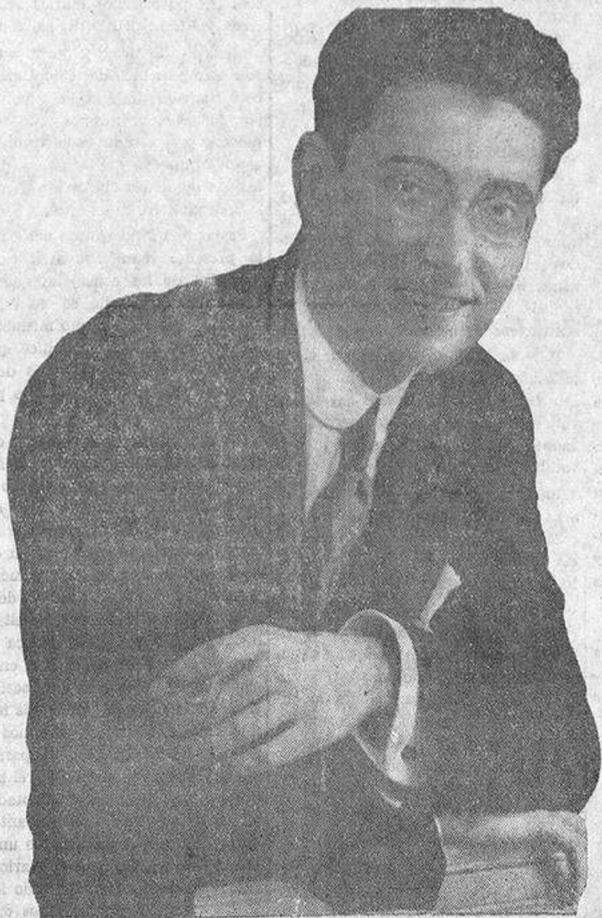
NUESTRO LLORADO DIRECTOR, CUANDO EN PLENO VIGOR DE JUVENTUD, ERA LA FIRME VOLUNTAD Y EL CEREBRO CLARO Y FUERTE, QUE DIERON VIDA A ESTE PERIODICO