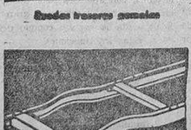
Bastidor de acero suavecado

RUEDAS: De disco de acero perforadas con aro suelto... Gemelas atrás en el camión de 2 toneladas... Gemelas opcionales en el chasis de 1 tonelada... De alambre en el chasis de 1/2 tonelada.