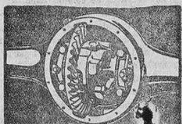
Eje trasero 30 por 100 más fuerte

MOTOR: 6 cilindros... Válvulas en cabeza... Depurador de aire... Ventilación del cárter... 50 H.P. (fuerza al freno), a 2.600 r. p. m., cualidades que explican la larga vida, rendimiento y economía del famoso motor Chevrolet... Sólo el Chevrolet tiene un motor Chevrolet.