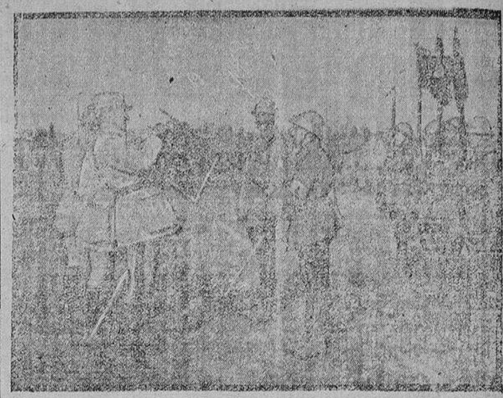
Imposición de la cruz de guerra a un estandarte francés