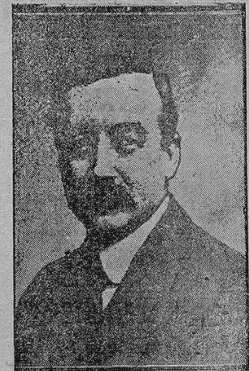
Aviones alemanes derribados

En los círculos políticos húngaros, corre el rumor de que el conde Esterhazy proclamará la disolución del Parlamento húngaro inmediatamente después del nombramiento de los nuevos jefes de los Landgraviatos. Esta medida se ha hecho inevitable a consecuencia de las escenas de desorden ocurridas en la última sesión de la Cámara.