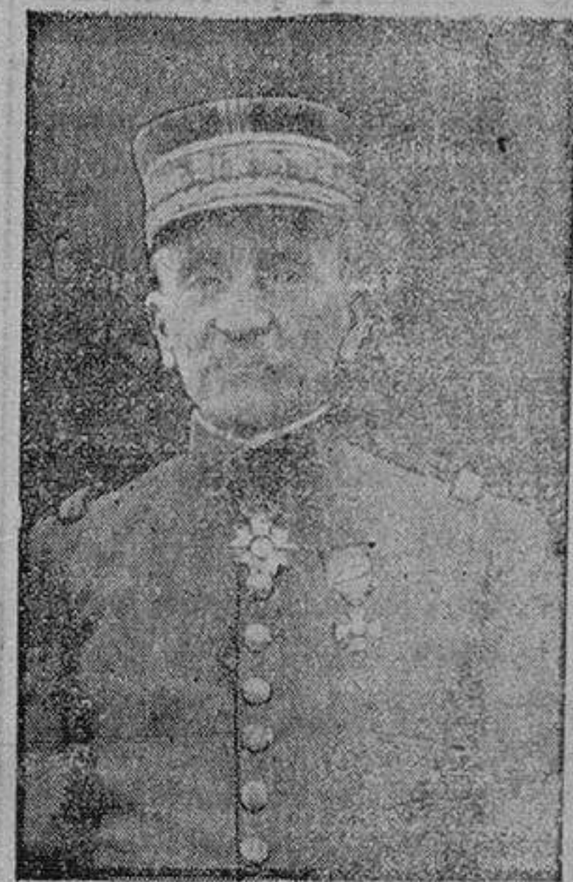
La vigilancia del mar

«La Idea Nazionale» es de idéntica opinión, añadiendo que la ocupación de Jannina, se hizo en apoyo de la Albania y para seguridad del ejército italiano que en ella está.