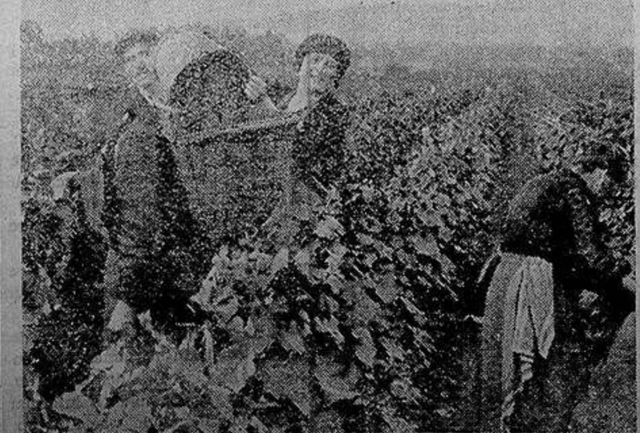
Francia. —Instantánea de la vendimia, tomada en un viñedo de la región parisienne.

Acudiendo a este acto, daréis una verdadera prueba de ciudadanía, apoyando moralmente la labor que el Partido Radical Socialista, está realizando en Alicante y en las Cortes Constituyentes, donde se está discutiendo el verdadero problema para España, la separación de la Iglesia y el Estado.