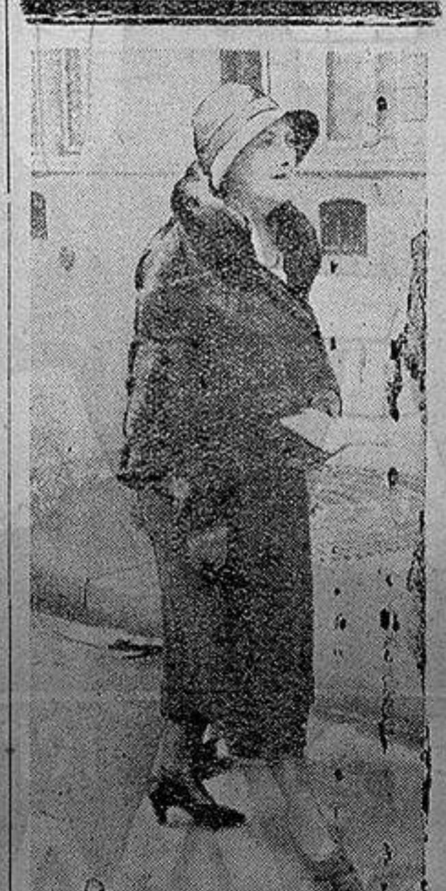
París.—Una instantánea de Madame Doumergue, la esposa del presidente saliente de la República Francesa.