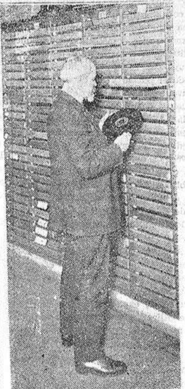
PARIS.—En el Instituto de Fonética. —El profesor Pernot fotografiado delante de los archivos donde están depositados los diferentes idiomas, dialectos y jergas usados sobre la superficie de la Tierra, trabajo al que se ha precedido bajo su dirección.

El señor Alberola en nombre de la minoría monárquica se adhiere a la proposición. Esta es aprobada por unanimidad y con ligera intervención de nuestro correligionario señor Pé-