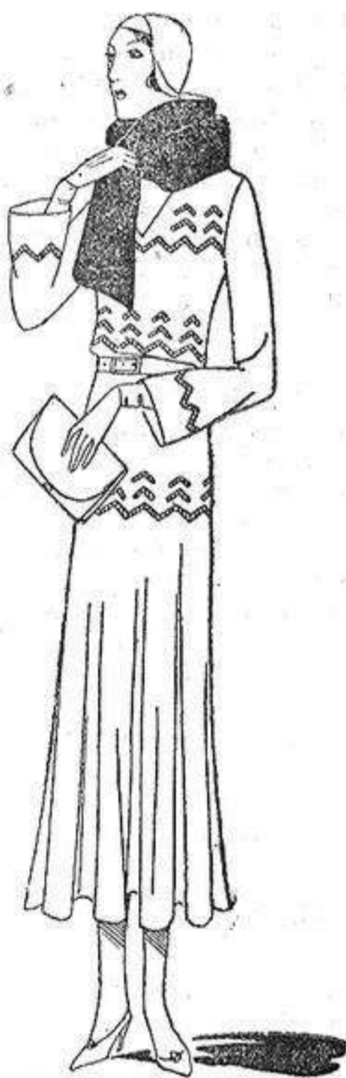
Vestido de marocain azul claro, adornado con jours y corbata en castor.

Es curioso señalar el hecho de que la silueta de los trajes de calle es casi la misma que durante el invierno pasado, es decir esbelta, flexible, de cintura normal y a veces un poco alta. Debemos añadir, sin embargo, que al parecer ha aumentado entre nuestras elegantes la aceptación por los trajes de chaqueta, porque los modistos se esfuerzan en tomar en consideración la anchura de los talles a que están destinados.