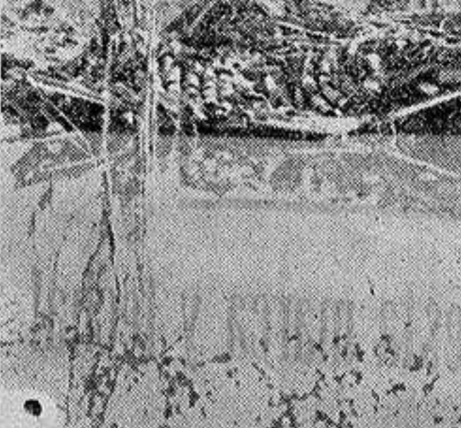
Francia.—Una calle de Montauban después de la inundación.

asomando apenas el tazón de sus fuentes, el respaldo de sus bancos y las verdes cabelleras de sus macizos, era uno de esos jardines fantásticos de las leyendas escandinavas que surgen poco a poco del fondo del mar para ofrecer en marco digno una Walkiria encantada.