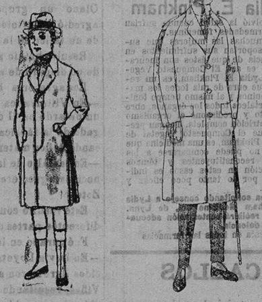
Gabanes de patén, para niños de 10 a 12 años. de ptas. 35 a 42. Gabanes de patén, melton, cheviot, con fero de satén o escoces. de ptas. 62 a 135

Ropas confeccionadas para Caballero, Señora, Niños y Niñas Peletería, Camisería, Géneros de punto, Corbatería, Guantería, Sombrerería, Zapatería, Paraguas, Bastones y Artículos de Viaje