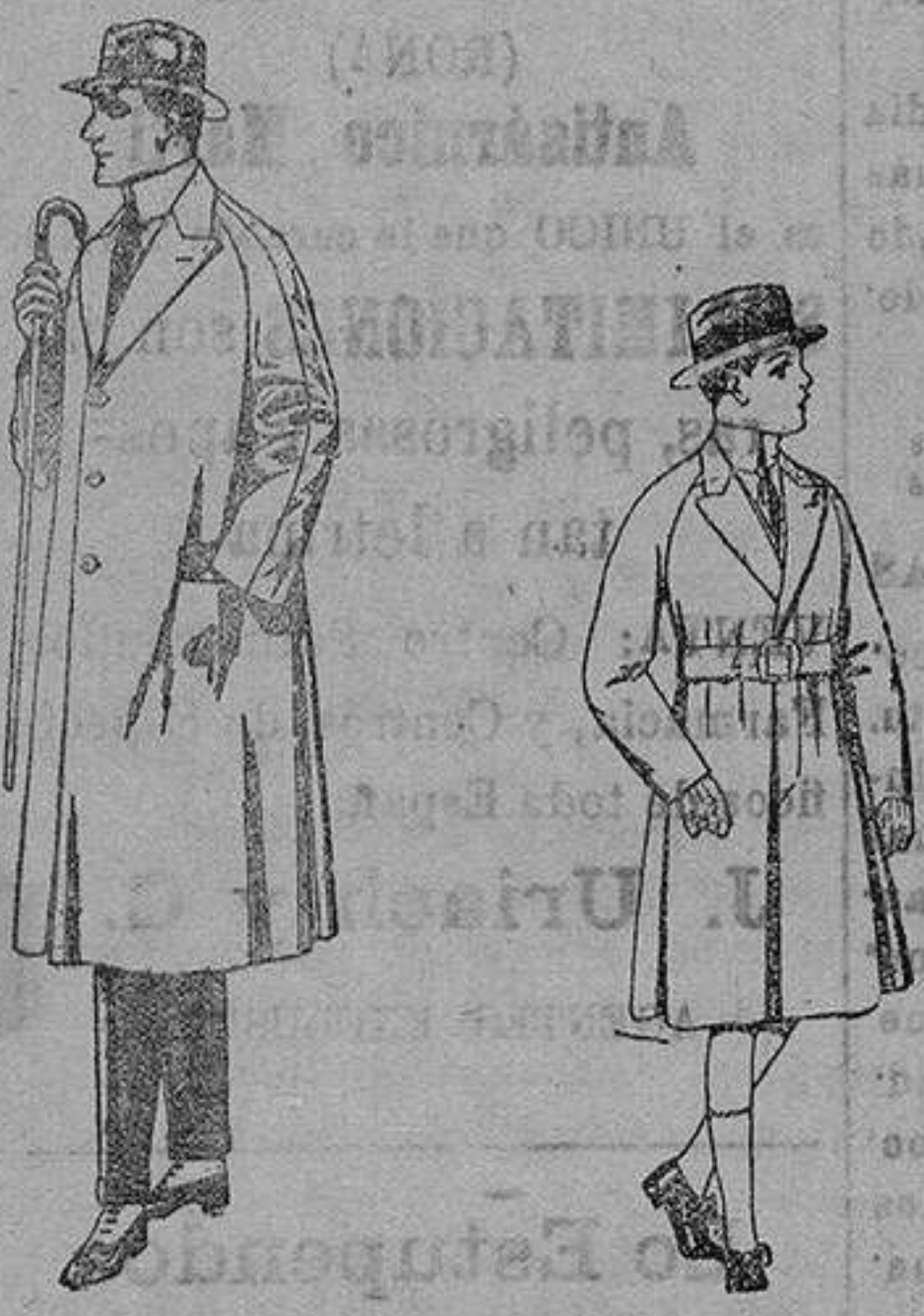
Gabanes de cheviot, gamués, etc. de ptas. 55 a 60. Gabanes de patén, para niños de 4 a 9 años. de ptas. 30 a 52.