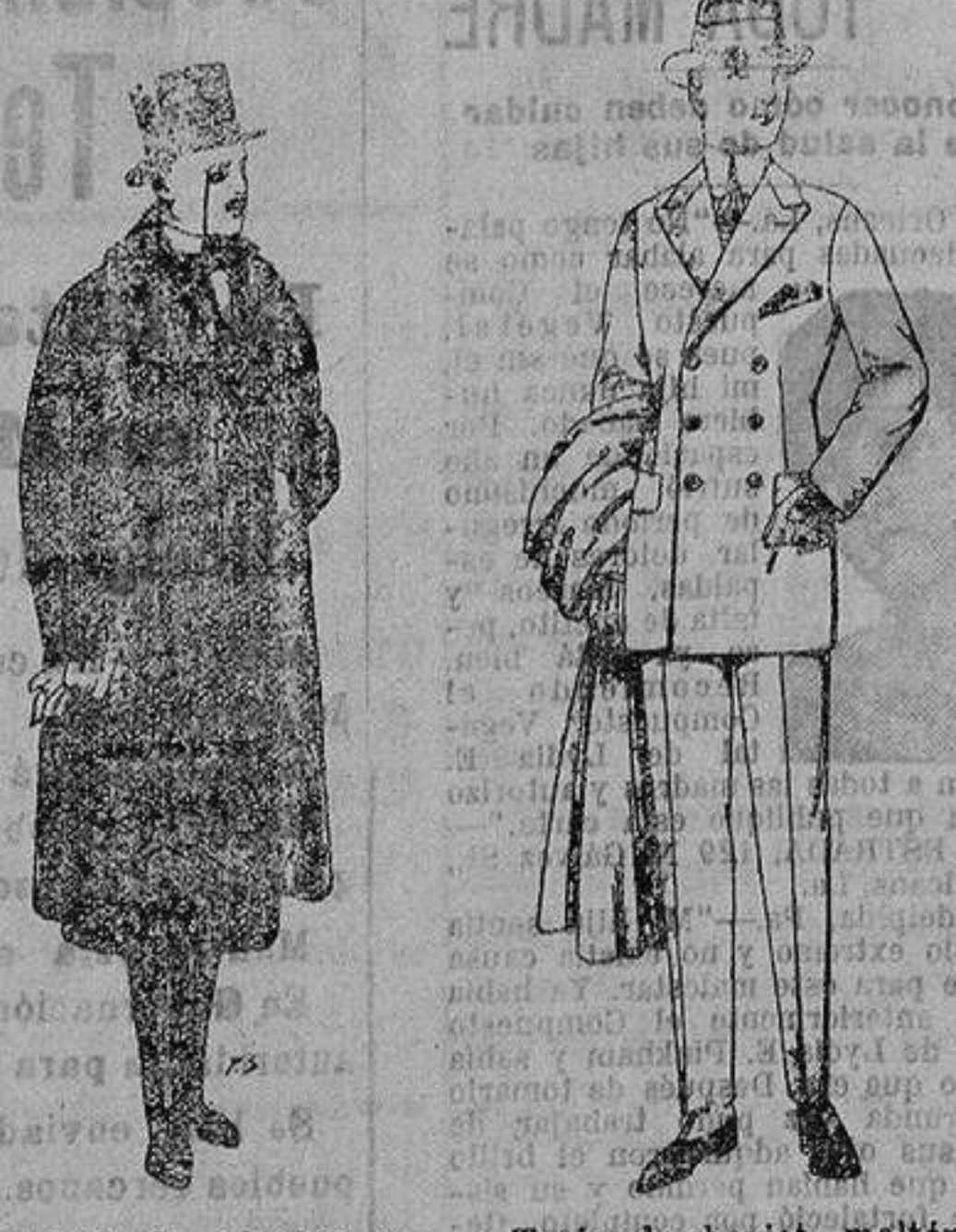
Gabanes de edredón negro, con cuello vistas de piel. de ptas. 220 a 250. Trajes de cheviot, melton, vicuña o jerga. de ptas. 55 a 190.