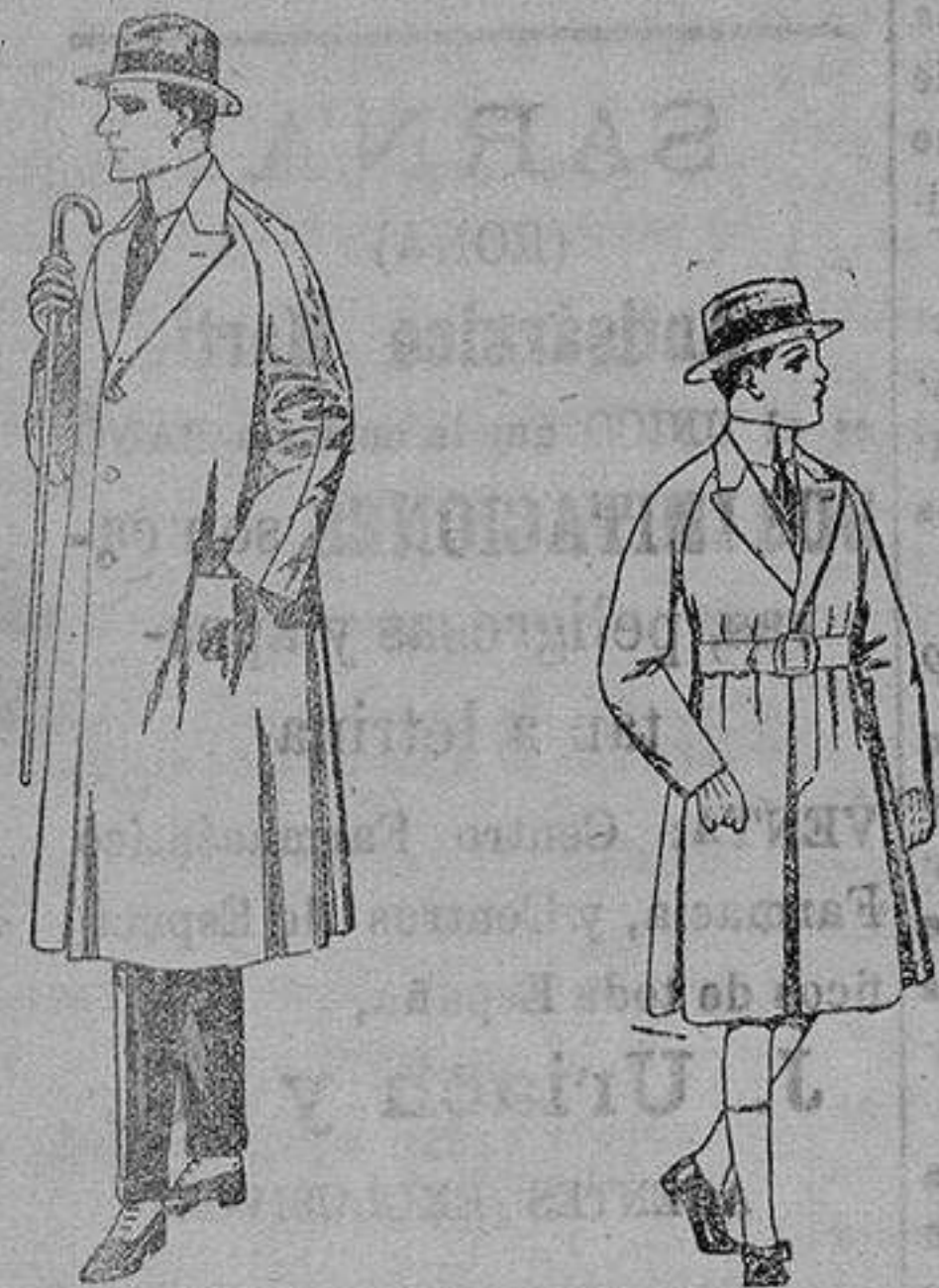
Gabanes de cheviot, gamuza, patén, etc. de ptas. 55 a 60.