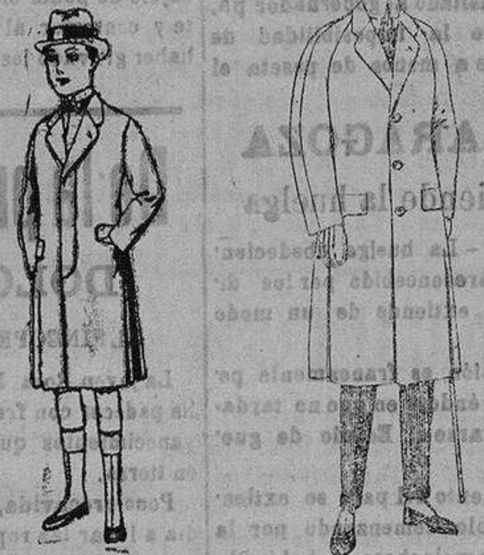
Gabanes de patén, para niños de 10 a 12 años. de ptas. 35 a 42.