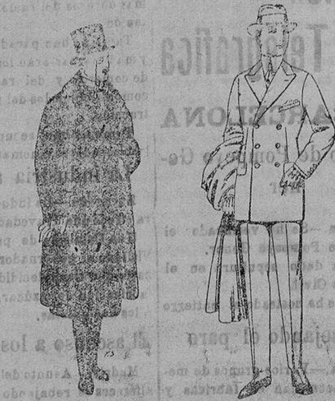
Gabanes de edredón negro, con cuello vistas de piel. de ptas. 220 a 250.