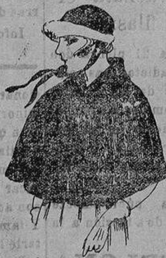
Cuellos forma capa, de piel. Colombla marrón. de ptas. 150 a 200