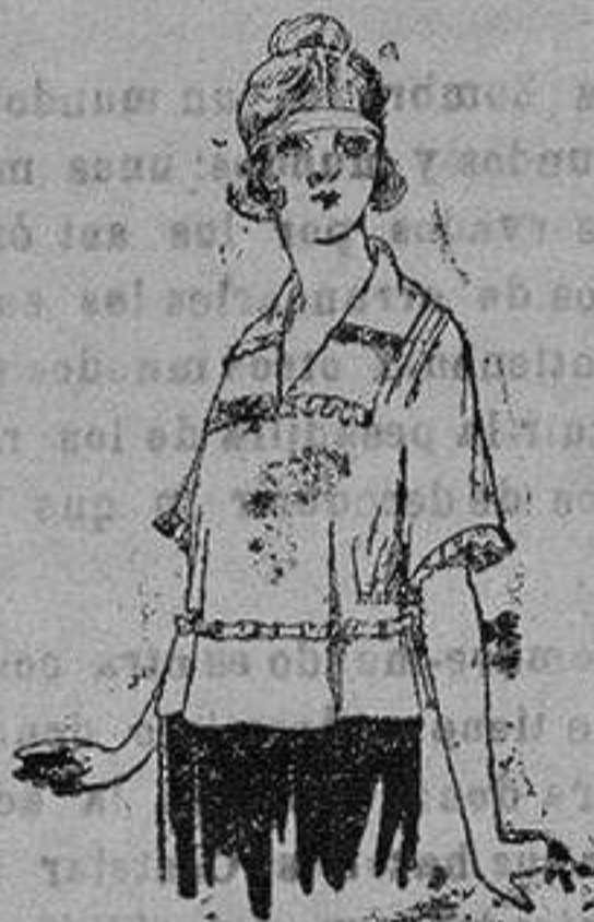
Blusas de crepón de seda, granadine, charmeuse, etc. de ptas. 48 a 70

Ropas confeccionadas para Caballero, Señora, Niños y Niñas