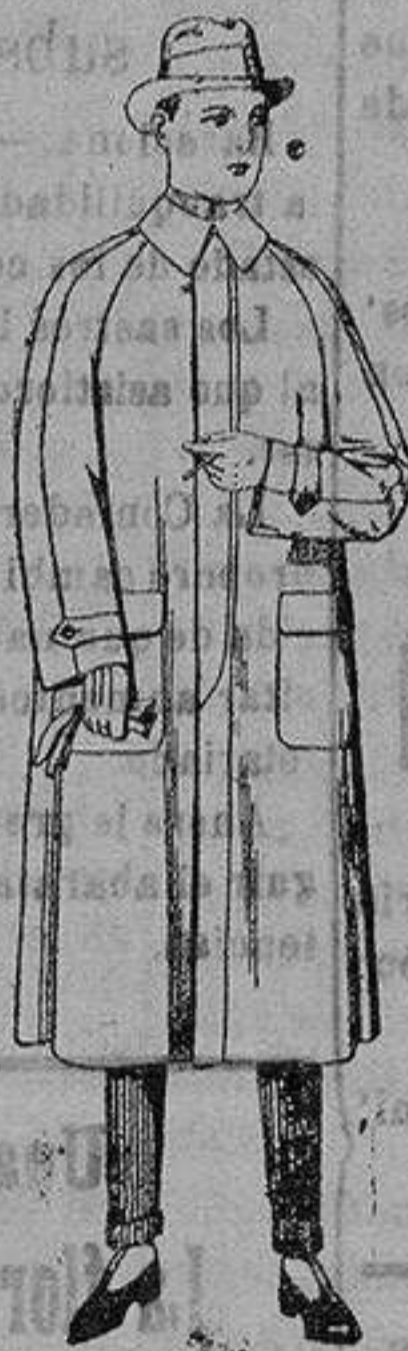
Imprmeable raglán, en azul y colores. de ptas. 45 a 100