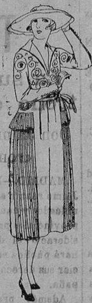
Vestidos de laila, gabardina, estambre, etc. en negro, azul y color, adornos bordados. de ptas. 110 a 150