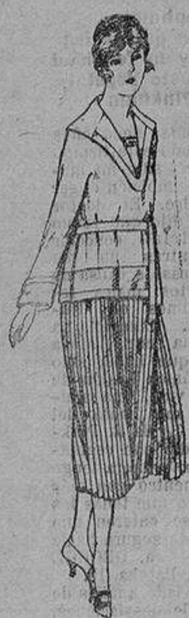
Peletots de punto de lana, en negro y colores. de ptas. 33 a 110. En seda y tejidos oro de ptas. 220 a 250