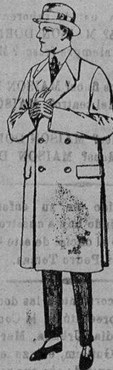
Gabanes de patén, gamuzo o cower. de ptas. 70 a 190