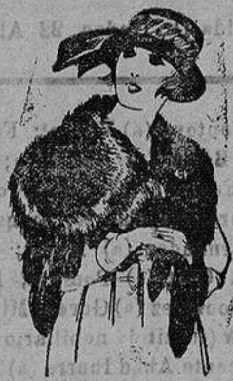
Cuellos para jovencitas, imitación Renardina. de ptas. 22 a 40