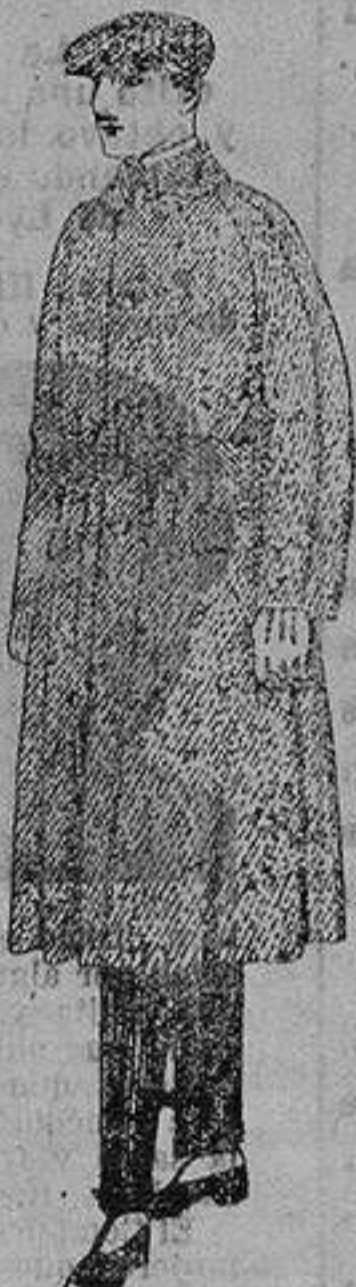
Gabanes de patén, cheviot o cower. de ptas. 90 a 160

Ropas confeccionadas para Caballero, Señora, Niños y Niñas