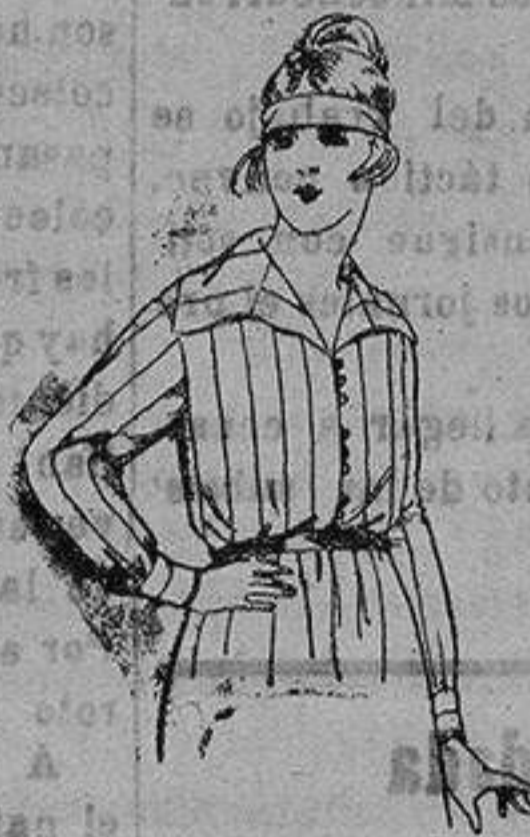
Blusas de ranela listadas. de ptas. 9 a 15

Peletería, Camisería, Géneros de punto, Corbatería, Guantería, Sombrerería, Zapatería, Paraguas, Bastones y Artículos de Viaje