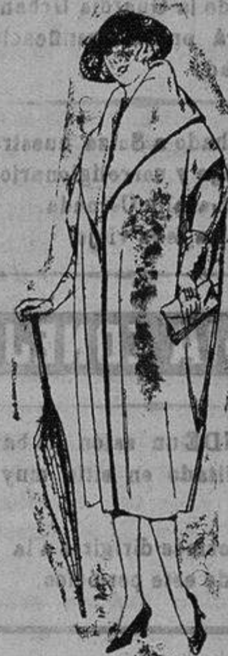
Capas de guard, feldiferec etc. ntes color. in. pa. adptas. 1 a 12

PRECIO FIJO FIDASE EL CATALOGO GENERAL VENTAS AL CONTADO