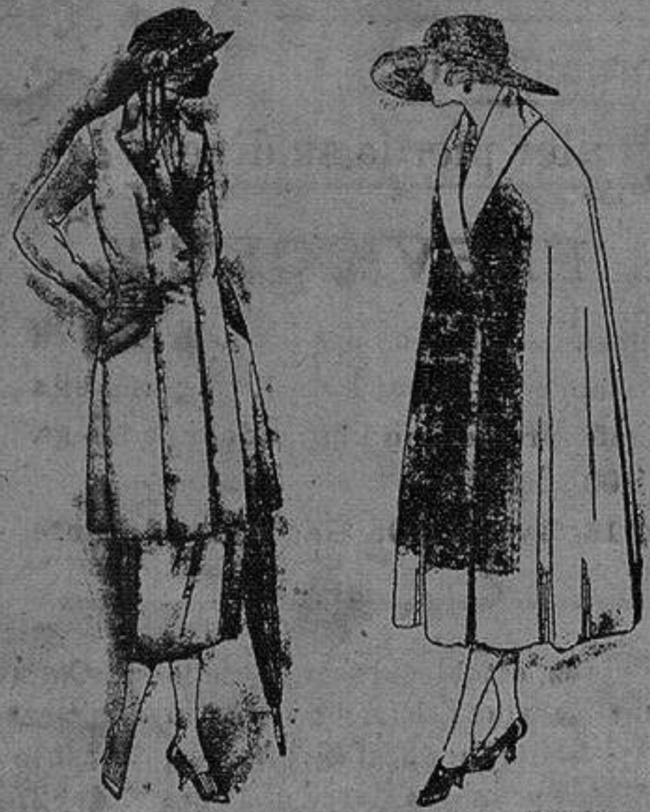
Trajes de sarga inglesa, cheviot, en negro azul y color. de pta 140 a 200.

Altamira, 2 :: Alicante :: Victoria, 1 Sucursales: Madrid, Barcelona, Almeria, Bilbao, Cadiz, Cartagena, Gijón, Granada, Málaga, Palma de Mallorca, Santander, Sevilla, Valencia, Valladolid, Zaragoza