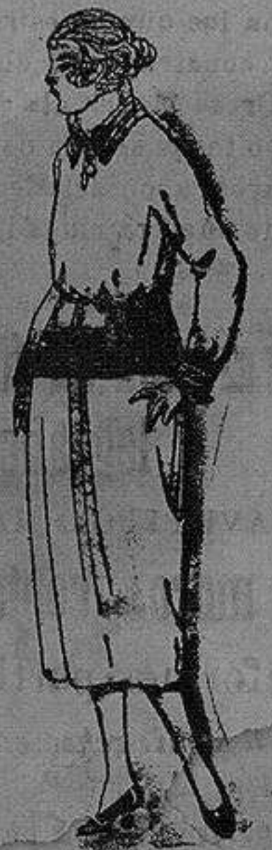
Paletots de punto de lana, hechos a mano, de ptas. 17.50 a 25

Ropas confeccionadas para Caballero, Señora, Niño y Niña