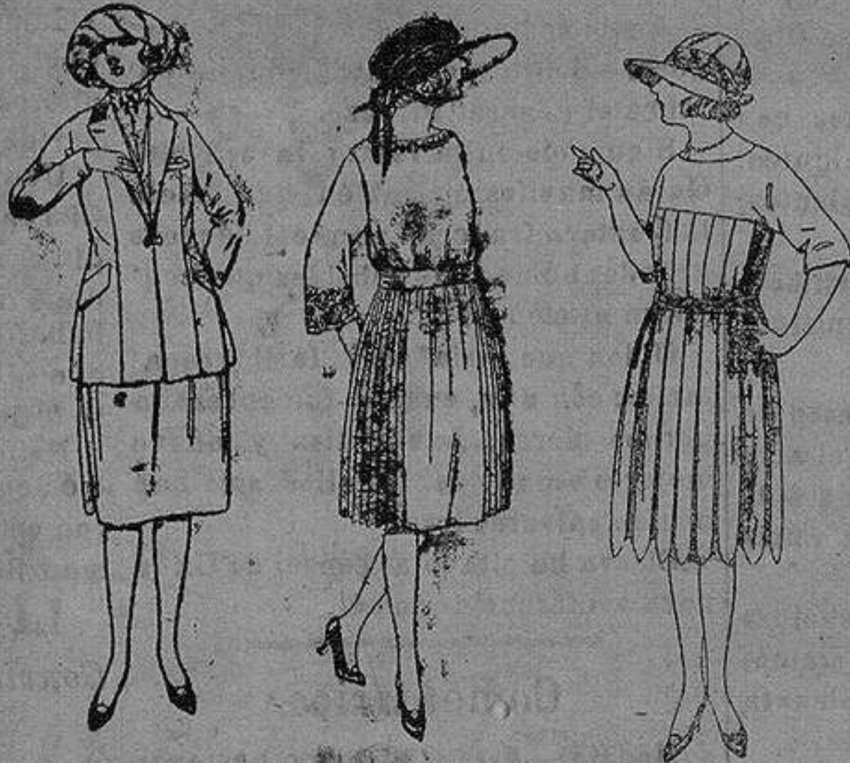
Trajes de sarga inglesa, gabardina etc., en azul y color. de ptas. 85 a 100