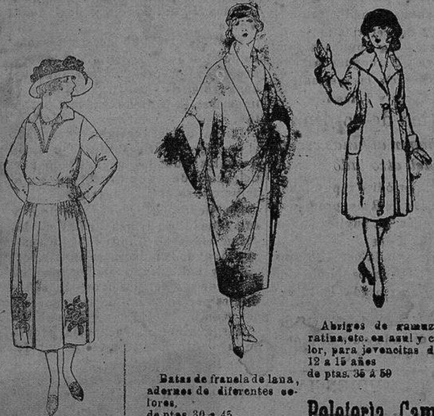
Abrigos de gamuza ratina, etc., en azul y color, para jovencitas de 12 a 15 años de ptas. 35 a 50