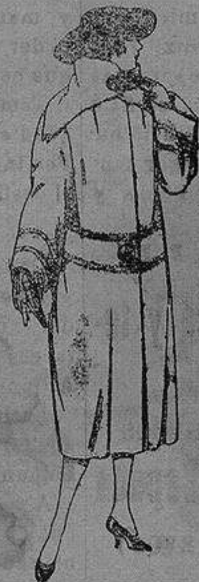
Abrigos de terciopelo de lana, ratina, etc., en negro, azul color, adorno pespunte seda de ptas. 120 a 200