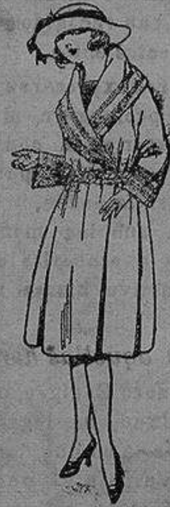
Abrigos de terciopelo de lana, gamuza, etc., en negro, azul y color, para jovencitas de 12 a 15 años, de ptas. 55 a 95