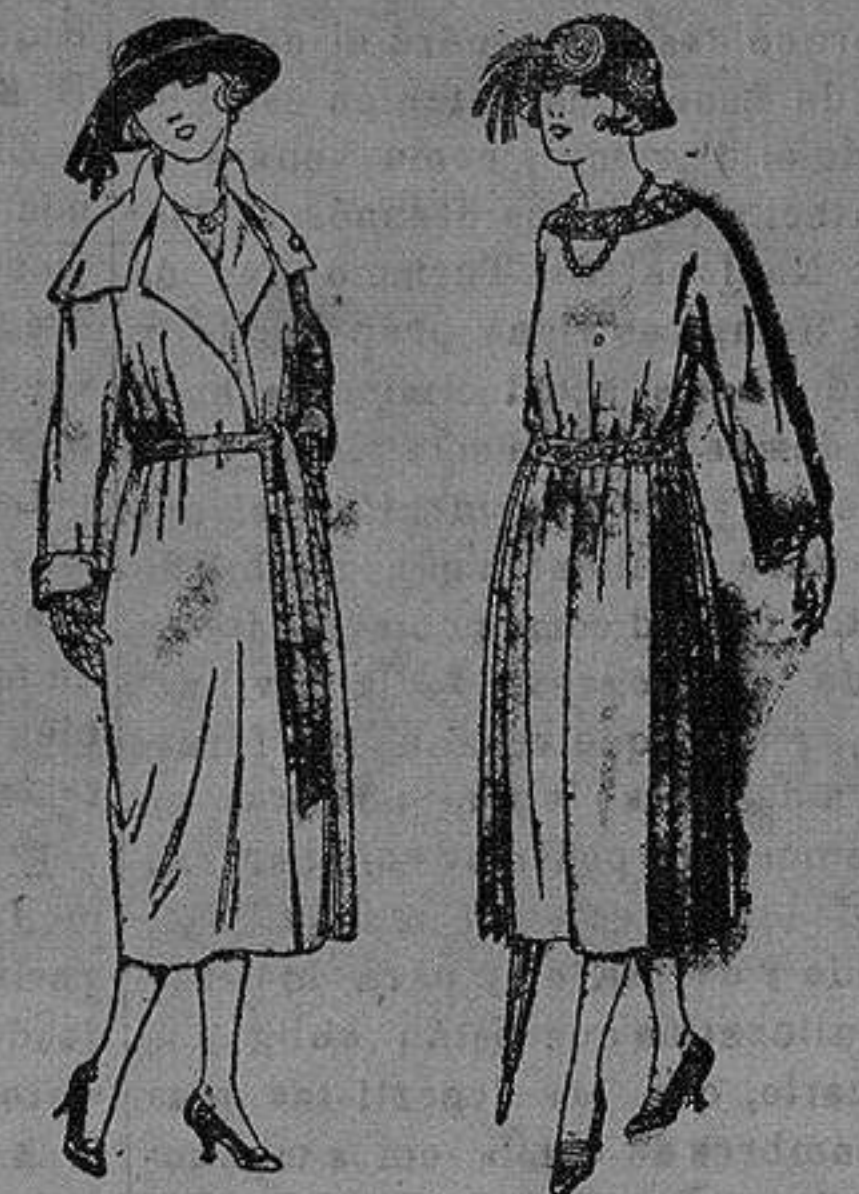
Abrigos de gamuza, cheviot, etc., en negro, azul y color, de ptas 50 a 100