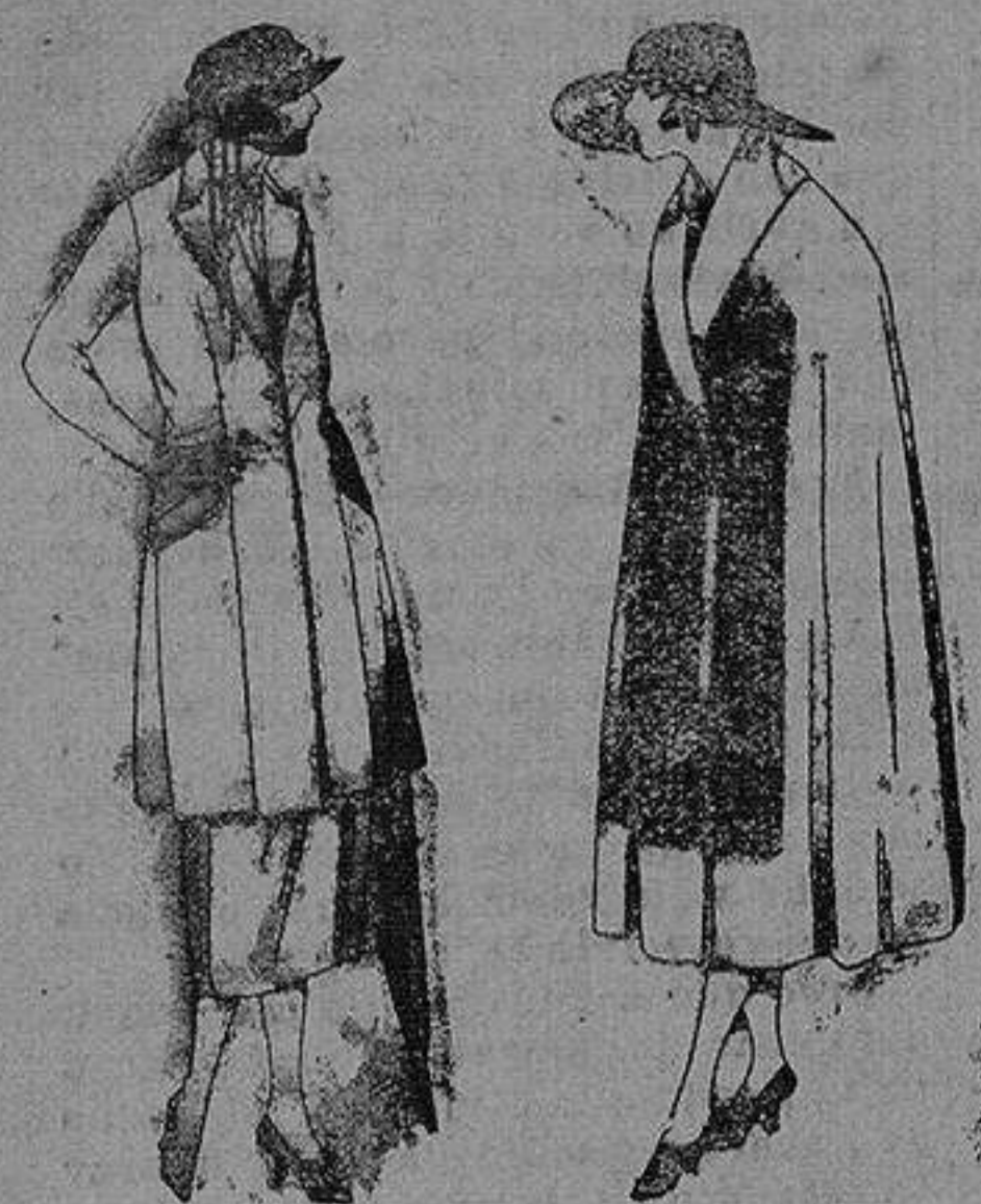
Trajos de sarga inglesa, hueriet, en negro azul y color. de pta 140 a 200.

Altamira, 2 :-: Alicante :-: Victoria, 1 Succursales: Madrid, Barcelona, Almería, Bilbao, Cadiz, Cartagena, Gijón, Granada, Málaga, Palma de Mallorca, Santander, Sevilla, Valencia, Valladolid, Zaragoza