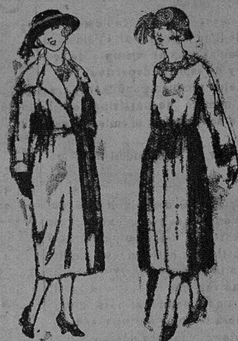
Abrigos de gamuzas, choflet, etc., en negro, azul y color. de pta 80 a 100