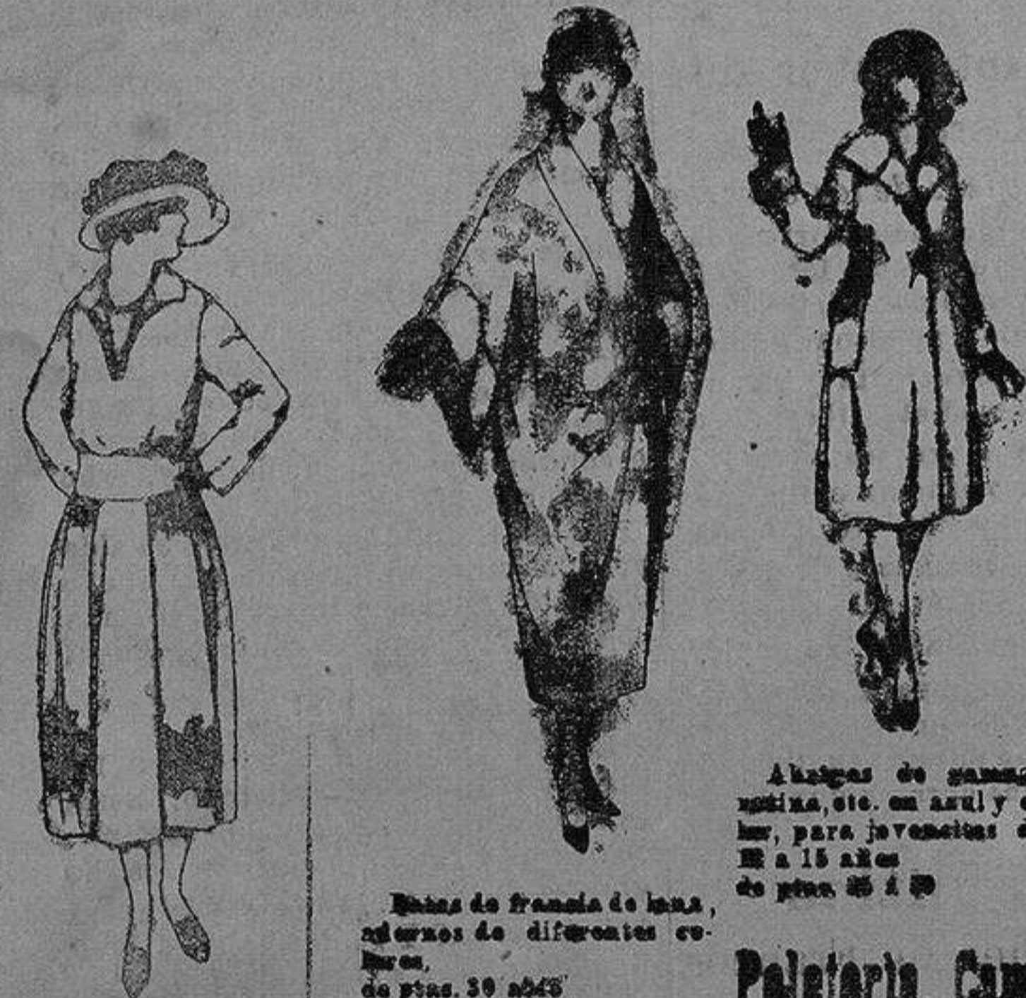
Vestidos de sarga inglesa, estambre, etc., en negro azul y color, adorno bordados a pta. 100 a 140