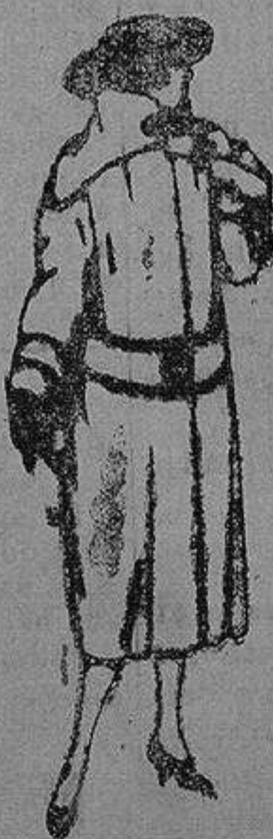
Abrigos de terciopelo de lana, ratina, etc., en negro, azul color, adorno pespunte seda de pta. 120 a 200