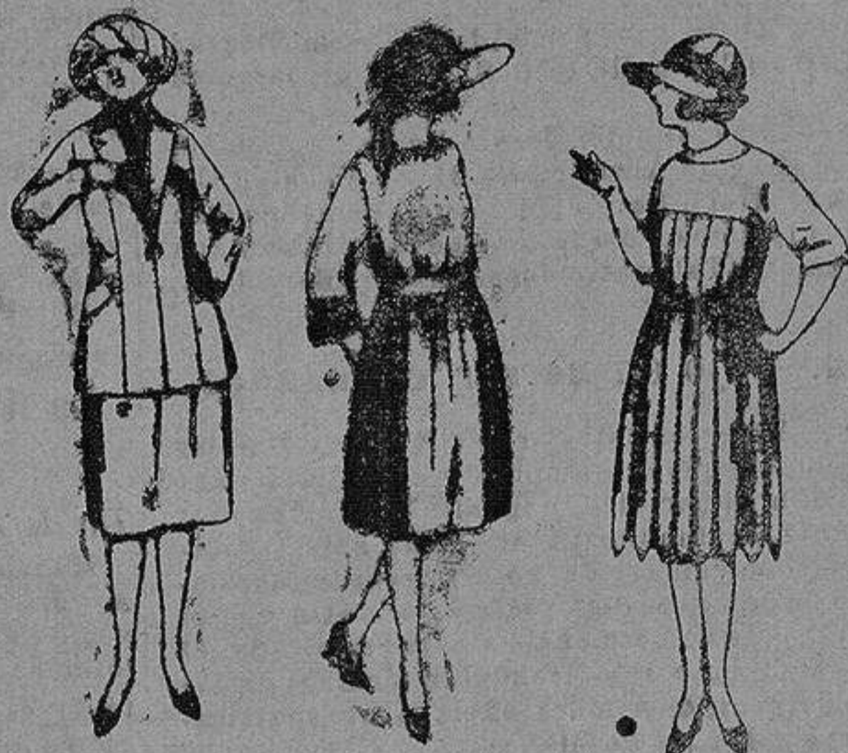
Trajos de sarga inglesa, gabardina etc., en azul y color. de pta. 85 a 140