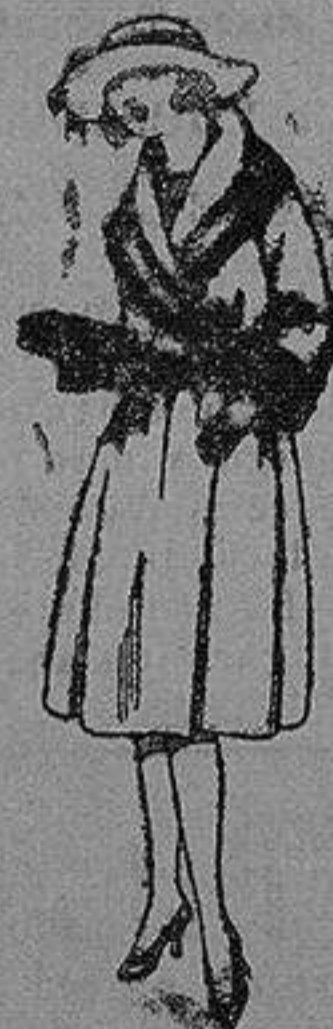
Abrigos de terciopelo de lana, gamuzas, etc., en negro, azul y color, para juveniles de 12 a 15 años. de pta. 35 a 65

Ropas confeccionadas para Caballero, Señora, Niño y Niña