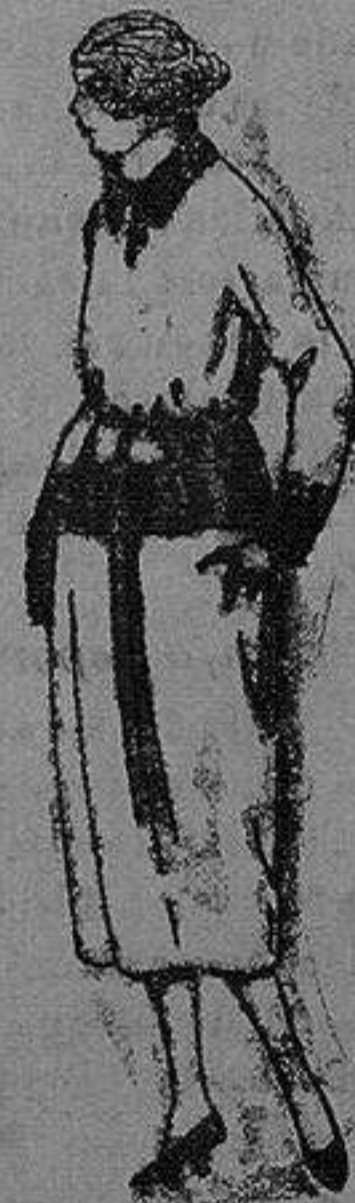
Valeto de punto de lana, hecho a mano. de pta. 17-30 a 25

Paletoria, Caminaria Géneros de punto, Corbatería, Guantería, Sombrerería, Zapatería, Paraguas Bastones y Artículos de Viaje