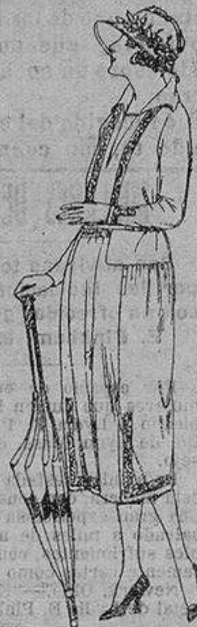
Vestidos sarga inglesa estambre, etc. negro azul color, adornos bordados de ptas 110 a 135