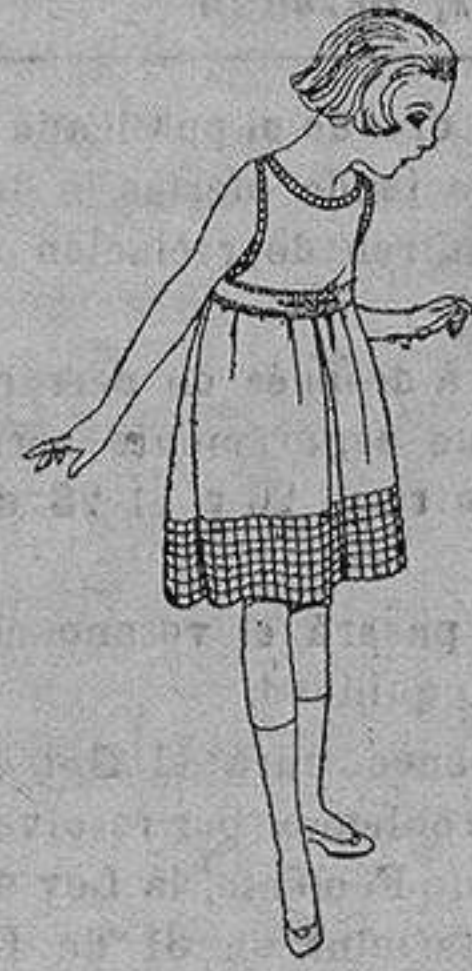
Delantales de voile blanco, combinado con voile estampado para niñas 4 a 6 años de ptas. 8 a 10