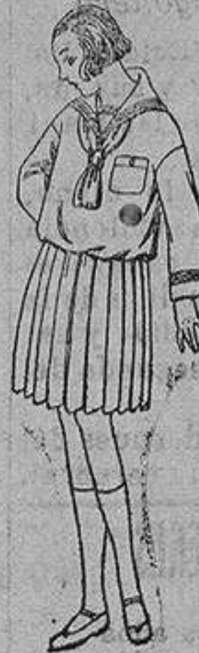
Trajes modelo "Marinera" drill, otomán o satén blanco, para niñas de 4 a 9 años de ptas. 16 a 38 Los mismos de estambre o jerga azul. de ptas 45 a 55.