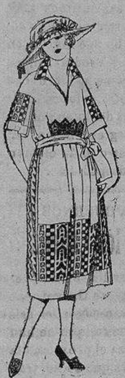
Vestidos crespón blanco y color adornos bordados. de ptas. 70 a 80