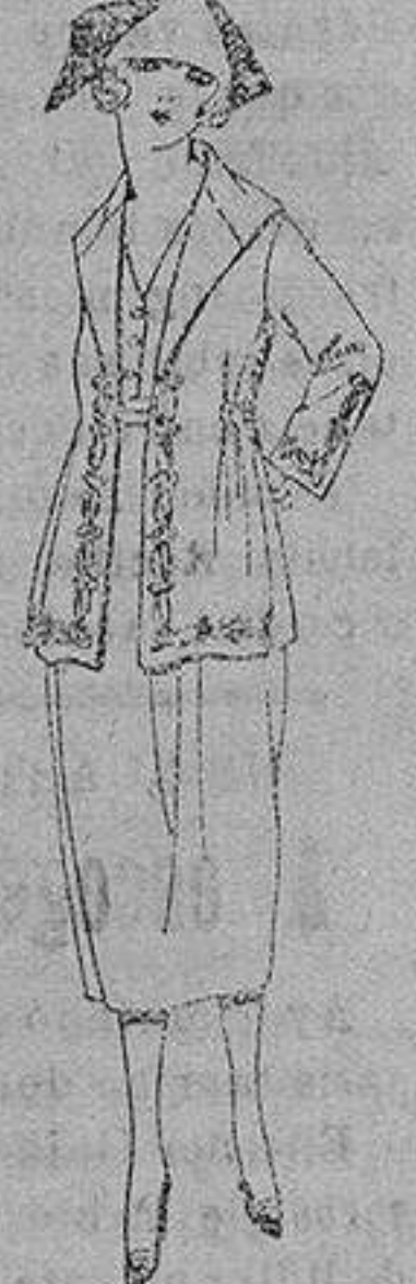
Trajes estambre, sarga inglesa, etc. en negro, azul y color, adornos bordados. de ptas. 170 a 195 Trajes de drill etomán, gabardina, etc. de ptas. 55 a 83