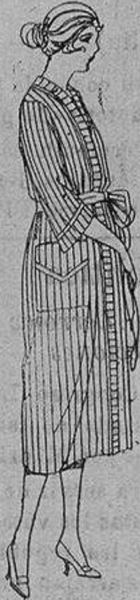
Batas de percal, voile listado etc. de ptas 18 a 30