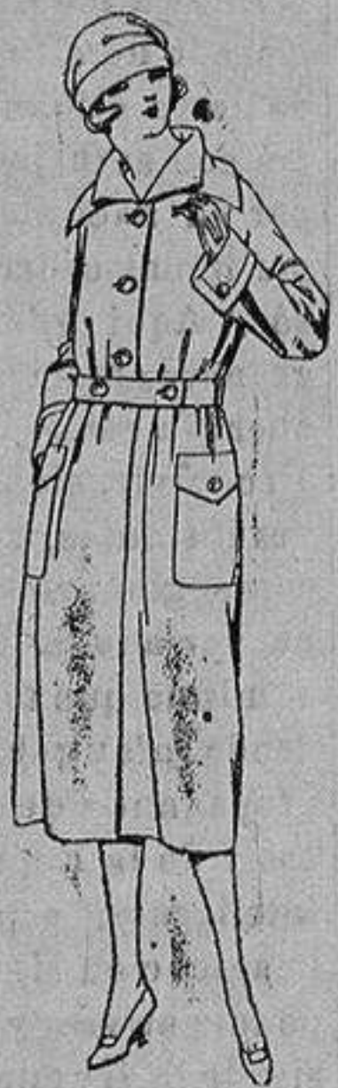
Guardapolvos d drill crudo, gris, etc. de ptas. 12 a 20