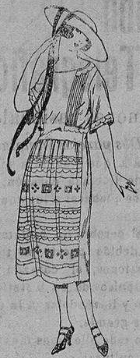
Vestidos de etamin blanco, adornos bordados. de ptas. 55 a 80.