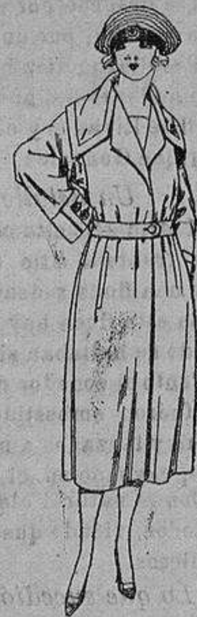
Abrigos gabardina inglesa impermeabilizada, diferentes colores. de ptas. 55 a 260