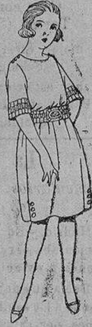
Vestidos lanilla, gabardina, sarga inglesa etc. azul color, adornos bordados jovencitas 13 a 14 años ptas 55 a 80