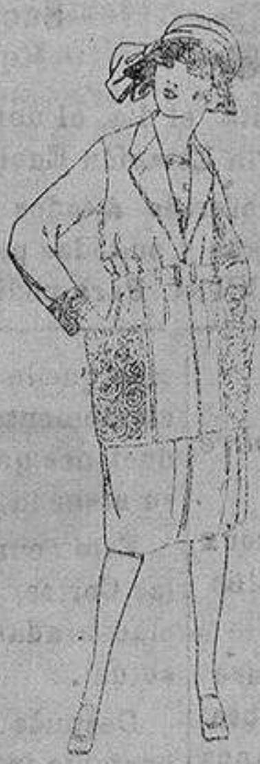
Trajes de gabardina, sarga inglesa, lanilla, etc. en azul y color, adornos bordados, para jovencitas de 13 a 15 años de ptas 95 a 130