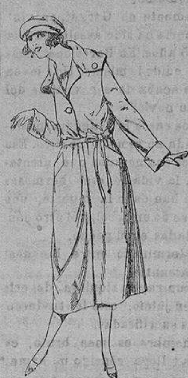
Abrigos de seda impermeables, en negro azul y color. de ptas. 130 a 225

Ropas confeccionadas para Caballero, Señora, Niño y Niña