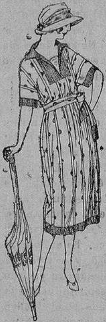
Vestidos de voile labrado, diferentes combinaciones de color. de ptas 58 a 75

Sucursales: Madrid, Barcelona, Almeria, Bilbao, Cádiz, Cartagena, Gijón, Granada, Málaga, Palma de Mallorca, Santander, Sevilla, Valencia, Valladolid, Zaragoza