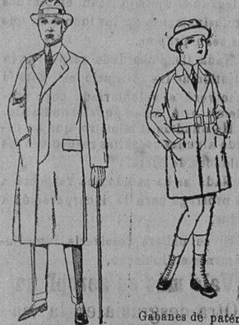
Gabanes de patén gamuza, etc. para niños y jovencitos de 10 a 16 años. de ptas. 30 a 7 Gabanes de cheviot gamuza o patén etcétera. de ptas. 45 a 140.