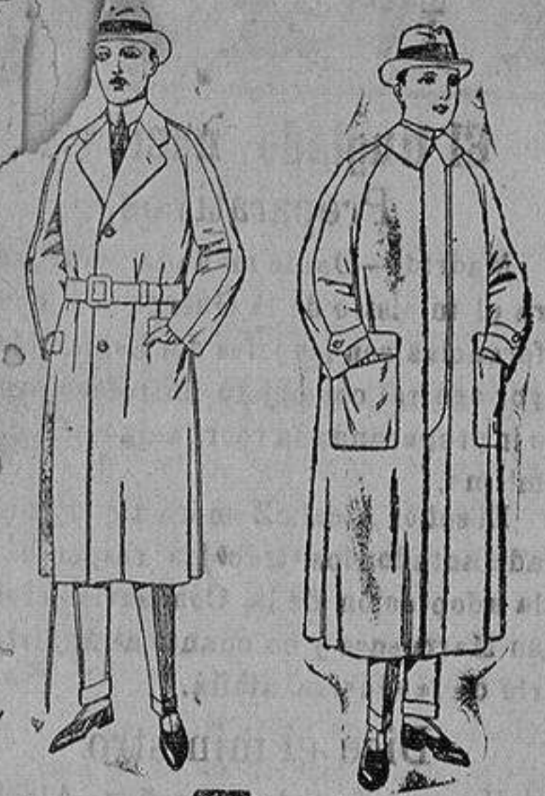
Gabanes raglán de patén, gamusa o co-ver. de ptas. 75 a 200 Impermeables raglán en azul y colores. de ptas. 32 a 170

Altamira, 2 :- Alicante :- Victoria, 1 Sucursales: Madrid, Barcelona, Almeria, Bilbao, Cadiz, Cartagena, Gijón, Granada, Málaga, Palma de Mallorca, Santander, Sevilla, Valencia, Valladolid, Zaragoza