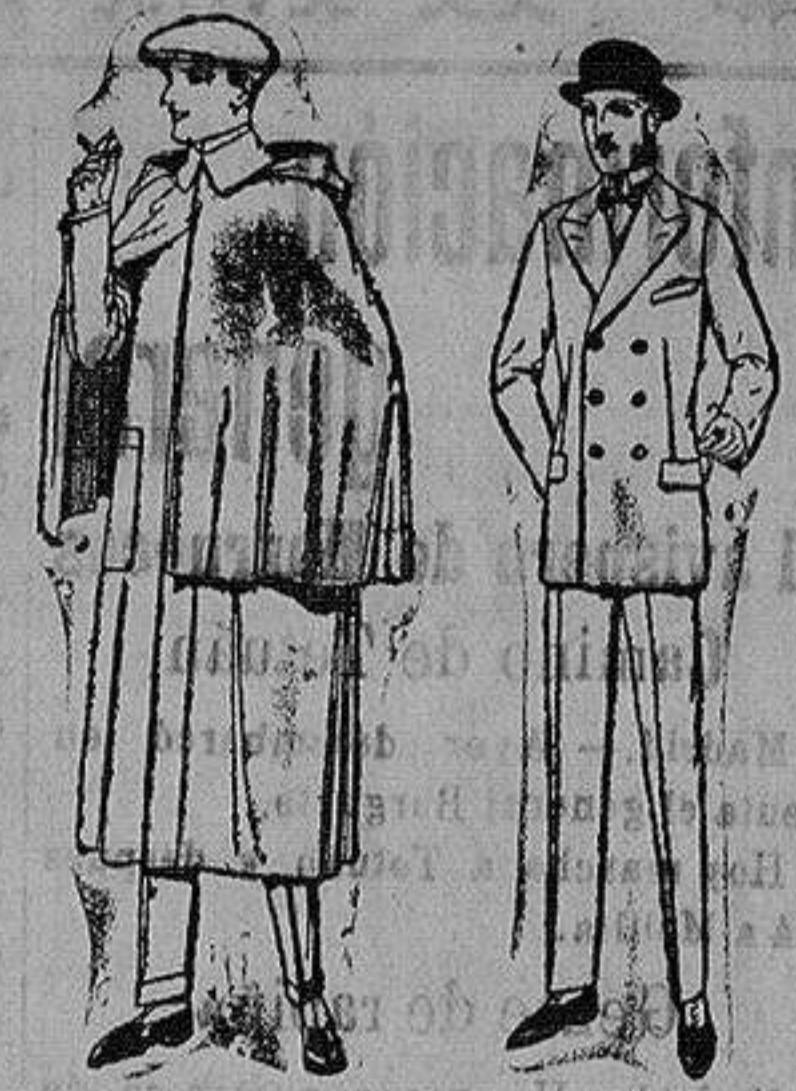
Impermeables mackferland en negro y azul de ptas. 85 a 157 Trajes de melton, cheviot, es-tambre, vicuña o jerga. de ptas. 50 a 175.