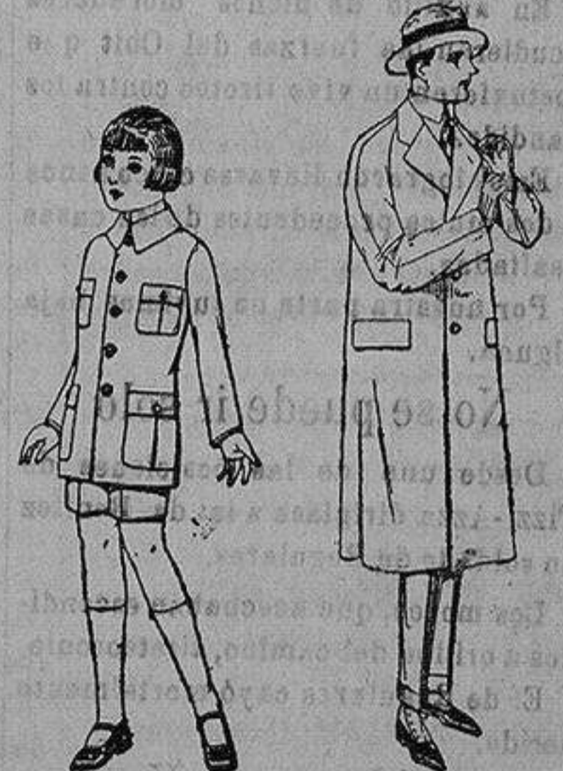
Trajes de patén modelo Sport, para niños de 4 a 9 años. de ptas. 22 a 35. Gabanes raglán de patén, melton, cheviot, con forro de seda o satén. de ptas. 60 a 160

Ropas confeccionadas para Caballero, Señora, Niño y Niña Boas, Camisería, Géneros de punto Corbatería, Guantería, Sombrerería Zapatería, Paraguas Bastones y Artículos de Viaje