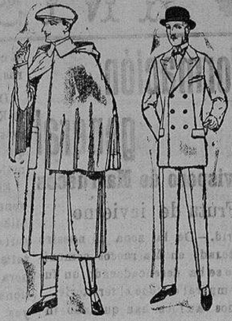
Impermeables mackferland en negro y azul de ptas. 85 a 157 Trajes de melton, cheviot, es-tambre, vicuña o jerga. de ptas. 50 a 175.