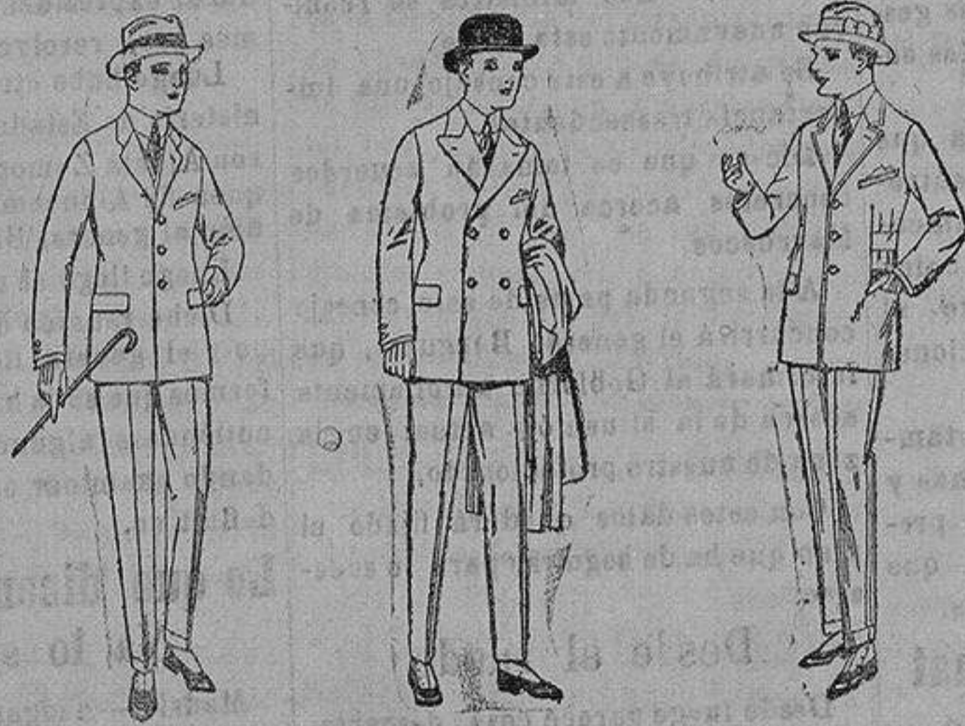
Trajes de patén vicuña o jerga, para niños y jovencitos de 10 a 16 años. de ptas. 30 a 85. Trajes de patén, vicuña etc. para niños y jovencitos de 10 a 16 años. de ptas. 32 a 85. Trajes de patén, vicuña o jerga forma Sport, para niños y jovencitos de 10 a 16 años. de ptas. 40 a 85.