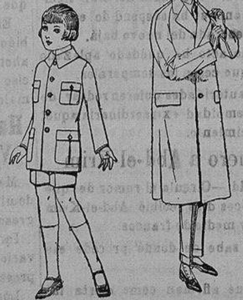
Trajes de patén modelo Sport, para niños de 4 a 9 años. de ptas. 22 a 85. Gabanes raglán de patén, melton, cheviot, con forro de seda o satén. de ptas. 60 a 160

Ropas confeccionadas para Caballero, Señora, Niño y Niña