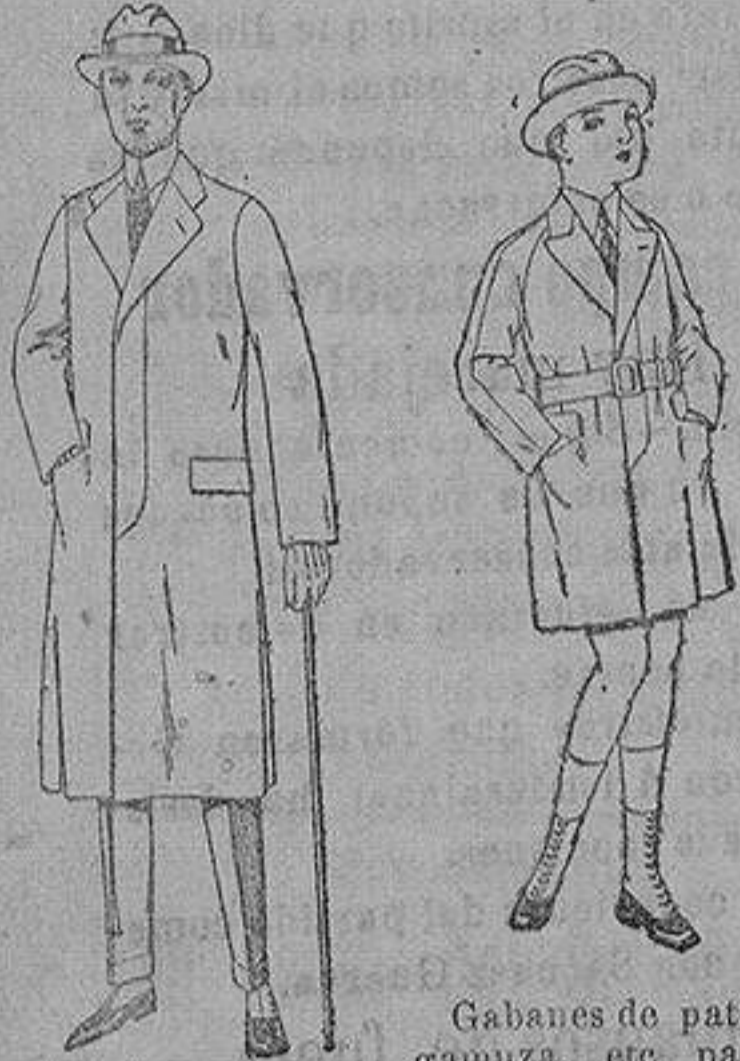
Gabanes de patén gamusa, etc. para niños y jovencitos de 10 a 16 años. de ptas. 30 a 7 Gabanes de cheviot gamusa o patén etcétera. de ptas. 45 a 140.