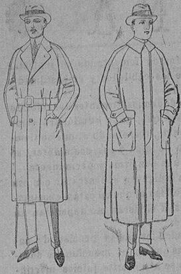
Gabanes raglán de patén, gamusa o cober. de ptas. 75 a 200 Impermeables raglán en azul y colores. de ptas. 32 a 170

Sucursales: Madrid, Barcelona, Almeria, Bilbao, Cadiz, Cartagena, Gijón, Granada, Málaga, Palma de Mallorca, Santander, Sevilla, Valencia, Valladolid, Zaragoza