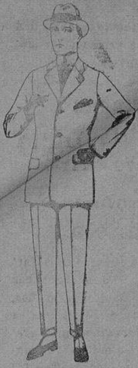
Trajes de cheviot, patén etc de ps. 85 a 135

Sucursales: Madrid, Barcelona, Almeria, Bilbao, Cadiz, Cartagena, Gijón, Granada, Málaga, Palma de Mallorca, Santander, Sevilla, Valencia, Valladolid, Zaragoza