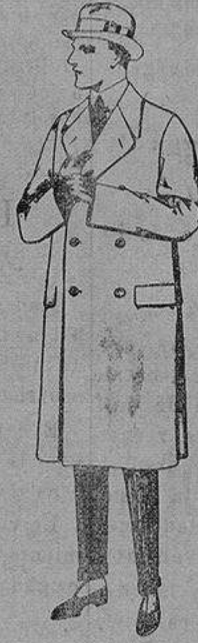
Gabanes de patén, gamuza o cower. de ptas. 60 a 200