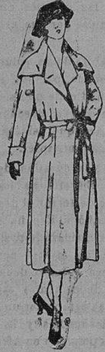
Abrigos de seda, impermeables. de ptas. 120 a 225

Ropas confeccionadas para Caballero, Señora, Niño y Niña Peletería, Camisería, Cónicos de punto, Corbatería, Guantería, Sombrerería, Zapatería, Paraguas Bastones y Artículos de Viaje