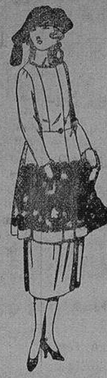
Trajes de gamuza, adornos bordados y con piel, en negro, azul y color de ptas. 180 a 230