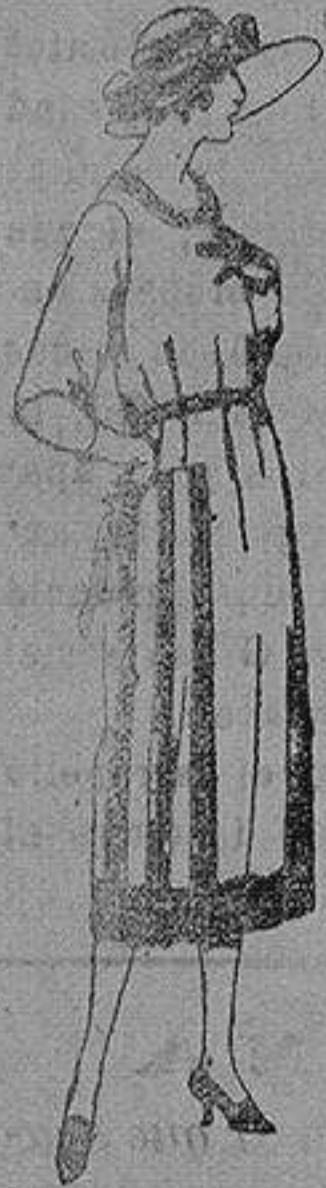
Vestido de estambre, tricelina, gabardina, etc. en negro azul y color, adornos bordados. de ptas. 110 a 150