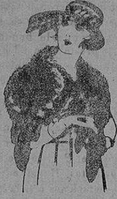
Cuello piel Renardina en blanco, marrón, gris y negro. de ptas. 18 a 40