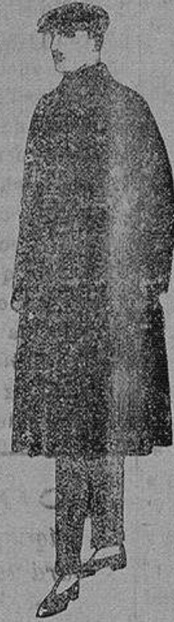
Gabanes de patén, Cheviot o cower. de ptas. 55 a 160