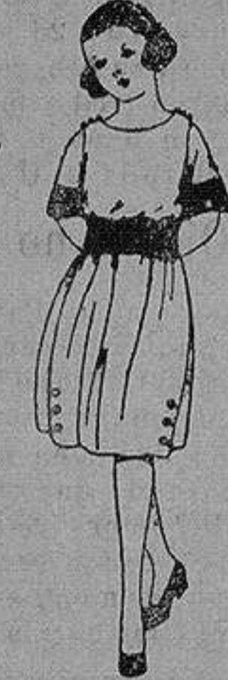
Vestidos de sarga inglesa, lanilla etc en azul y color adornos bordados para niñas de 4 a 6 años de ptas. 35 a 45.