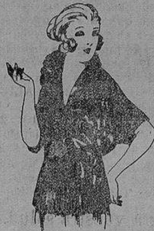
Blusas de Charmense, granadina, etc. en negro, azul y color de ptas. 30 a 55.