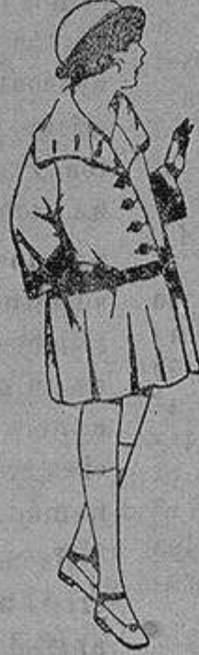
Abrigos de gamuza, ratina, etc. en diferentes colores y dibujos, para niñas de 4 a 12 años. de ptas 35 a 60