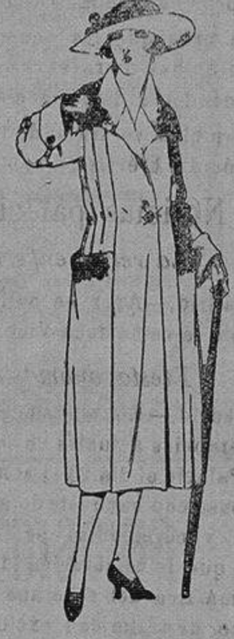
Abrigos de pañete, gamuza etc. en azul y color, adornos bordados. de ptas. 70 a 120