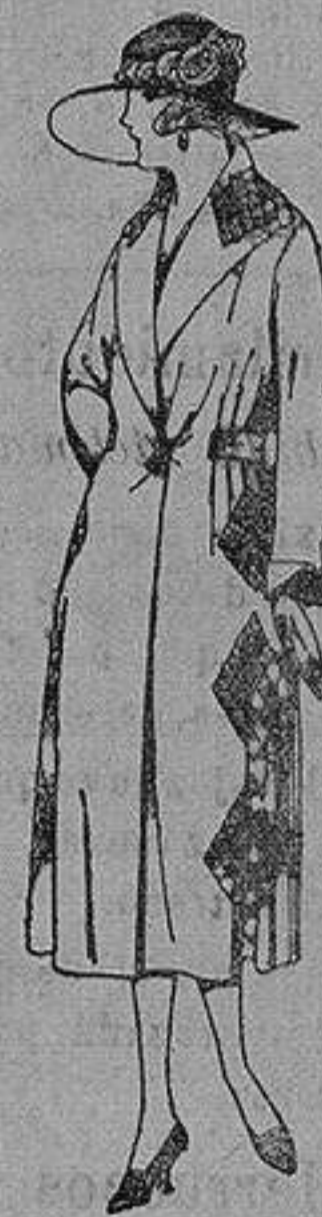
Abrigos de gamuza, ratina, etc. en negro, azul y color adornos y pespunte seda de ptas. 65 a 110

Ropas confeccionadas para Caballero, Señora, Niño y Niña Peletería, Camisería, Cónicos de punto, Corbatería, Guantería, Sombrerería, Zapatería, Paraguas Bastones y Artículos de Viaje