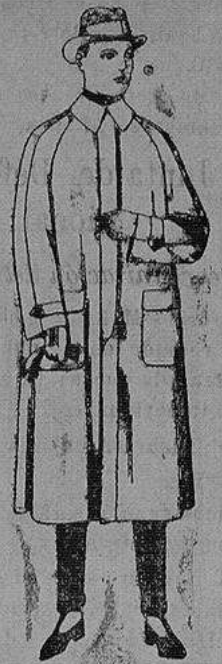
Impermeables raglán en azul y colores. de ptas 40 a 170