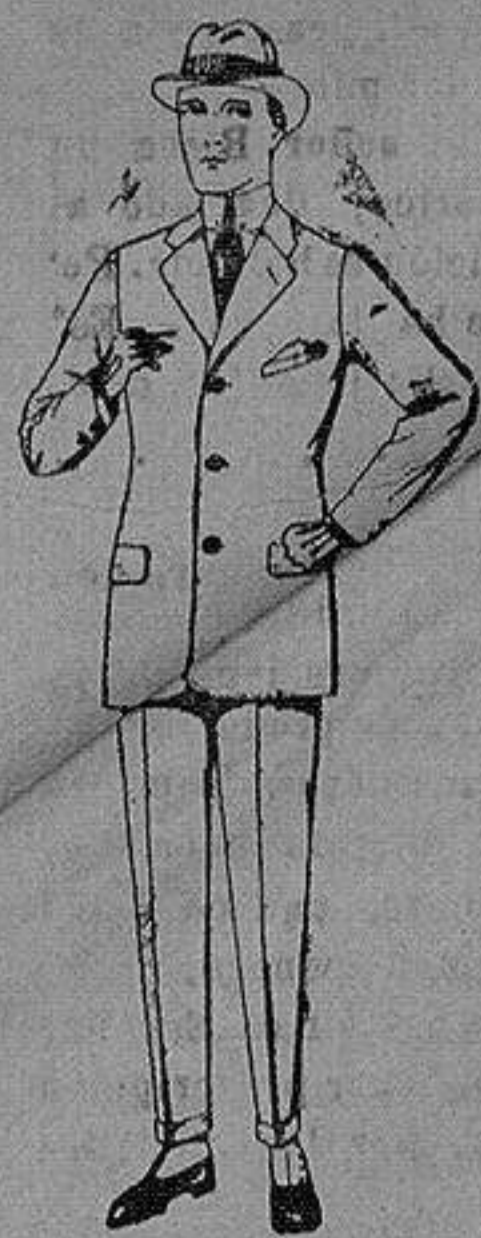
Trajes de cheviot, patén etc de ptas. 85 a 135

Sucursales: Madrid, Barcelona, Almería, Bilbao, Cadiz, Cartagena, Gijón, Granada, Málaga, Palma de Mallorca, Santander, Sevilla, Valencia, Valladolid, Zaragoza