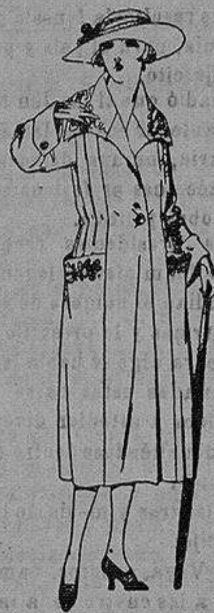
Abrigos de pañete, gamuza, etc. en azul y color, adornos bordados. de ptas. 70 a 120