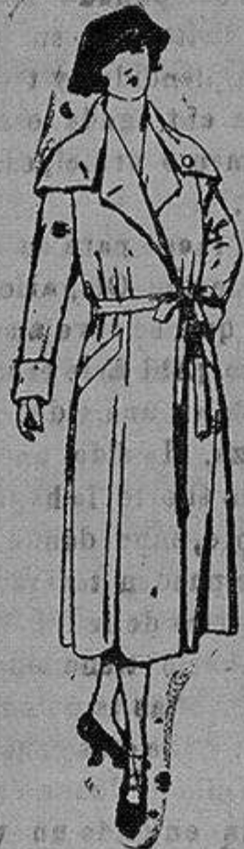
Abrigos de seda impermeables. de ptas. 130 a 225

Repas confeccionadas para Caballero, Señora, Niño y Niña Pelotería, Camisería Géneros de punto Corbatería, Guantería, Sombrerería, Zapatería, Paraguas Bastones y Artículos de Viaje