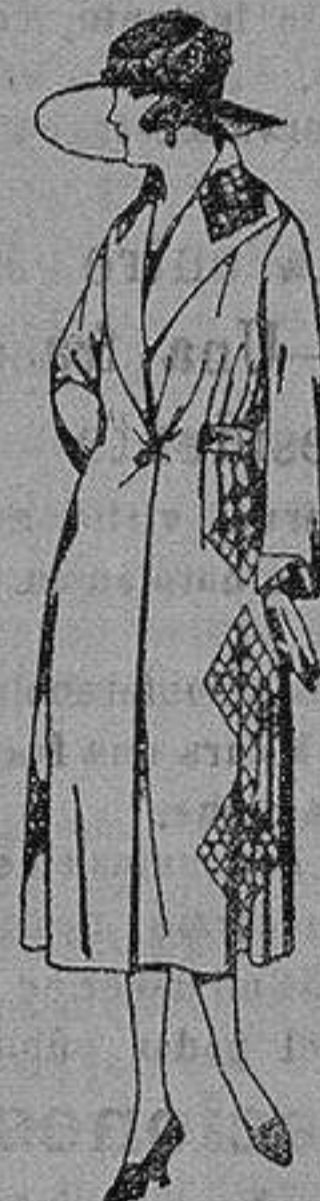
Abrigos de gamuza, ratina, etc. en negro, azul y color, adornos y respuntes seda. de ptas. 65 a 110

Repas confeccionadas para Caballero, Señora, Niño y Niña Pelotería, Camisería Géneros de punto Corbatería, Guantería, Sombrerería, Zapatería, Paraguas Bastones y Artículos de Viaje