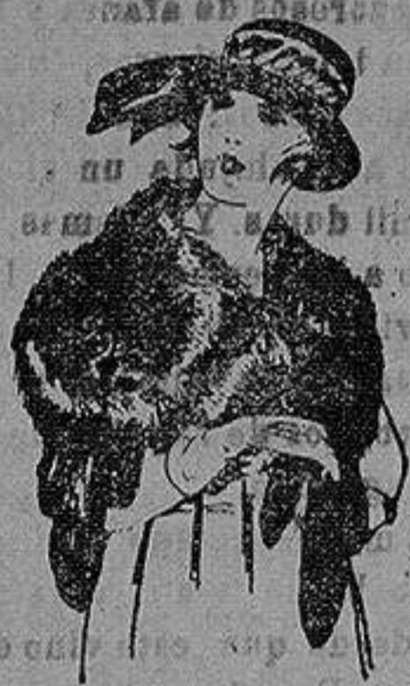
Cuello piel Renardina en blanco, marrón, gris y negro. de ptas. 18 a 40