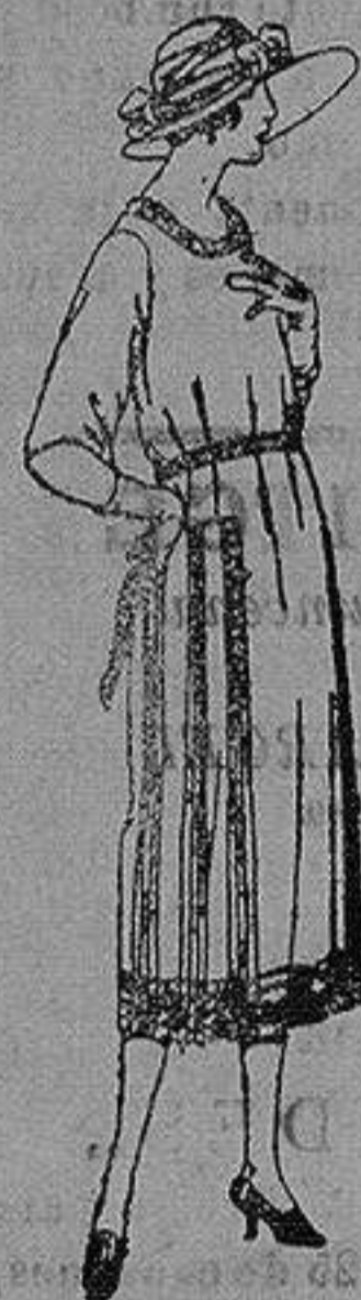
Vestido de estambre, tricotina, gabardina, etc. en negro azul y color, adornos bordados. de ptas. 110 a 150