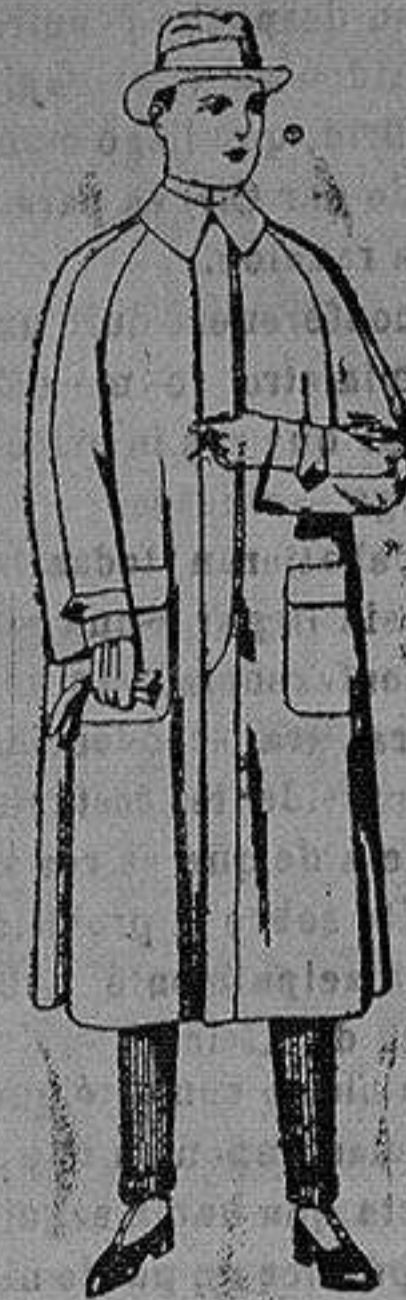
Impermeables raglán, en azul y colores. de ptas. 40 a 17