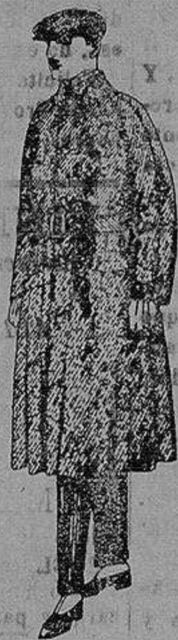
Gabanes de patén. Cheviot cover. de ptas. 65 a 160