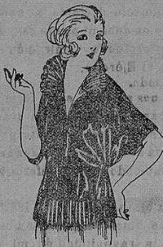
Blusas de Charmense, granadina, etc. en negro, azul y color. de ptas. 30 a 55.