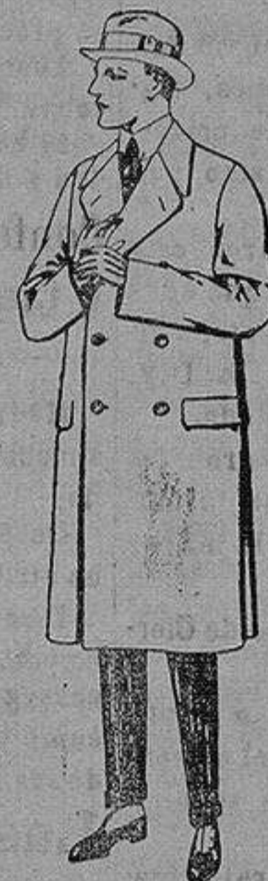
Gabanes de patén, gamuza o cover. de ptas. 60 a 200