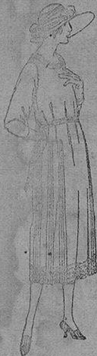
Vestido de estambre, tricofina, gata, etc. en negro azul y color, adornos bordados. de ptas. 110 a 150