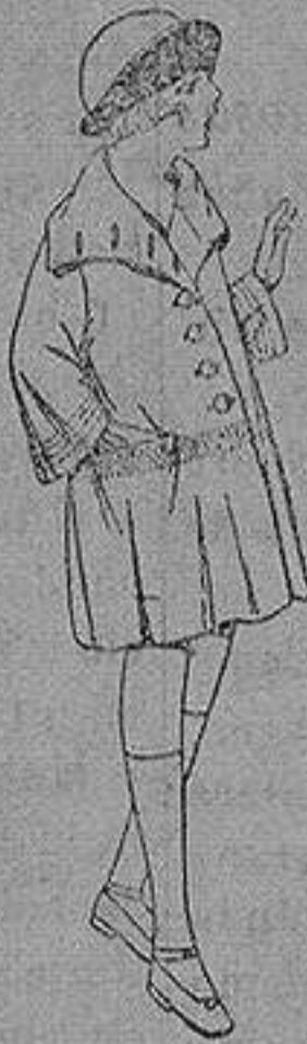
Abrigos de gamuza ratina, etc. en diferentes colores y dibujos, para niñas de 4 a 12 años. de ptas 35 a 60