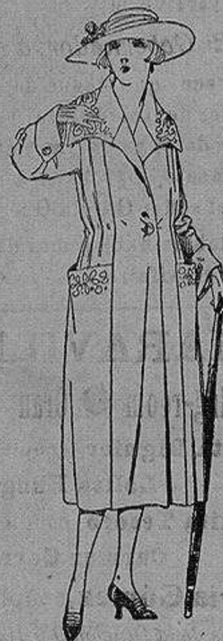
Abrigos de pañete, gamuza, etc., en azul y color, adornos bordados. de ptas. 70 a 120