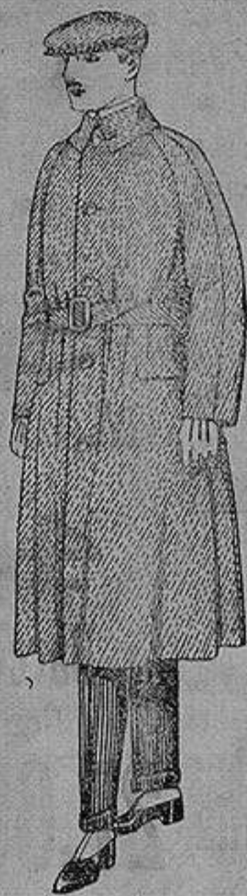
Gabanes de patén, Cheviot cover. de ptas. 90 a 160