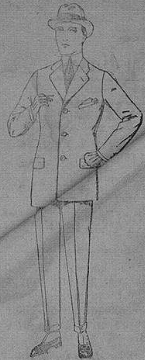
Trajes de cheviot, patén etc de ptas. 88 a 135

Sucursales: Madrid, Barcelona, Almeria, Bilbao, Cadiz, Cartagena, Gijón, Granada, Málaga, Palma de Mallorca, Santander, Sevilla, Valencia, Valladolid, Zaragoza