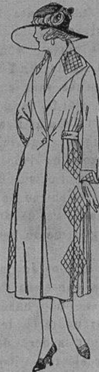
Abrigos de gamuza, ratina, etc. en negro, azul y color, adornos y pespunte seda de ptas. 65 a 110

Ropas confeccionadas para Caballero, Señora, Niño y Niña Pelotería, Camisería Géneros de punto Corbatería, Guantería, Sombrerería, Zapatería, Paraguas Bastones y Artículos de Viaje