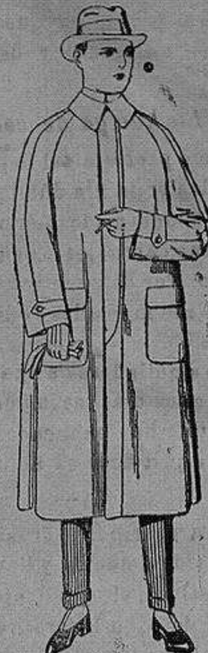
Impermeables raglán, en azul y colores. de ptas. 40 a 170