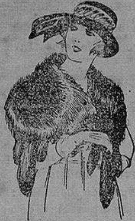
Cuello piel Renardina en blanco, marrón, gris y negro. de ptas. 18 a 40