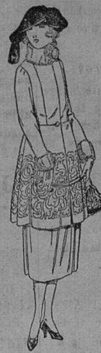
Trajes de gamuza, adornos bordados y con piel, en negro, azul y color de ptas. 180 a 230