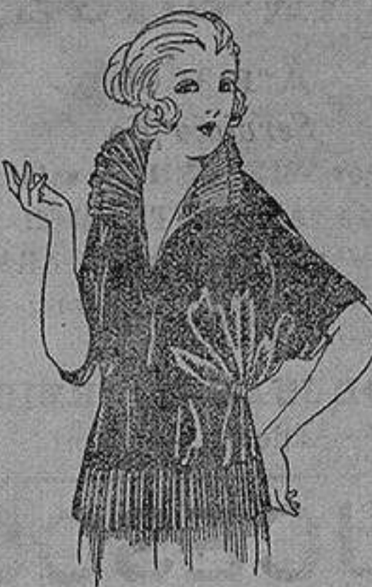
Blusas de Charmense, granadina, etc. en negro, azul y color de ptas. 30 a 55.