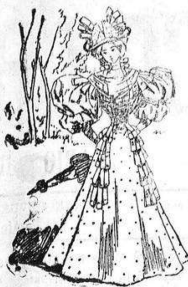
MODELO NUMERO 2.

De seda, alta novedad; delantero plegado y ajustado al talle con una tira de entredoses en cada lado, sujetos ambas por dos lados de cinta; cuello alto con dos lazadas, tambien de cinta; mangas cortas y abrochadas, falda forma campana con dos tiras de entredoses en el delantero, finalizando con un chous de cinta en cada uno.