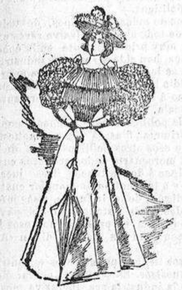
Traje para campo.

Cuerpo de gasa, flojo en el delantero, por donde pasan unas cintas que se prolongan hasta la mitad de él formando lazadas, las cuales empiezan en la cintura; manga corta y abollada con tres lazadas de cinta en el hombro, cuello tambien de cinta con un lazo el cual se abrocha por detrás; falda de seda mordoré forma campana.