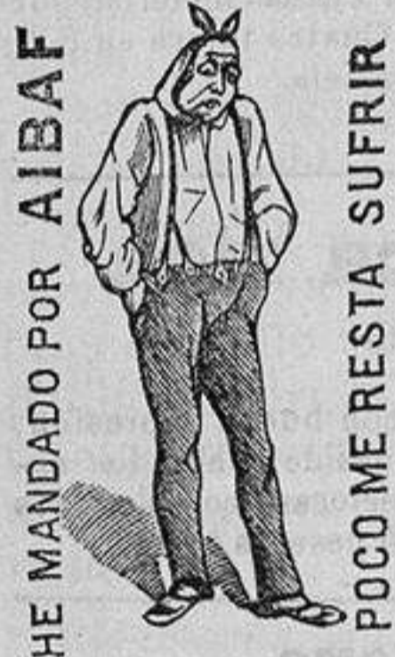
HE MANDADO POR AIBAF