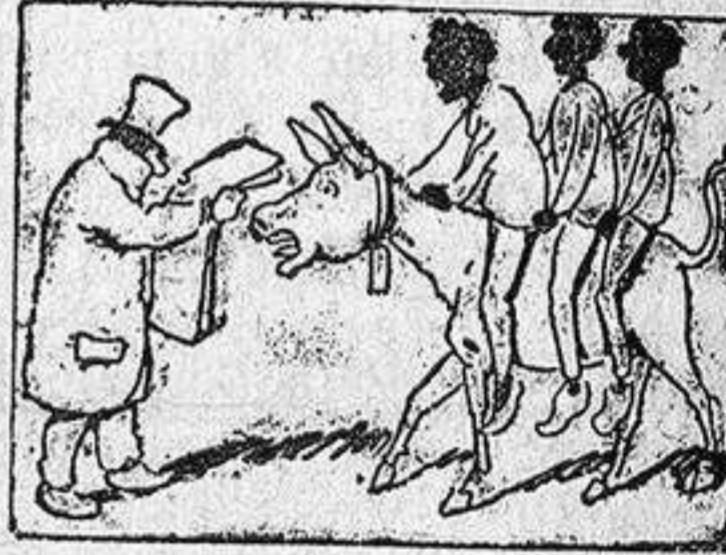
La solución en el número próximo.