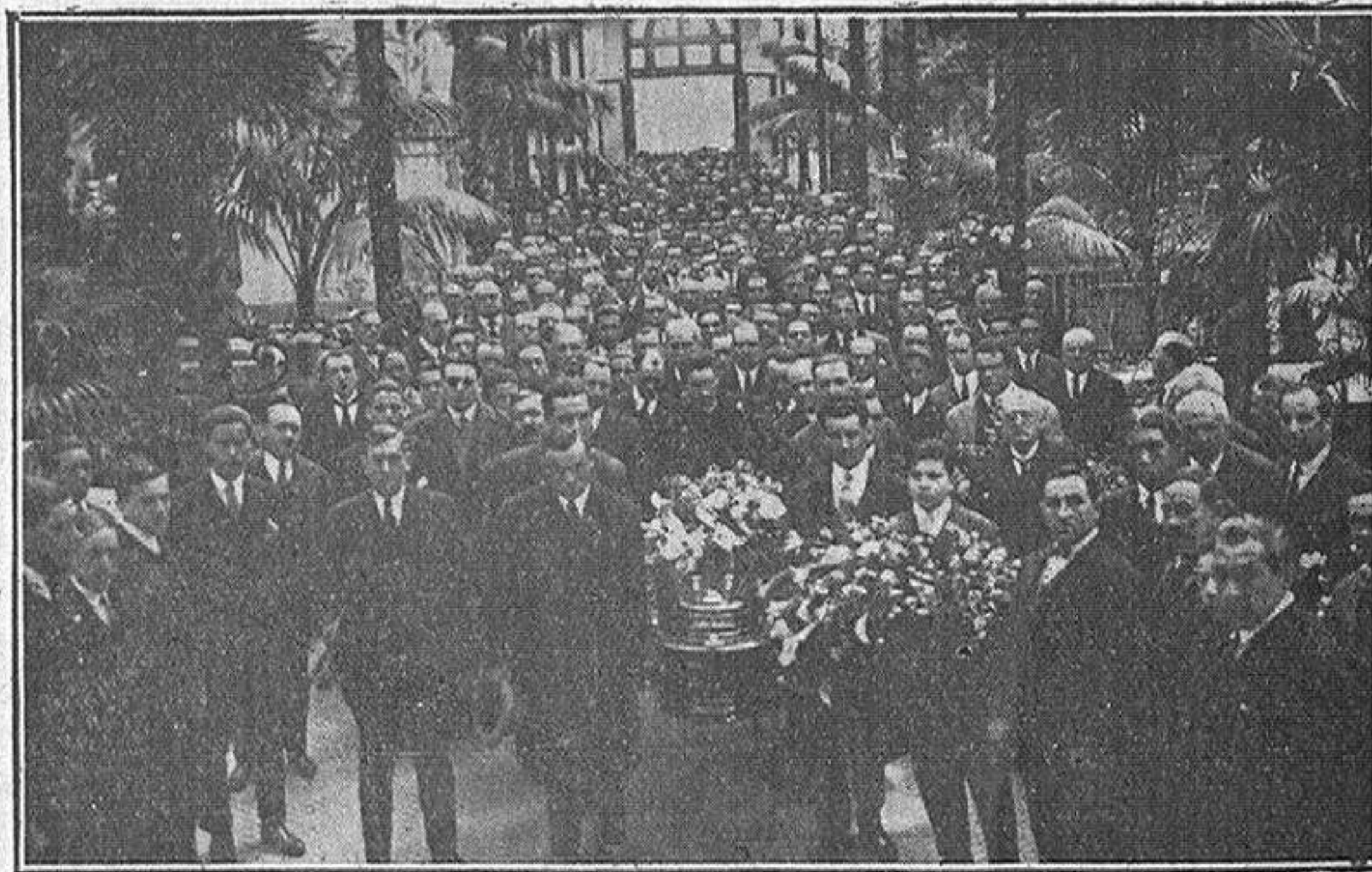
La concurrencia penetrando en el Cementerio Central

En medio de sus afanes soñaba con visitar el solar que dejara en su juventud, y hace