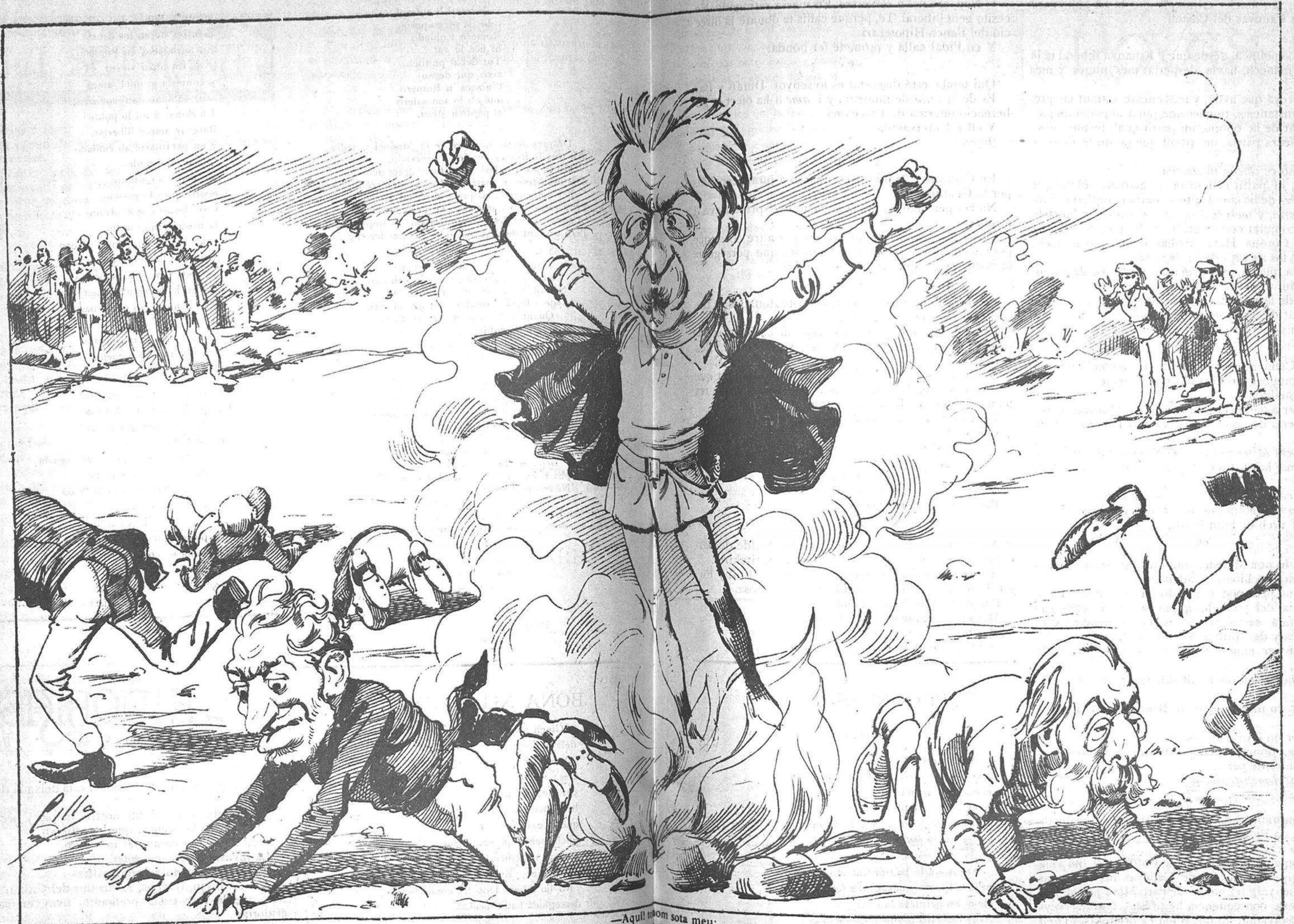
—Aquell hom sota meu: perque jo soc mes que Deu.