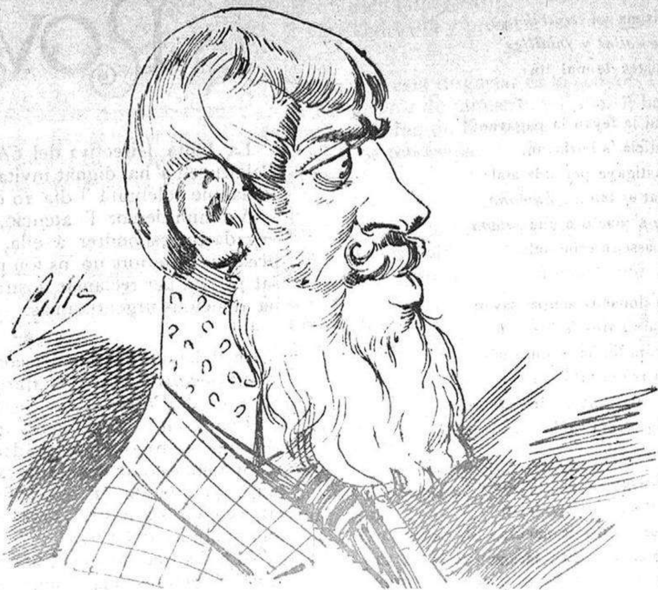
—Gracias á Deu que podré torná á cobrar los cinch destinos...