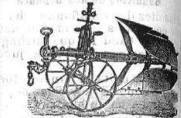
BRAVANT Bajac, grandes premios. Los demas son imitaciones inferiores. 30-80