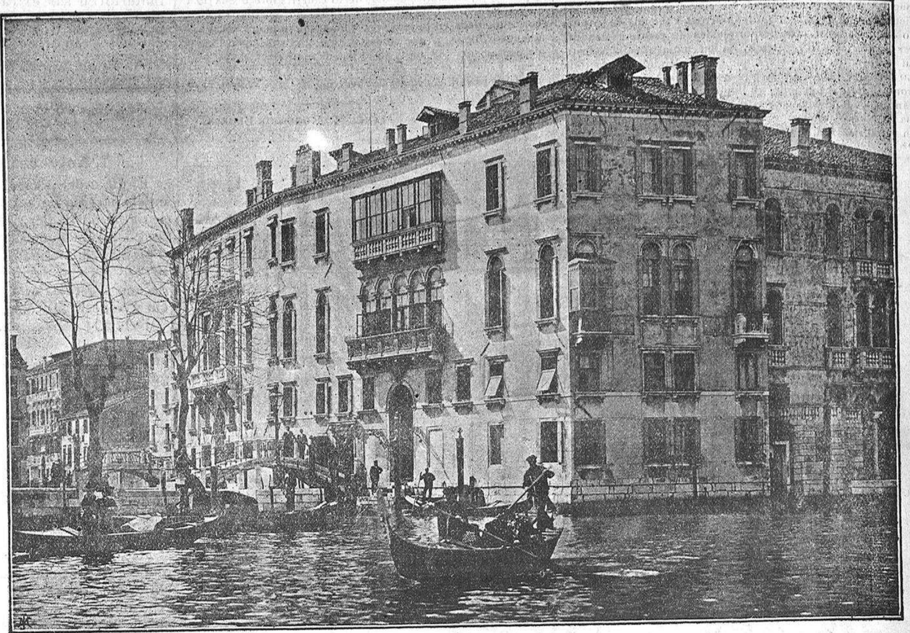
Residencia dels Srs. Duchs de Madrit.

Establiment Tipogràfic, Casanova, 13; Barcelona.