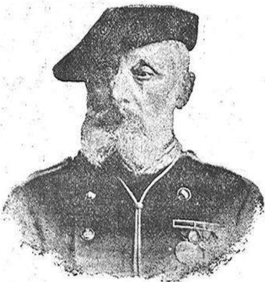
D. Francisco Solá Intendent general de Catalunya.