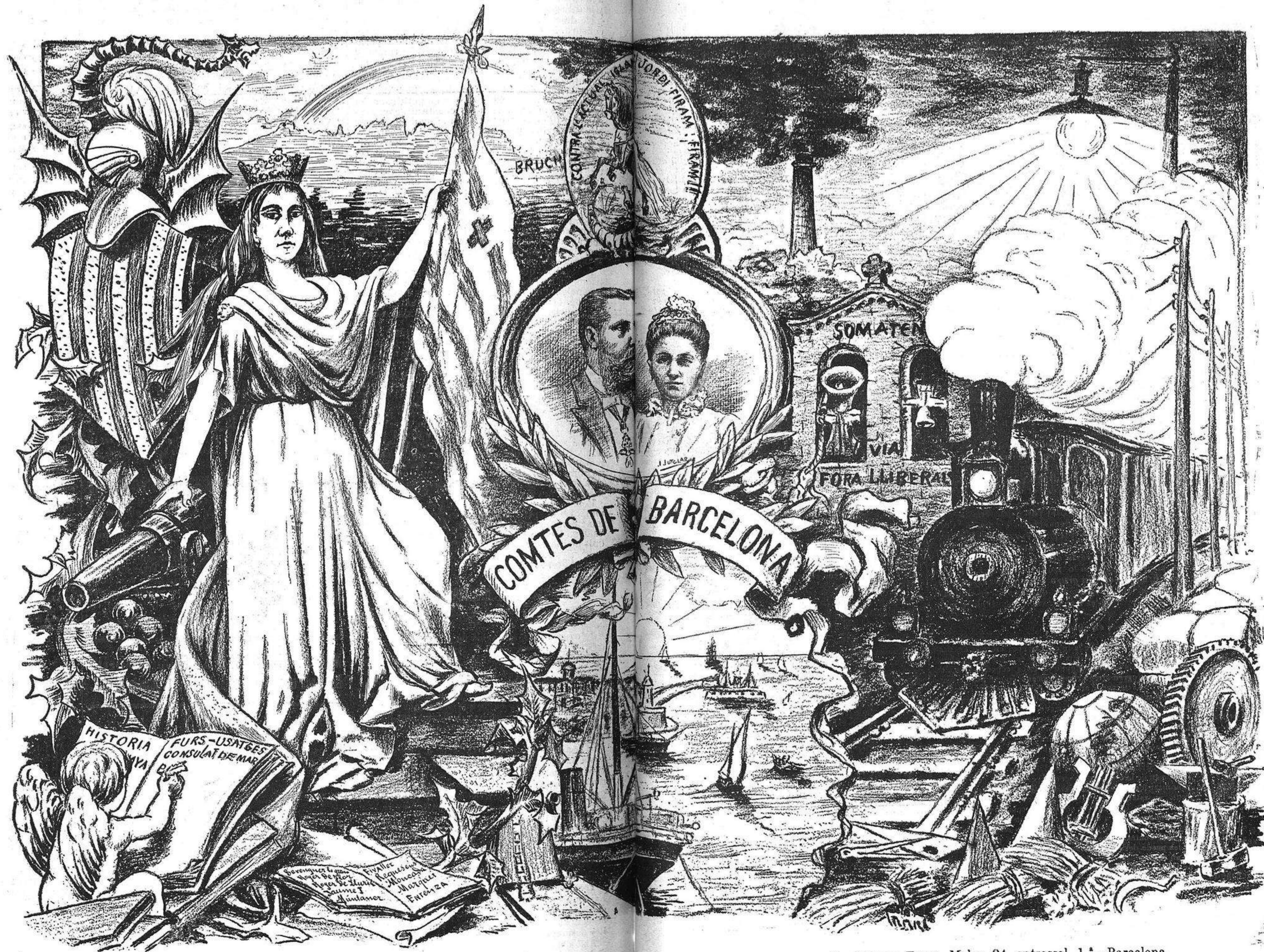
Lo MESTRE TITAS, Molas, 24, entressol, 1. a —Barcelona.