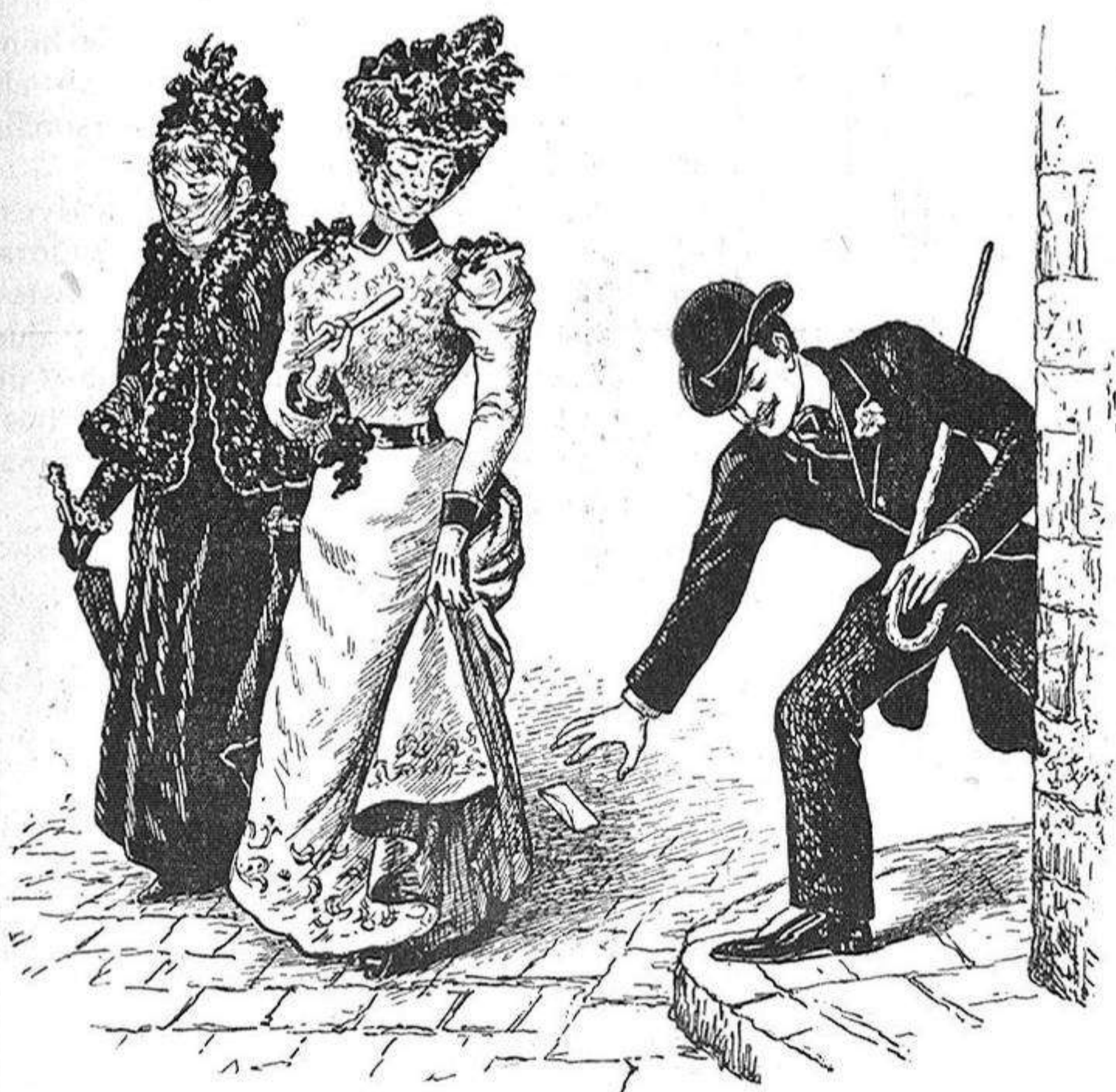
Quan la xicota li escriu la primera carta.