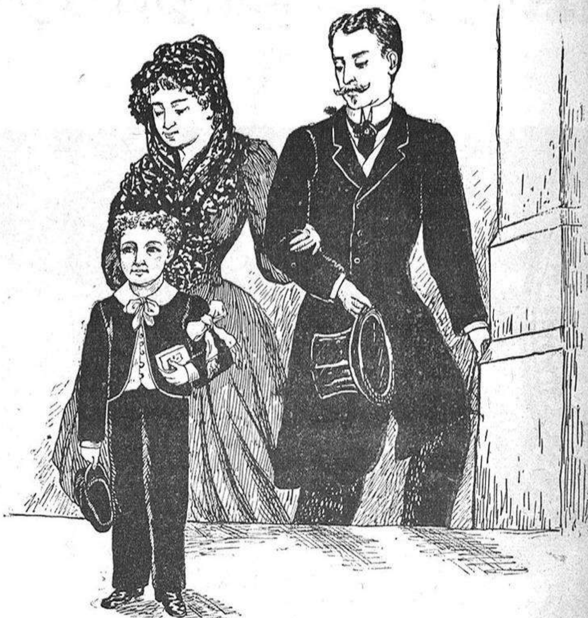
Quan fa la primera Comunió.