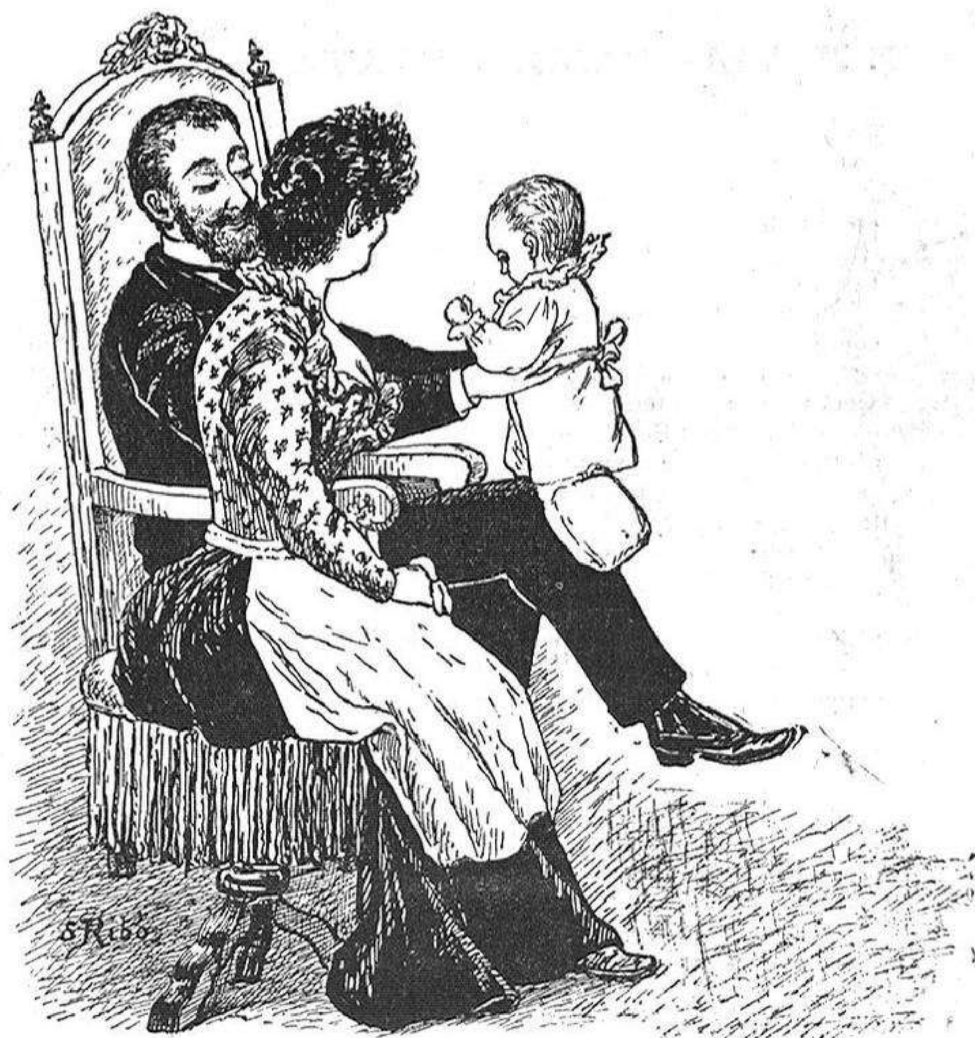
Quan Deu li dona 'l primer fill.

¿Eh? ¿qué tal? Pero, no acabarían may si habían d'apuntar solsa- ment els principals y més contundents párrafos, puig tot es tall, no hi ha ossos, es per l'estil dels brassos de gitano: es tot crema de la fina que s'empassa xu- clant.