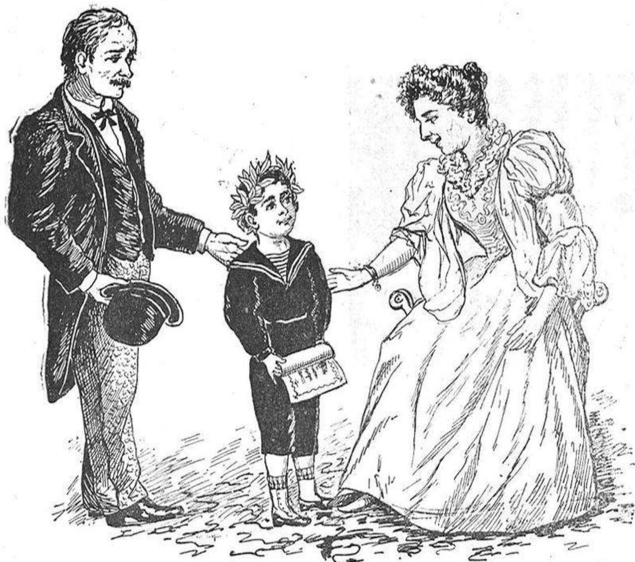
Quan guanya 'l primer premi.