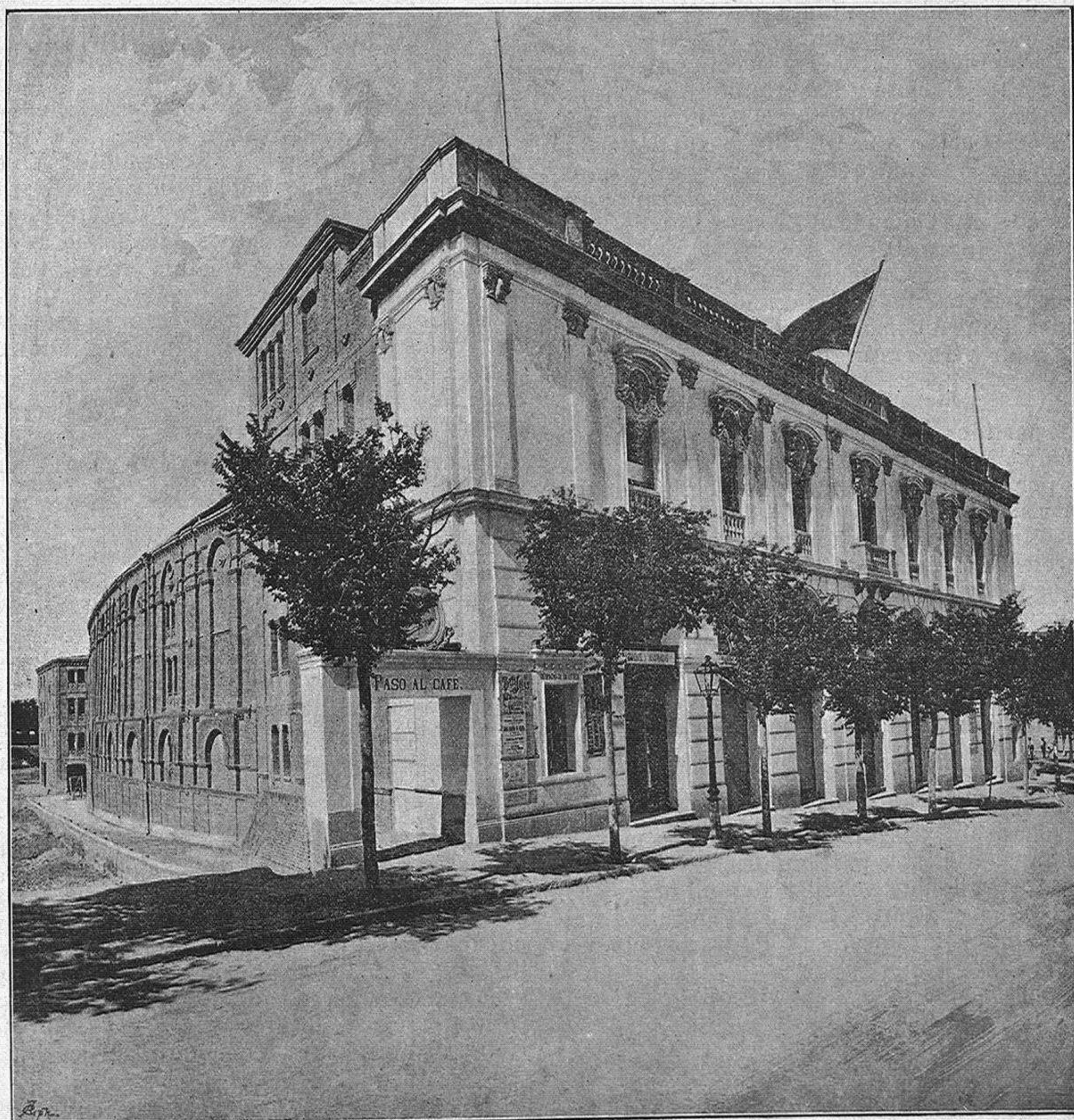
BETI-JAI MADRILEÑO.—VISTA EXTERIOR