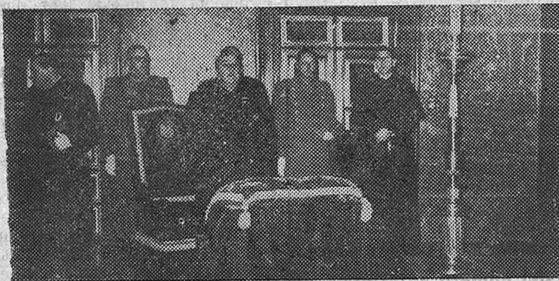
SAN LORENZO DE EL ESCORIAL.—S. E. el Jefe del Estado, Generalísimo Franco, durante los solemnes funerales celebrados en la Basílica del Monasterio por el eterno descanso de José Antonio, al cumplirse el aniversario de su muerte.

Para conmemorar el XIII aniversario de la muerte del fundador de Falange Española, José Antonio Primo de Rivera, se han celebrado en nuestra capital diversos actos, organizados por la Jefatura Provincial del Movimiento, Frente de Juventudes y la Sección Femenina.