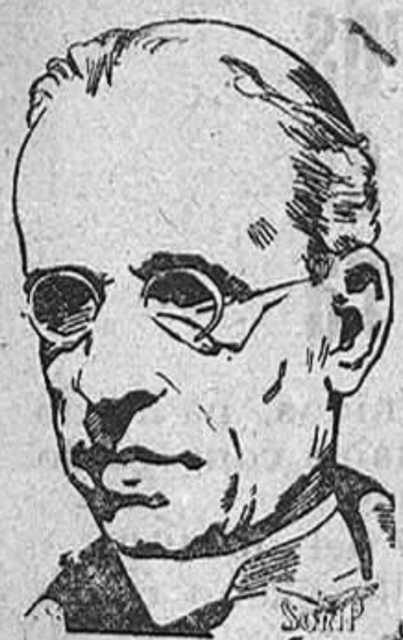
S. S. Pío XII

El incendio, feliz y rápidamente sofocado, en la Basílica del Santo Sepulcro, pone una vez más en el primer plano de la actualidad el problema de la internacionalización de