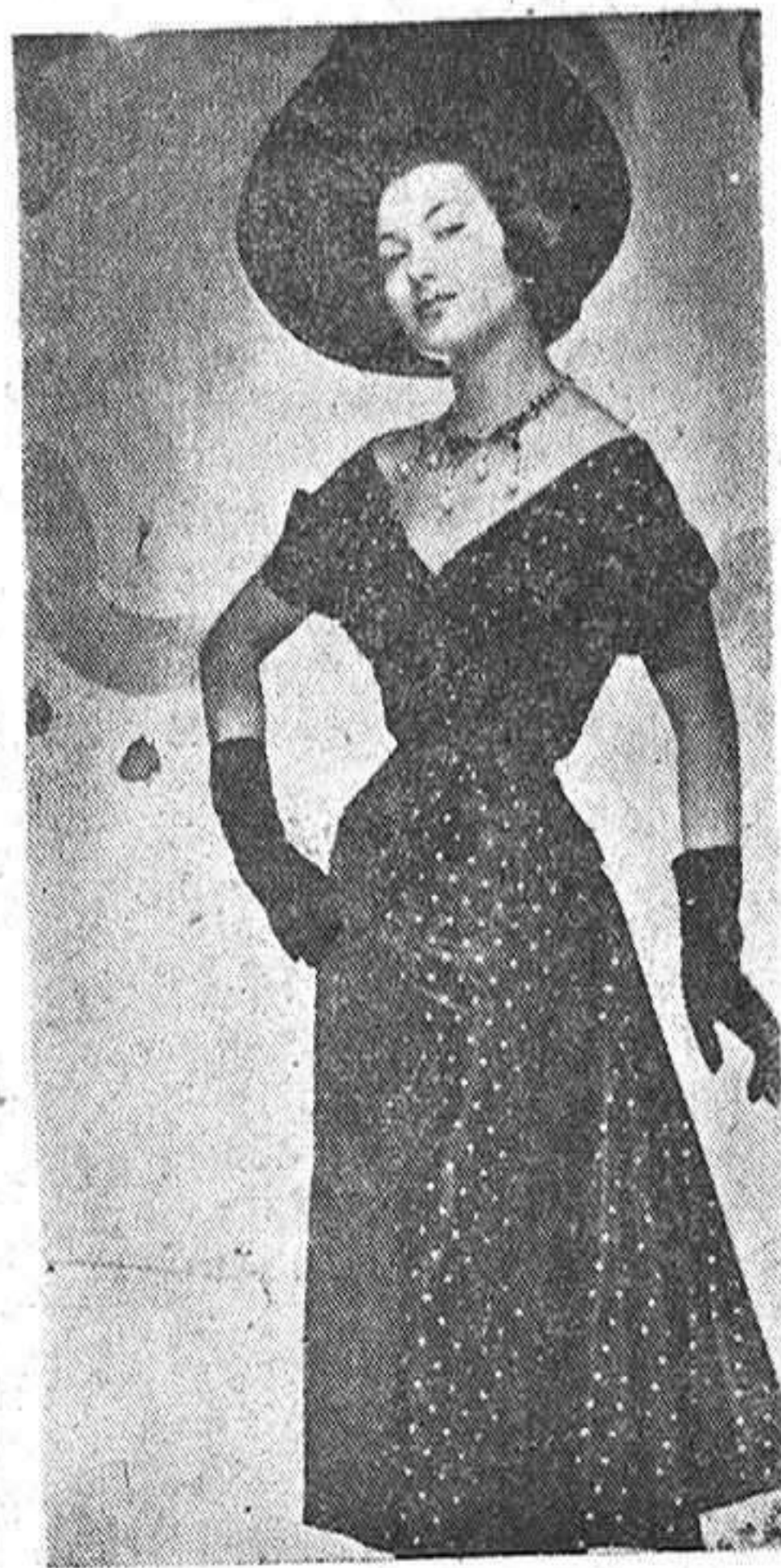
Una de las últimas fantasías de París, creación de Nina Ricci, confeccionado en glacé negro, con lunares dorados y falda de gran vuelo.