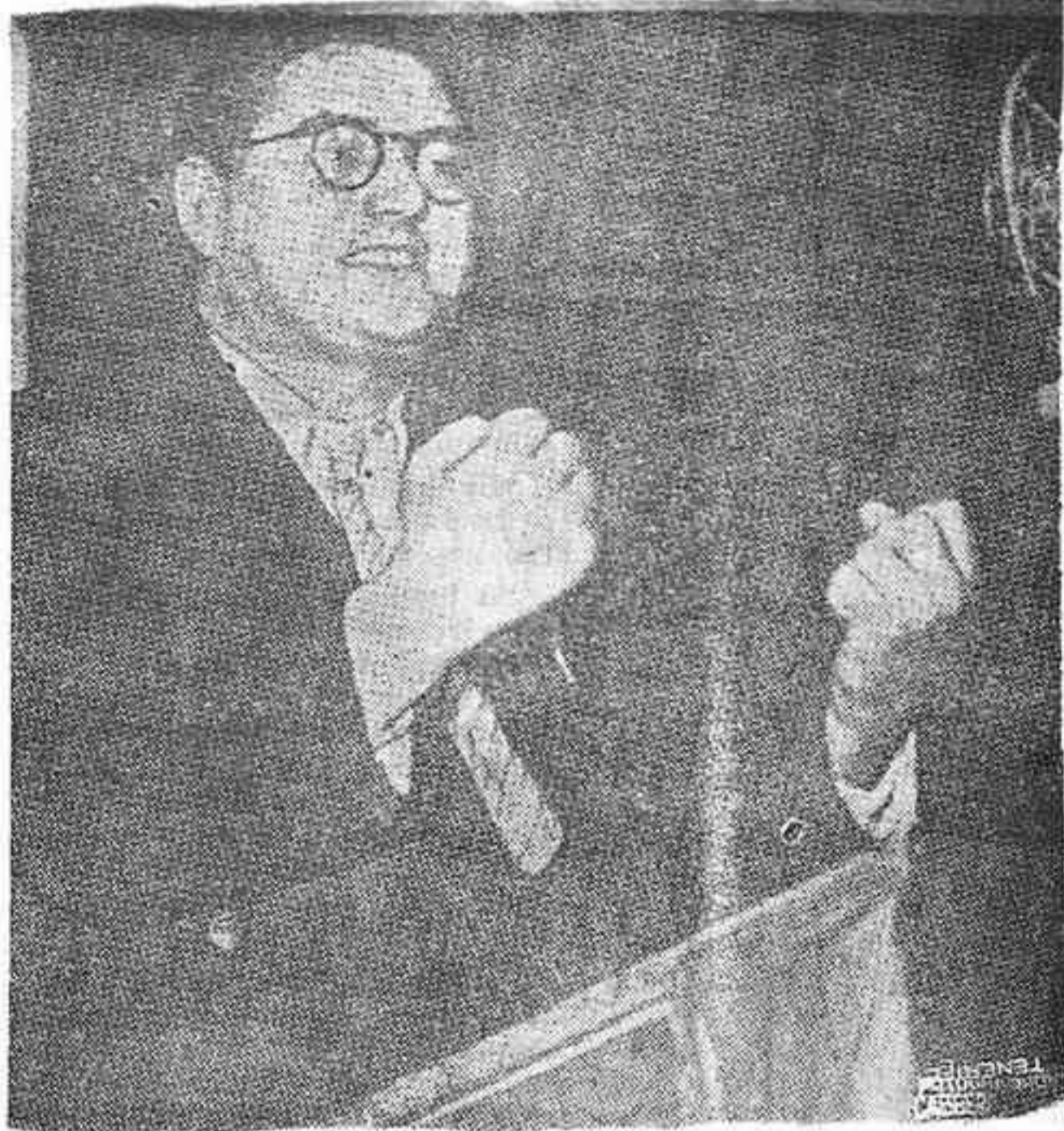
LEON DAUDET, PRESTIGIOSO EX COMUNISTA, CUYA POPULARIDAD SE ACRECIENTA ANTE LA CRISIS FRANCESA. COMO UNA ESPERANZA...

Redacción y Talleres: Plaza de la Constitución, 10 Telégramas "Gaceta" Teléfono 157 Apartado 35