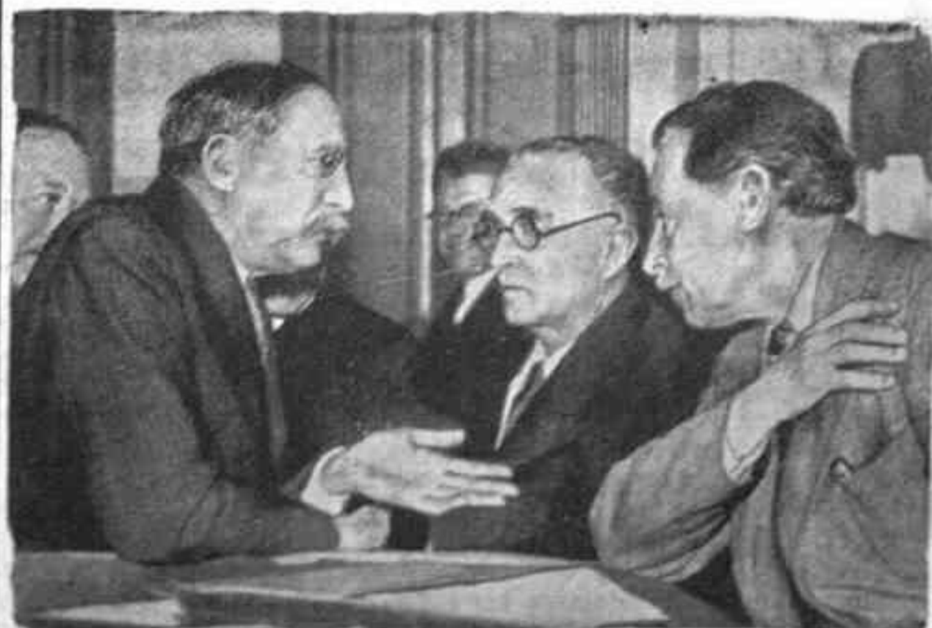
EL EX JEFE DEL GOBIERNO DEL FRENTE POPULAR, LEON BLUM, CONVERSANDO CON SUS CAMARADAS, PARA QUIEN PEDIAN NUEVAMENTE EL GOBIERNO LOS SOCIALISTAS FRANCESES

La cotización del franco no sube de 152. La situación, pues, sigue estacionada y extremadamente grave.