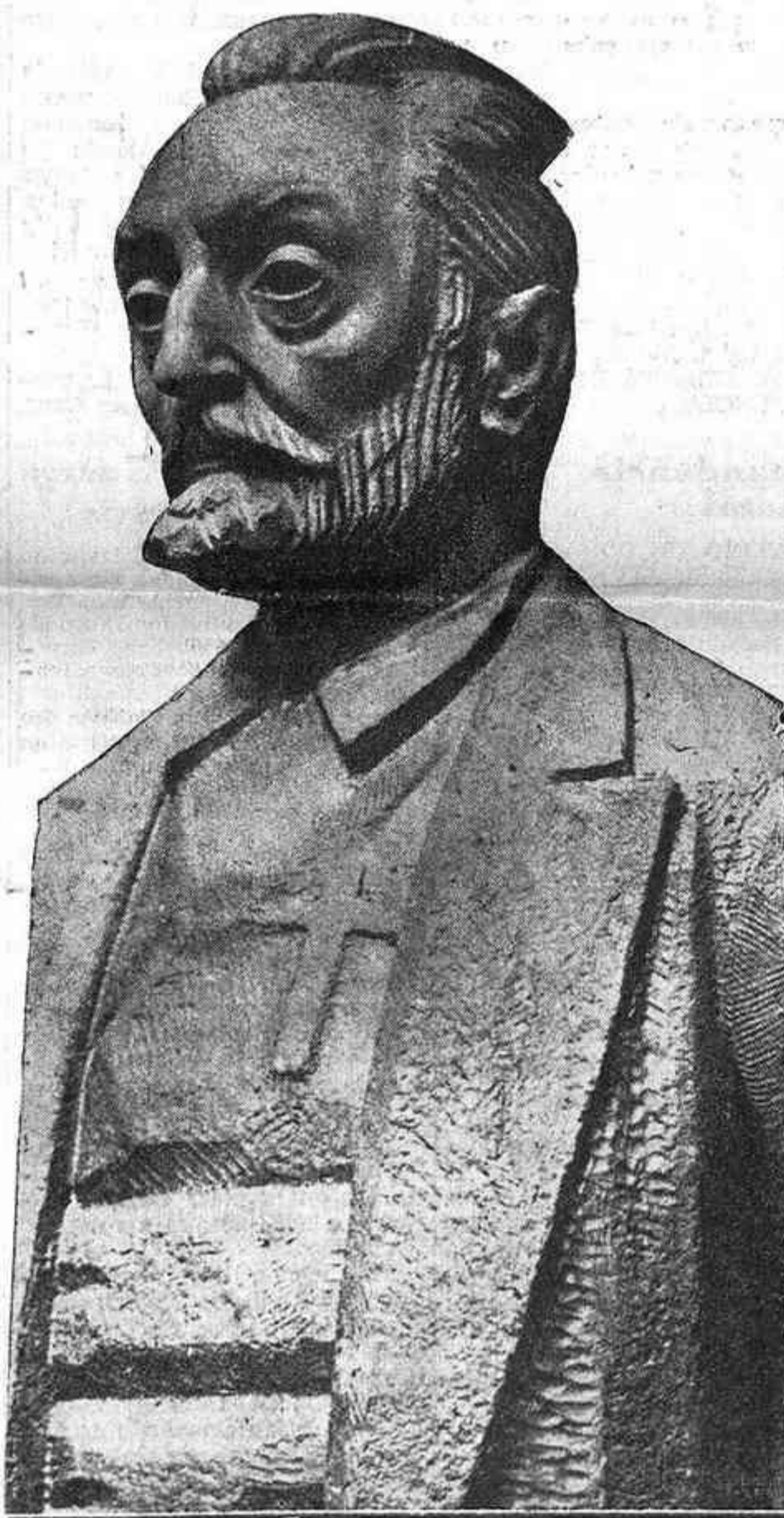
Busto de don Miguel de Unamuno, en el colegio de Anaya (Salamanca)