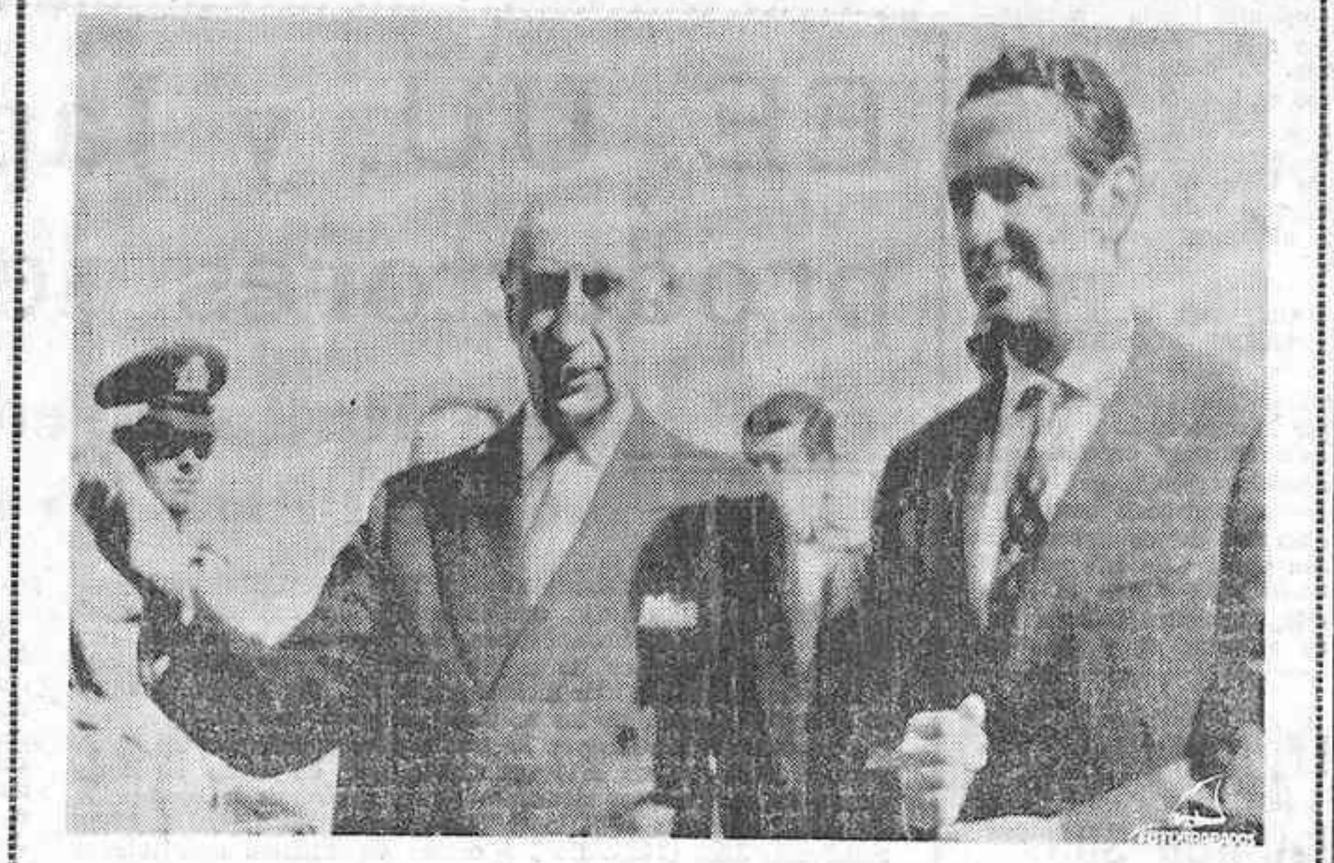
ATENAS. — El Ministro español de Asuntos Exteriores, Sr. López Bravo, acompañado del Subsecretario de Asuntos Exteriores griego, Mr. Kánthopoulos-Palamas.