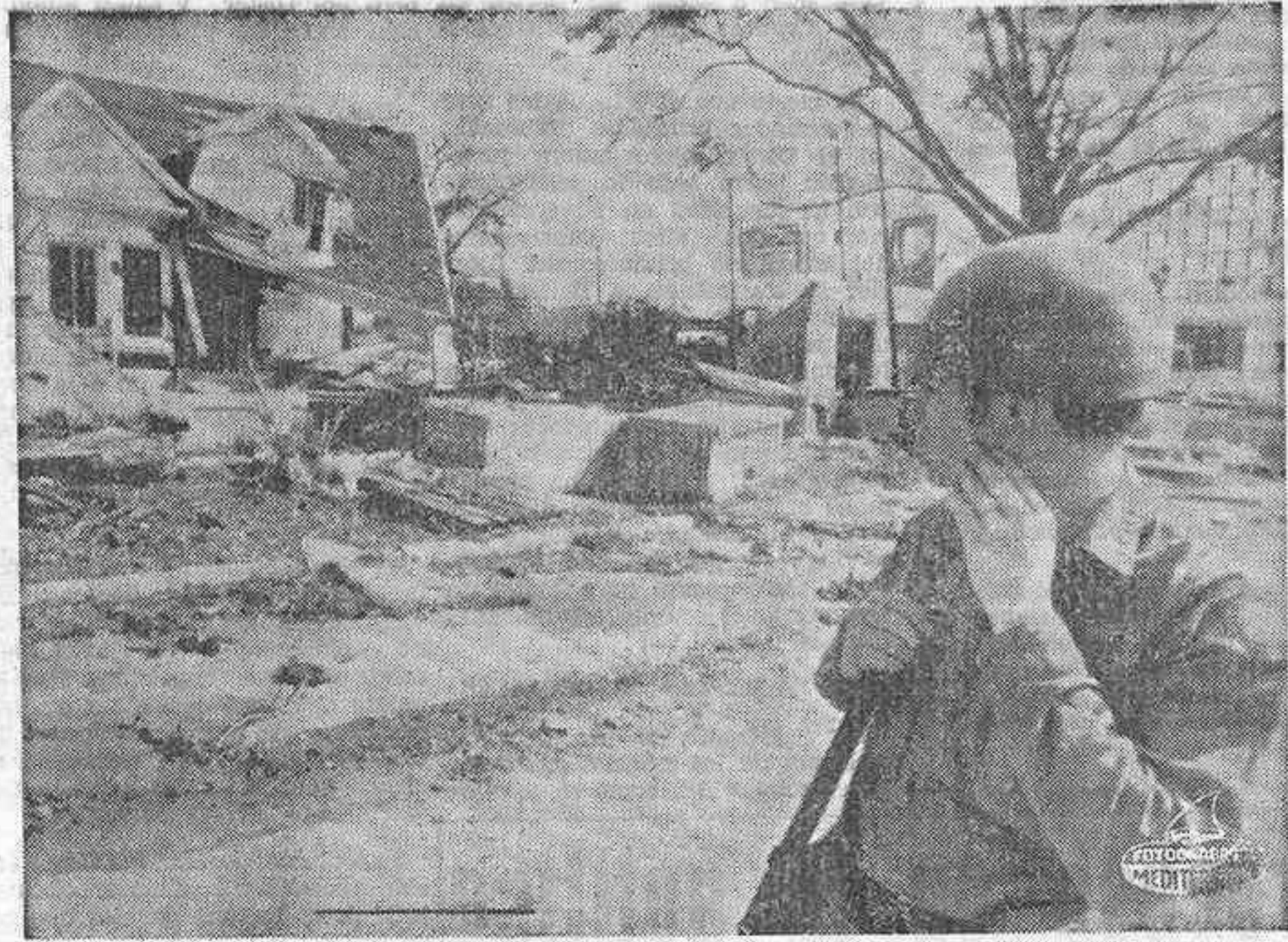
GULFPORT (Mississippi). — Miembros de la Guardia Nacional han sido encargados de vigilar las zonas sinistradas por el huracán Camille...

El total de víctimas es posible que alcance de los 500 a los 1.000