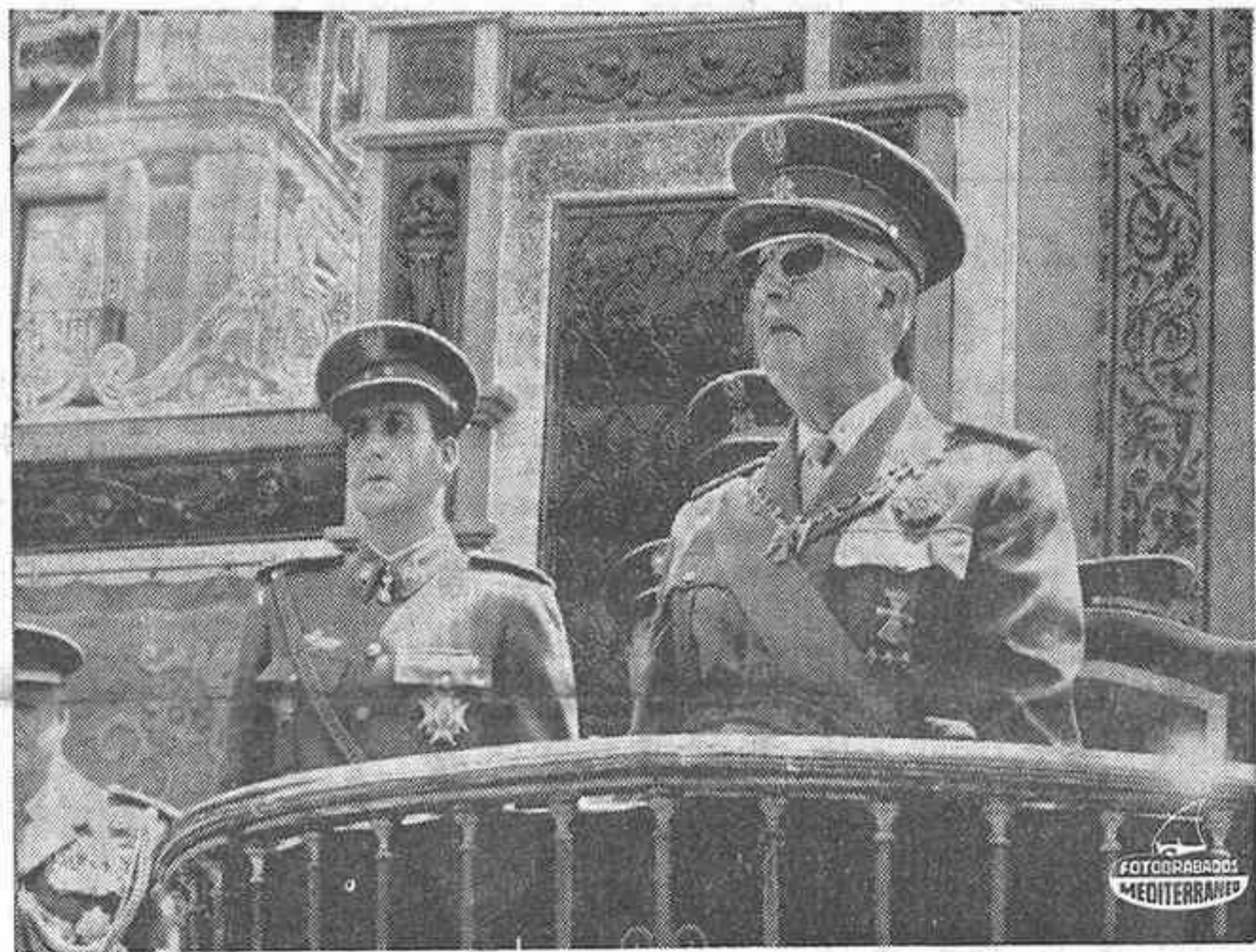
EL PRINCIPE D. JUAN CARLOS DE BORBÓN JUNTO AL CAUDILLO EN UNO DE LOS DESFILLES DE LA VICTORIA

Hecho el silencio, el Caudillo declaró abierta la sesión y se dirigió a los Procuradores con las siguientes palabras: