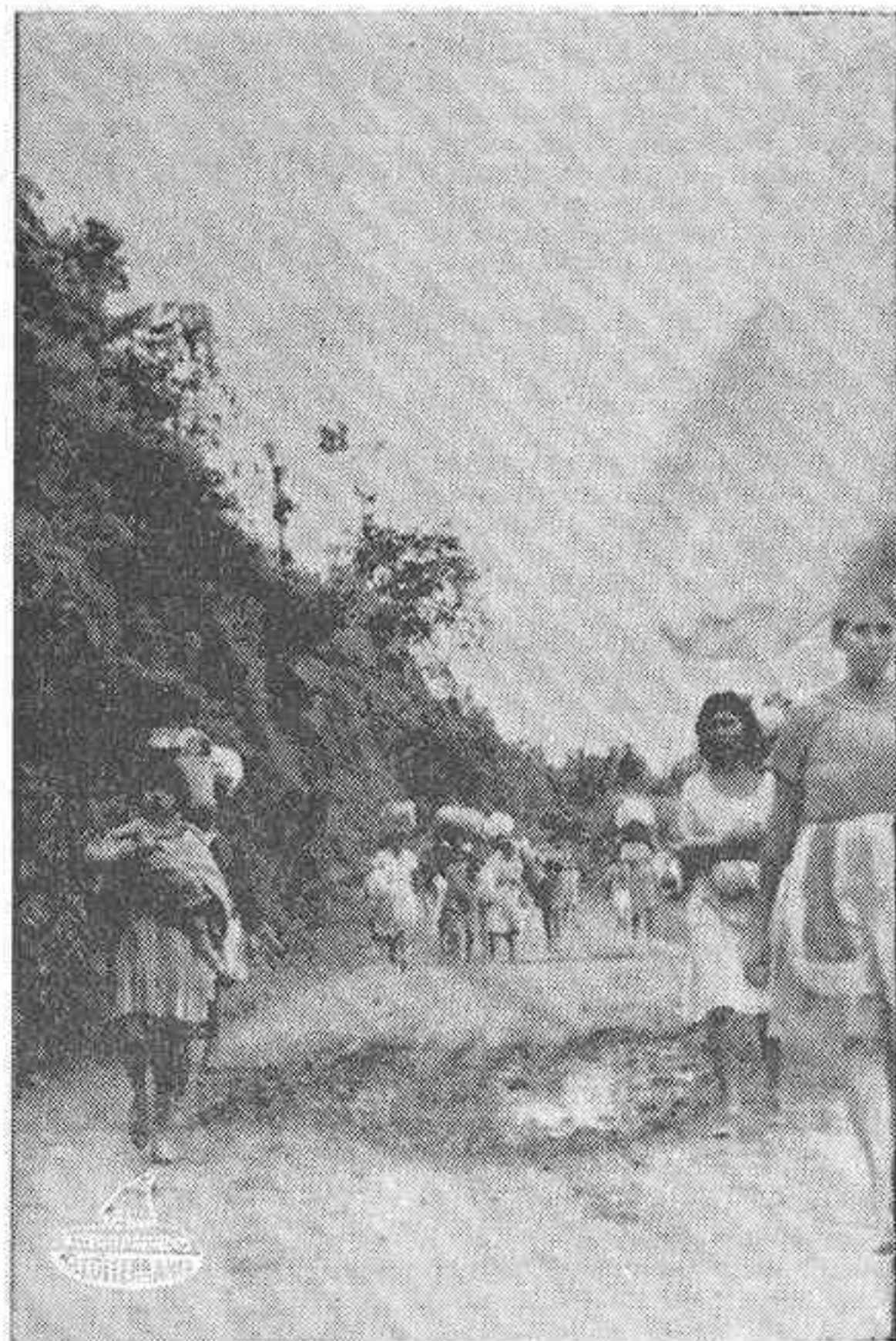
TEGUCIGALPA (Honduras). — La intervención de la Organización de Estados Americanos ha logrado que El Salvador y Honduras acepten la orden de alto el fuego en el conflicto bélico que ha tenido su origen en un partido de fútbol. Mujeres y niños de la zona de Ocotepeque, al Noroeste de Honduras, evacúan dicha zona a causa del fuego artillero de las tropas hondureñas.

En los frentes no ha variado la situación. Esta mañana sólo hubo intercambio de disparos en la zona norte. Anoche, los vecinos de Langué, en el departamento de Valle, desalojaron el pueblo atomizado por la pre-