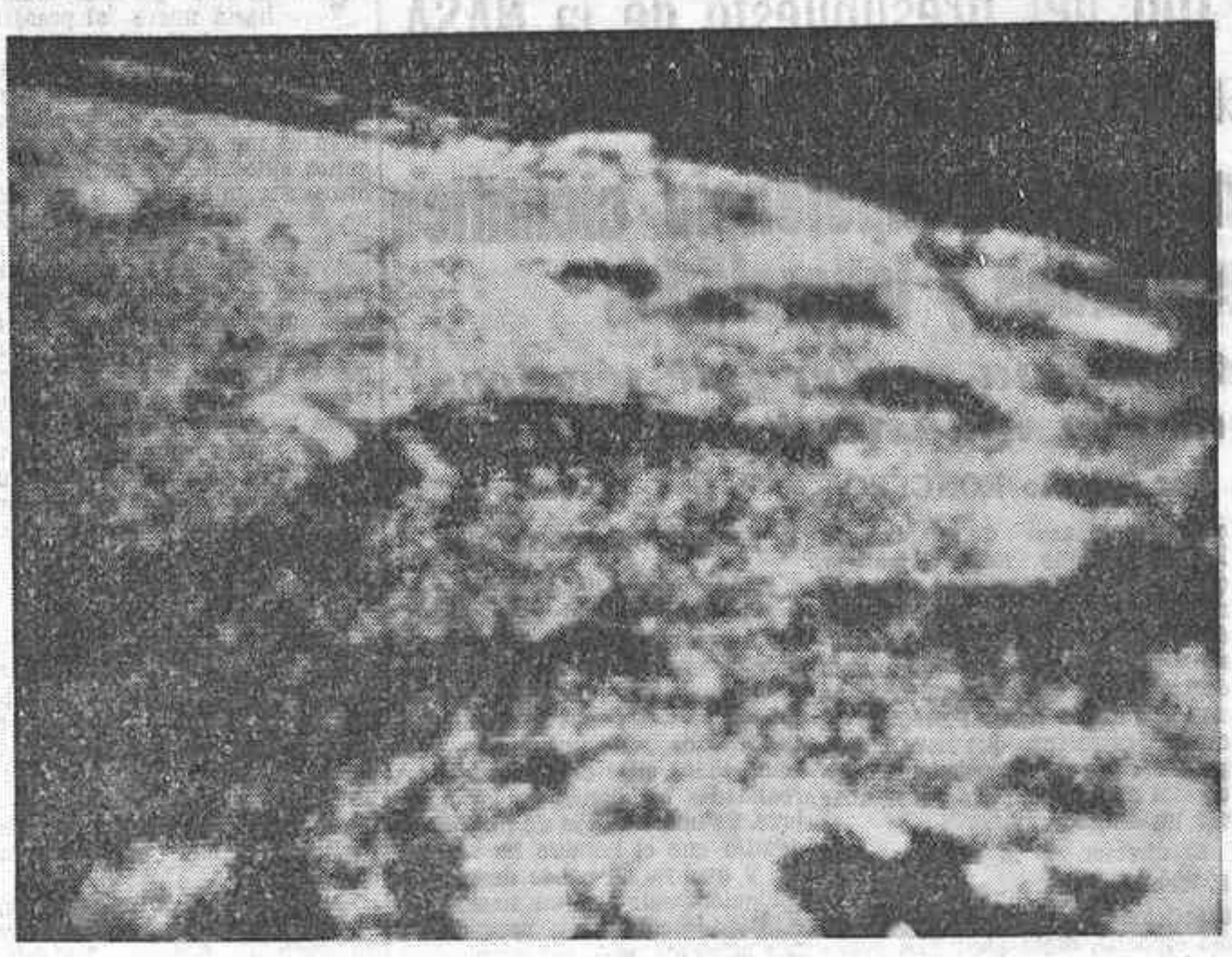
FRESNEDILLAS (España). — En la Estación Espacial de Robledo de Chavela y en sus instalaciones de Fresnedillas se han recibido varias fotografías televisadas desde el módulo comando del "Apolo XI" cuando éste se hallaba a unas cien millas. En la foto, una vista del horizonte lunar al anochecer.

La maniobra con que se inició el viaje de vuelta al planeta, supuso primero una nueva puesta en marcha del motor de la astronave de 2 minutos 30 segundos de duración. Con esta puesta en marcha la nave logró una velocidad de escape de 36.194 pies por segundo (más de 11.030 metros). La nave Apolo quedaba así situada a 69 horas, aproximadamente de vuelo para llegar a la Tierra. La zambullida de los astronautas en el Pacífico está pronosticada para el jueves 24, a las 17:49 h. e. Apolo XI encontrará la atmósfera terrestre (atmósfera exterior) cuando se halle a 129 kilómetros 93 metros a las 15:40 h. e. del jueves próximo. Seguirá viajando a la velocidad de 11.031 metros por segundo.