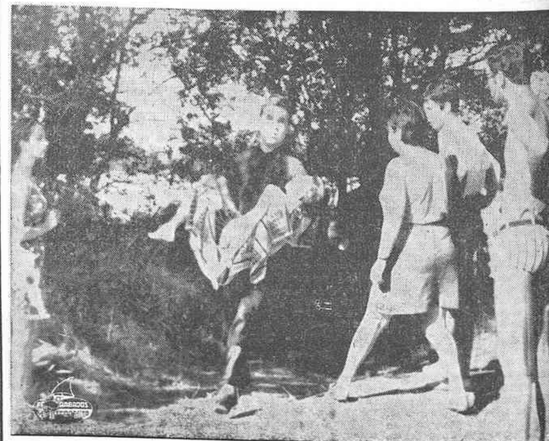
PARIS. — 10 cadáveres de niños, pertenecientes al centro "Joseph Baise", han sido recuperados hasta el momento de los 19 arrastrados por las aguas del río al hundirse la ribera. En la fotografía, un miembro de la operación de rescate porta el cuerpo inerte de un chiquillo.