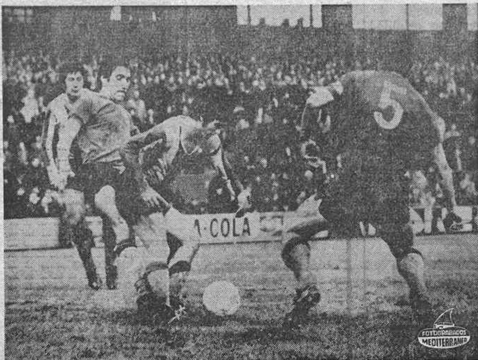
equilibrio en muchos momentos. Con un día así, la afluencia de espectadores fue más bien escasa.

EL UNICO GOL 1-0.— Minuto 39, del segundo tiempo. Saque de esquina lanzado desde el lado derecho, que remata de cabeza Solsona, batiendo a Corral.