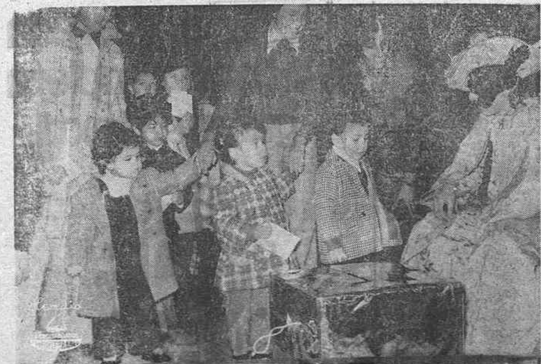
Por la mañana, con gran asistencia y brillantez, se celebró en la Pergola el ya tradicional festival infantil de Reyes, en el que los pequeños entregaron sus cartas de petición de regalos a los Reyes Magos.