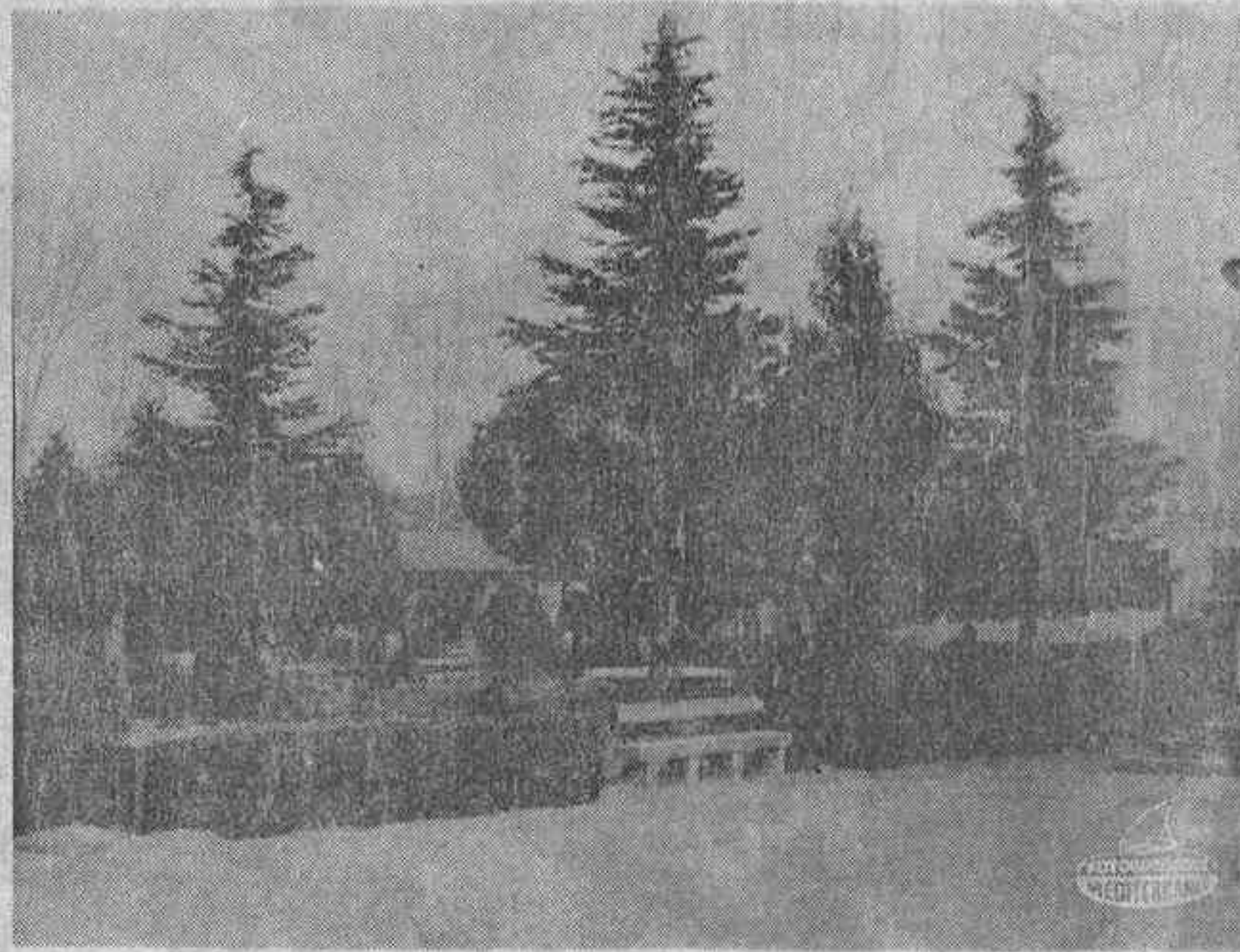
Zona ajardinada del Sanatorio Residencia de Trillo, donde los enfermos de lepra reciben tratamiento y rehabilitación. Entre los árboles, la cafetería del centro asistencial.

Si su respuesta es negativa, condena usted discriminadamente a la segregación y tal vez al confinamiento a los 3.700 españoles que figuran en estos momentos en el censo oficial de enfermos de lepra y a los otros 1.323 que fueron dados de alta en el pasado año; a sus familiares, que debieron superar ese terror injustificado que a usted le inspira esta enfermedad y aceptan que su padre, su madre, su hermano o su hijo continúen residiendo en el hogar sometidos al tratamiento correspondiente; a los miles de españoles que en algún momento tuvieron manifestaciones de lepra y que, neutralizada la enfermedad, fueron dados de alta con las más absolutas garantías científicas; y a esos otros posibles enfermos de lepra que rehúsan darse a conocer a los servicios médicos por temor a ser rechazados por su familia, sus amigos y un amplio sector de la sociedad que desconoce la verdadera situación actual de la lepra en nuestro país.