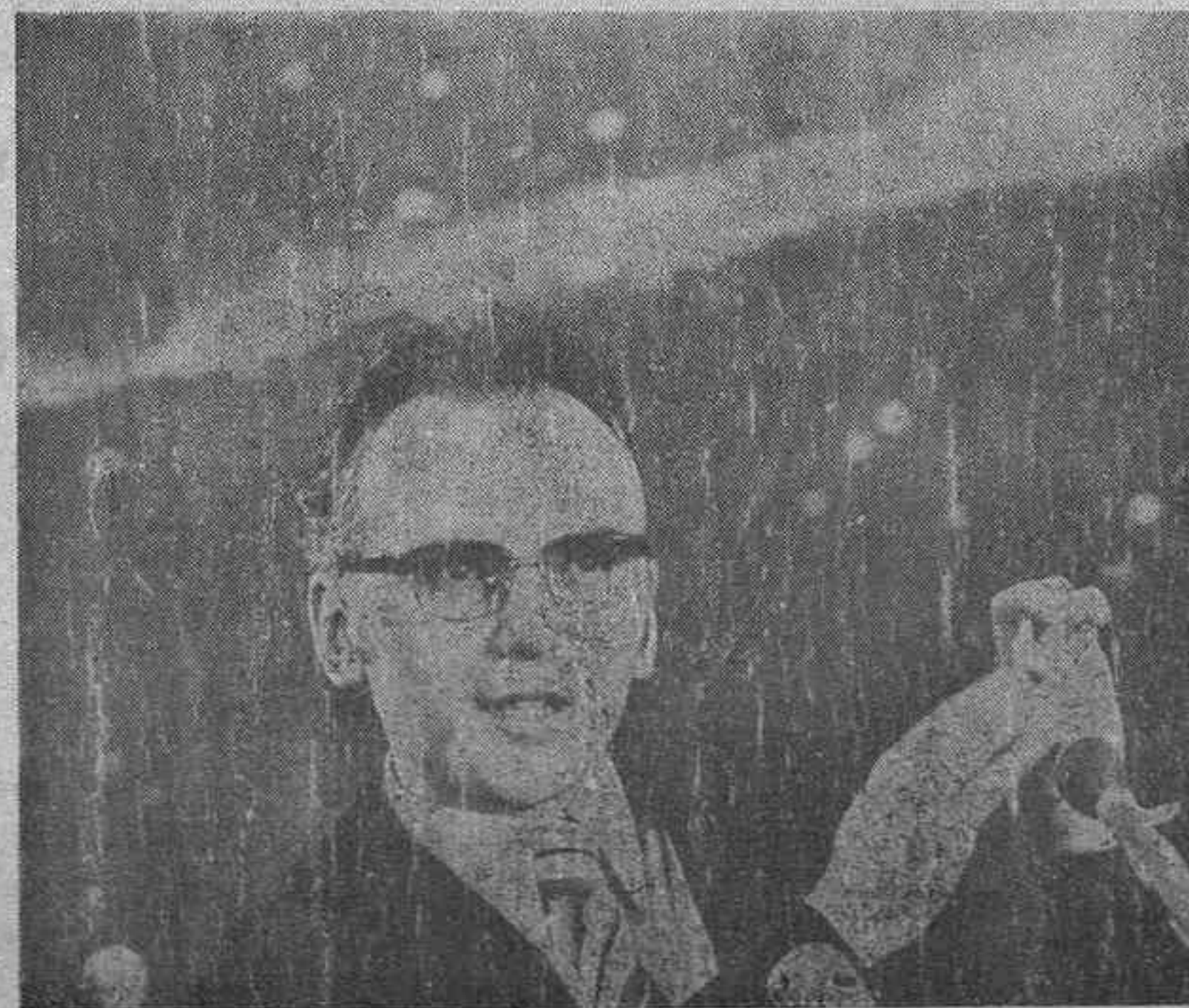
WASHINGTON. — Con el fondo de una fotografía del cometa Kohoutek, el astrónomo checoslovaco Lubos Kohoutek, descubridor de aquel, sostuvo una conferencia de prensa en la NASA, que le invitó a un viaje por Estados Unidos.

La jura se celebrará en el palacio de El Pardo, a las doce de la mañana, ante Su Excelencia el Jefe del Estado. Tomará juramento el Presidente del Consejo del Reino, don Alejandro Rodríguez de Valcárcel.