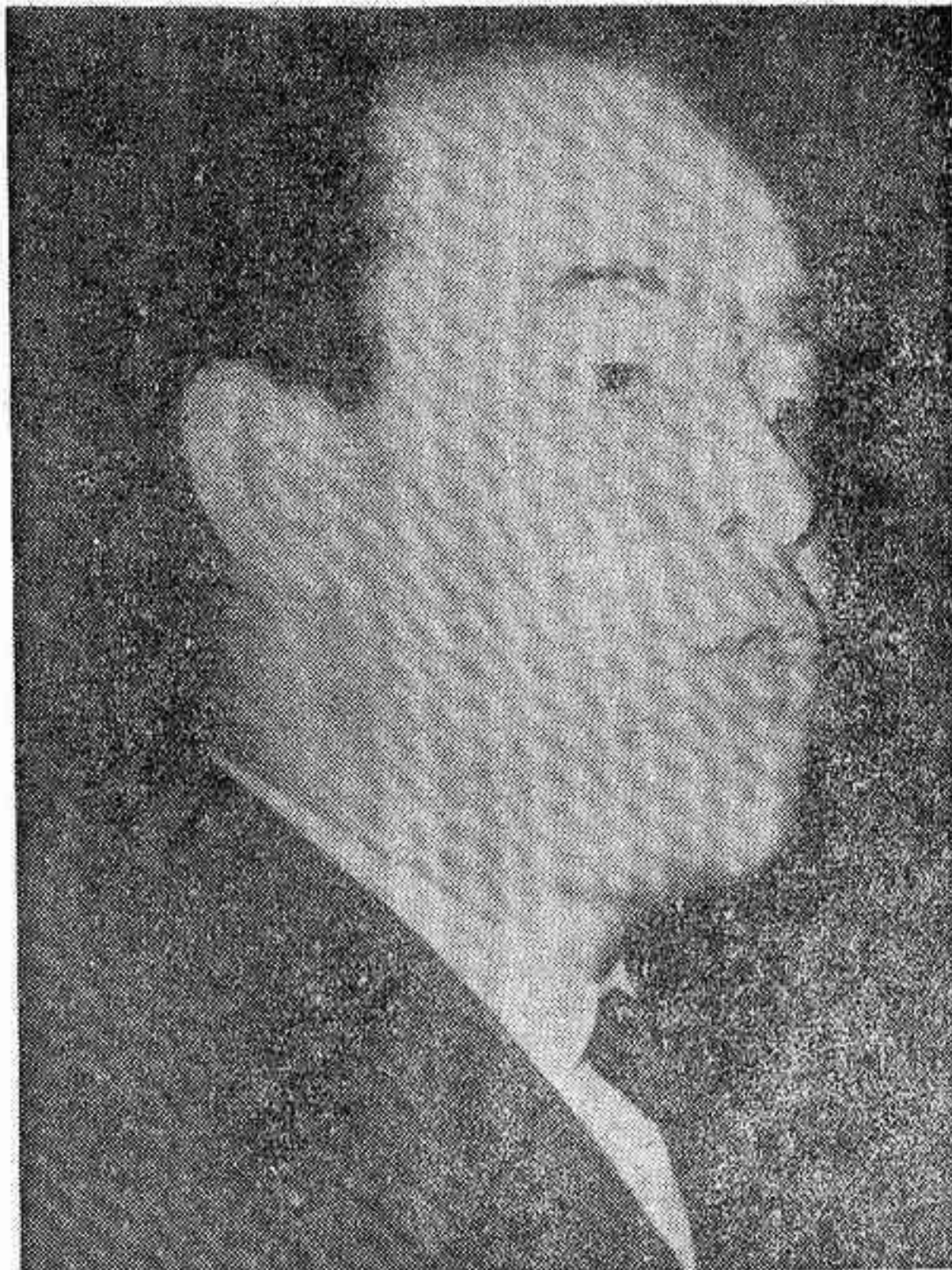
Ben Barka, el lider politico marroquí cuyo asesinato aún no se ha desvelado

El 29 de octubre de 1965 Ben Barka, dirigente de la oposición marroquí, fue secuestrado en París. Nunca más se le volvió a ver, ni vivo ni muerto.