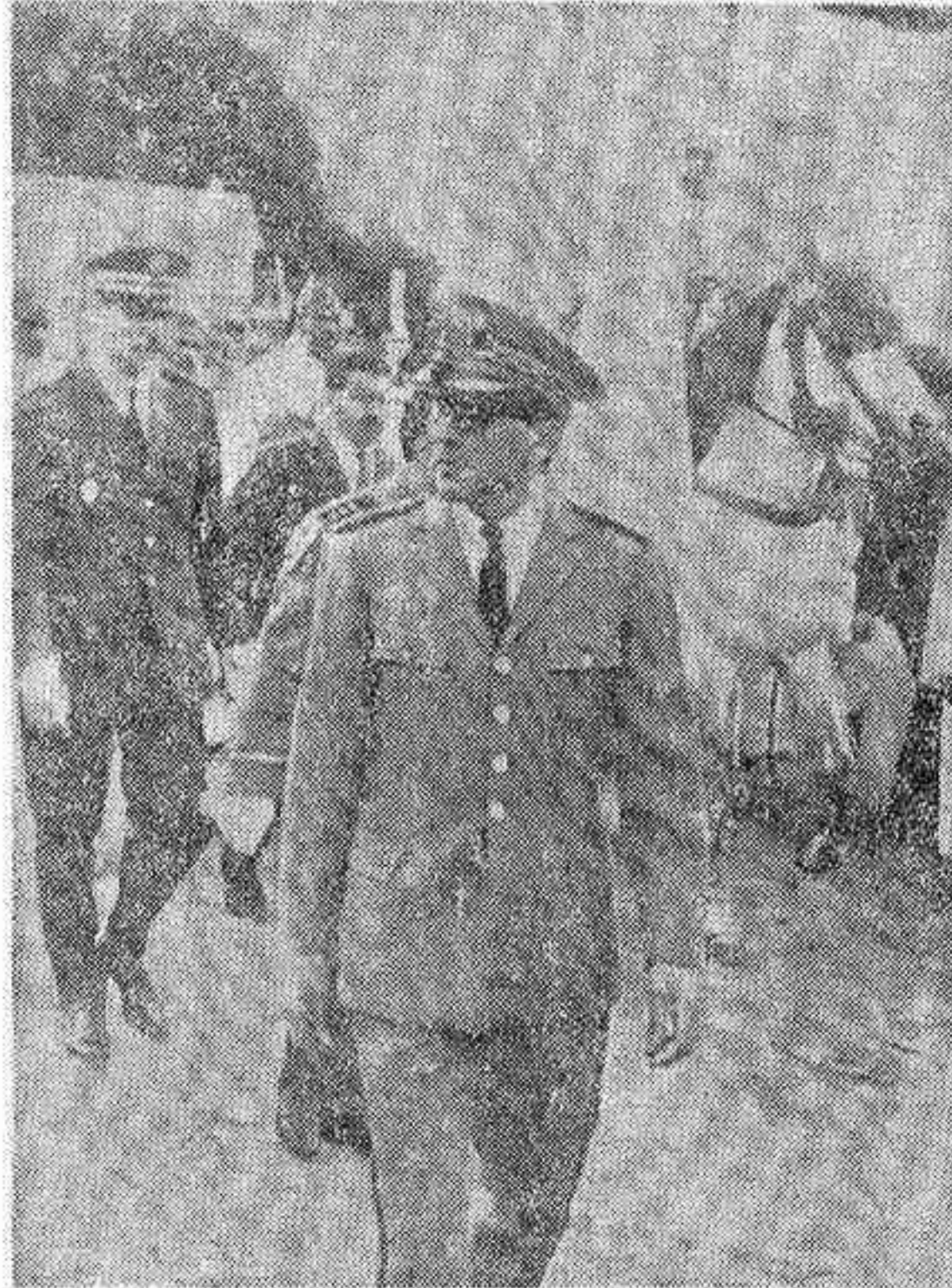
El general Ufkir, hombre de confianza de Hassan II. El pudo llevar personalmente todo el peso de la operación

«No debió dormir mucho López en aquella agitada noche del 30 al 31 de octubre. Ufkir le despertó de nuevo hacia las 5 de la madrugada. Tuvo que conducir a los dos marroquíes a Orly, donde tomaron el avión para Ginebra. En cuanto a él, se reunió con su familia en el Loiret, desde donde se apresuró a telegrafiar a Finville.