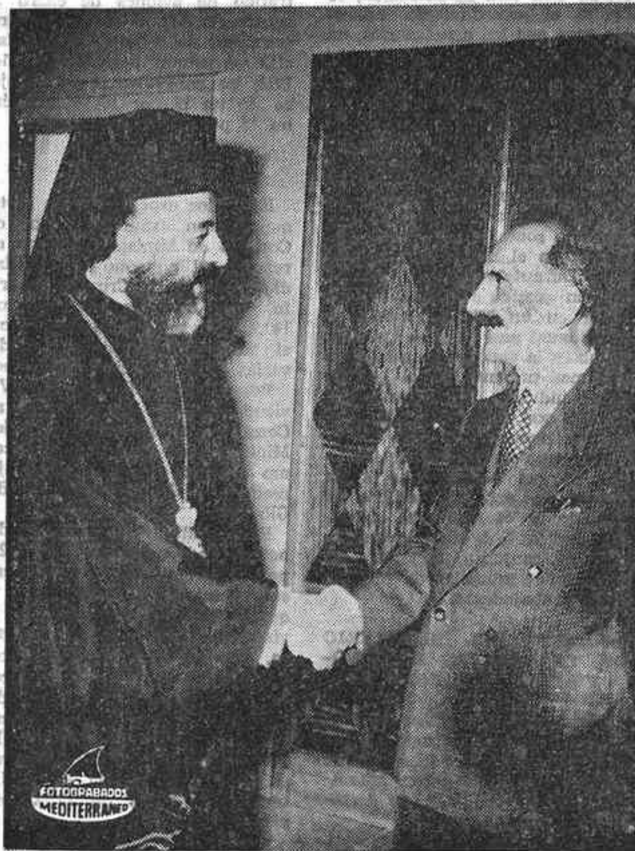
Tal vez en alguna ocasión —muchos chipriotas lo esperan— pue- da volver a tomarse una fotografía como ésta: Grivas y Makarios estrechan sus manos

«Paciencia» es una palabra que se repiten con frecuencia cuan- do el tema de las dos comunida- des vuelve a discutirse por cen- tésima vez en el día. Es, de una u otra forma, una parte de la política de Makarios campeón en el terreno político de la práctica de esta virtud que no tiene des- de luego nacionalidad chipriota. El griego y el turco tienen los dos un temperamento violento e impulsivo. Aman el riesgo, la anarquía, la tentación de ser hé- roes. Chipre siente por otra parte la fuerza de un destino que le lleva a amar con igual pasión la vida y la muerte. En comunión estraña con la tierra nutricia en