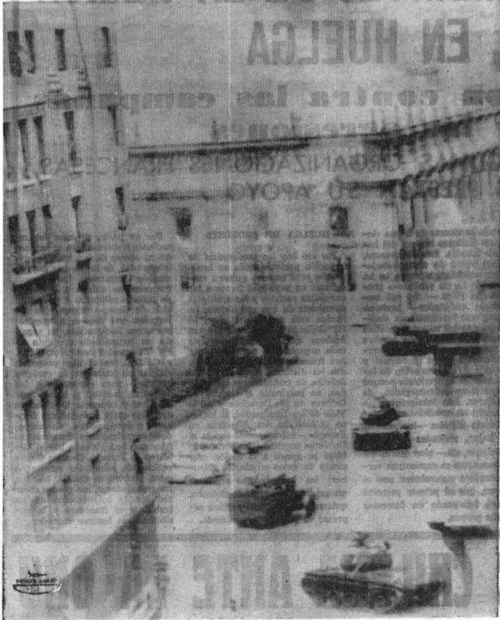
SANTIAGO DE CHILE.—El Palacio Presidencial de la Moneda, al comenzar a arder por uno de sus extremos; tras los bombardeos a que fue sometido por cazabombarderos chilenos. Los tanques toman posiciones frente al palacio.