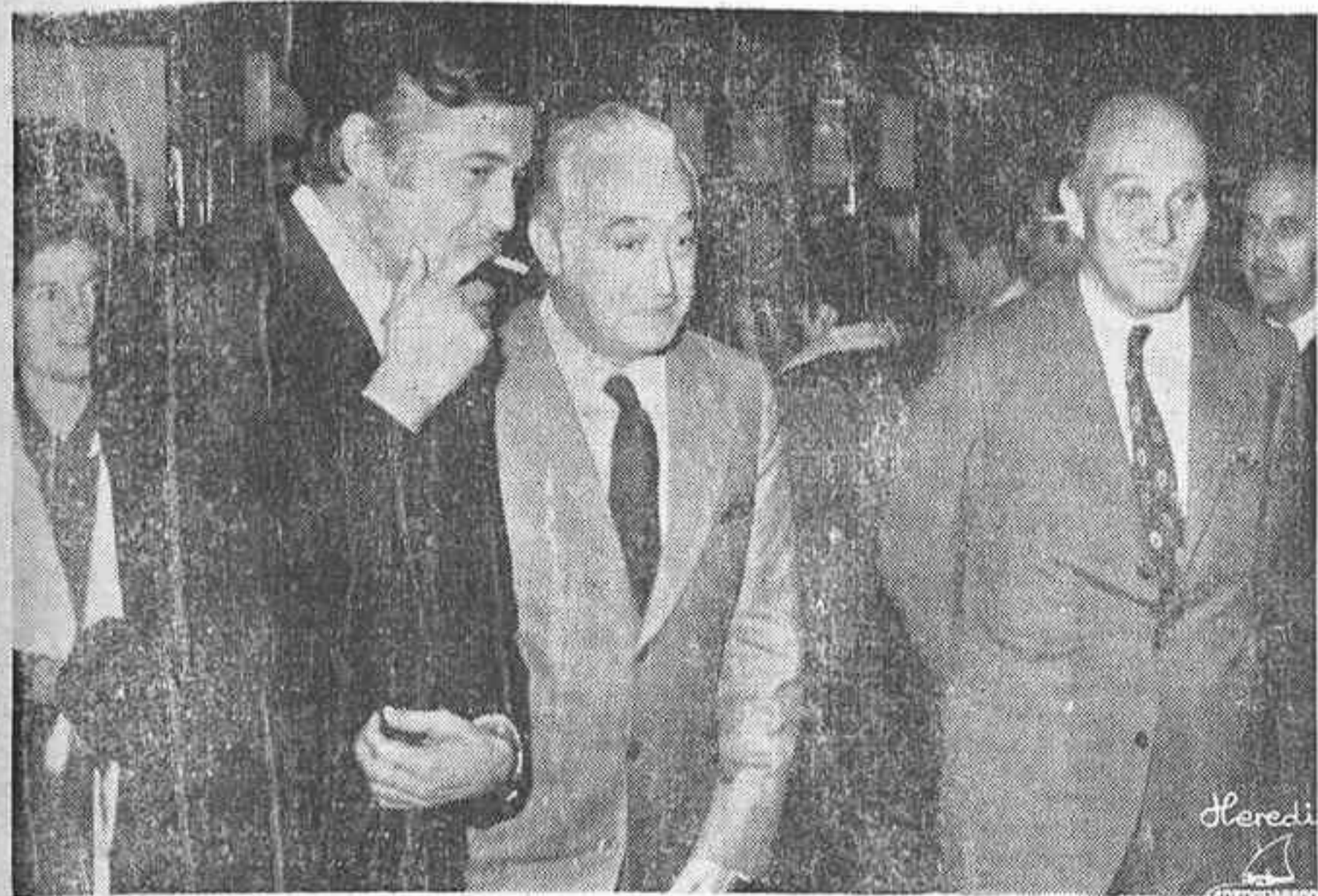
El Jefe Provincial y Gobernador Civil, el Presidente de la Diputación y el Director Regional de Hidroeléctrica, al término del acto de ayer en el Teatro Principal

Ayer se ofrecieron sesiones especiales a las autoridades e informadores