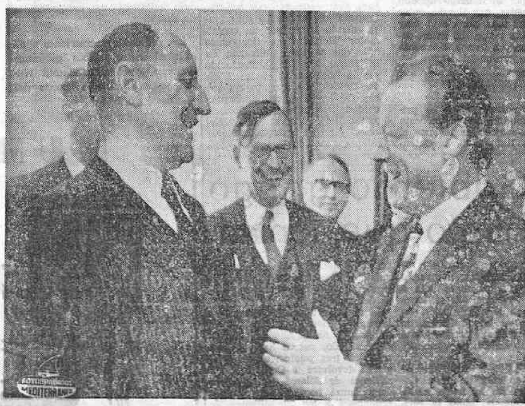
BONN. — El ex Ministro holandés de Asuntos Exteriores, Joseph Luns (izquierda), nuevo Secretario General de la Organización del Tratado del Atlántico Norte (OTAN), conversa con el Canciller alemán y Premio Nobel de la Paz 1971, Willy Brandt, durante su visita a la capital occidental alemana.