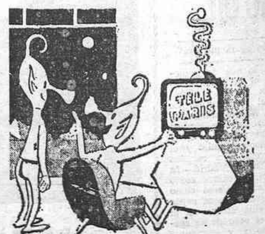
—Aunque a usted le asombre, hay momentos en que se tiene la impresión de que esos terrestres son seres dotados incluso de una especie de inteligencia.