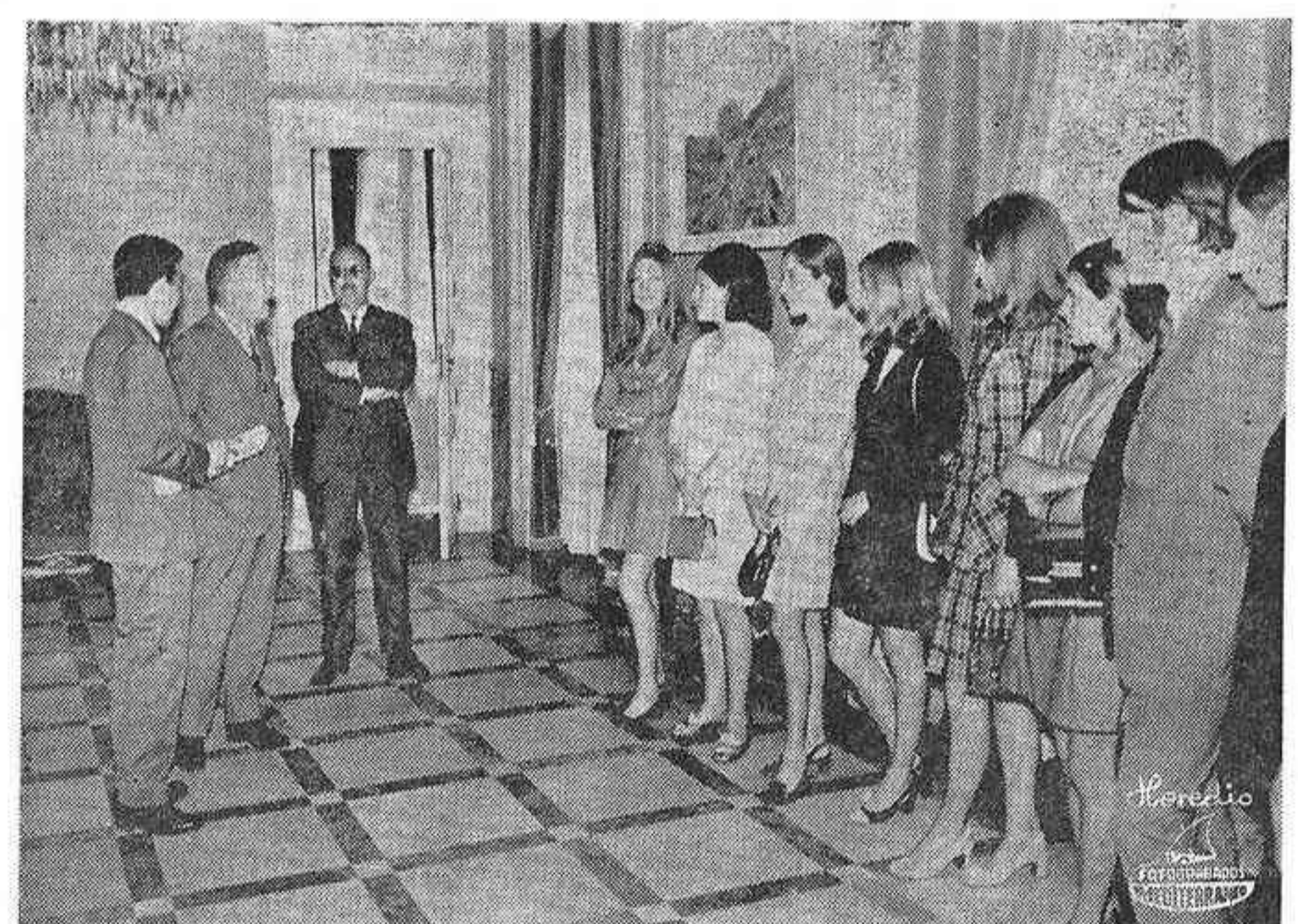
Tras saludar personalmente a todos, el Jefe Provincial y Gobernador Civil les deseó el mayor éxito...