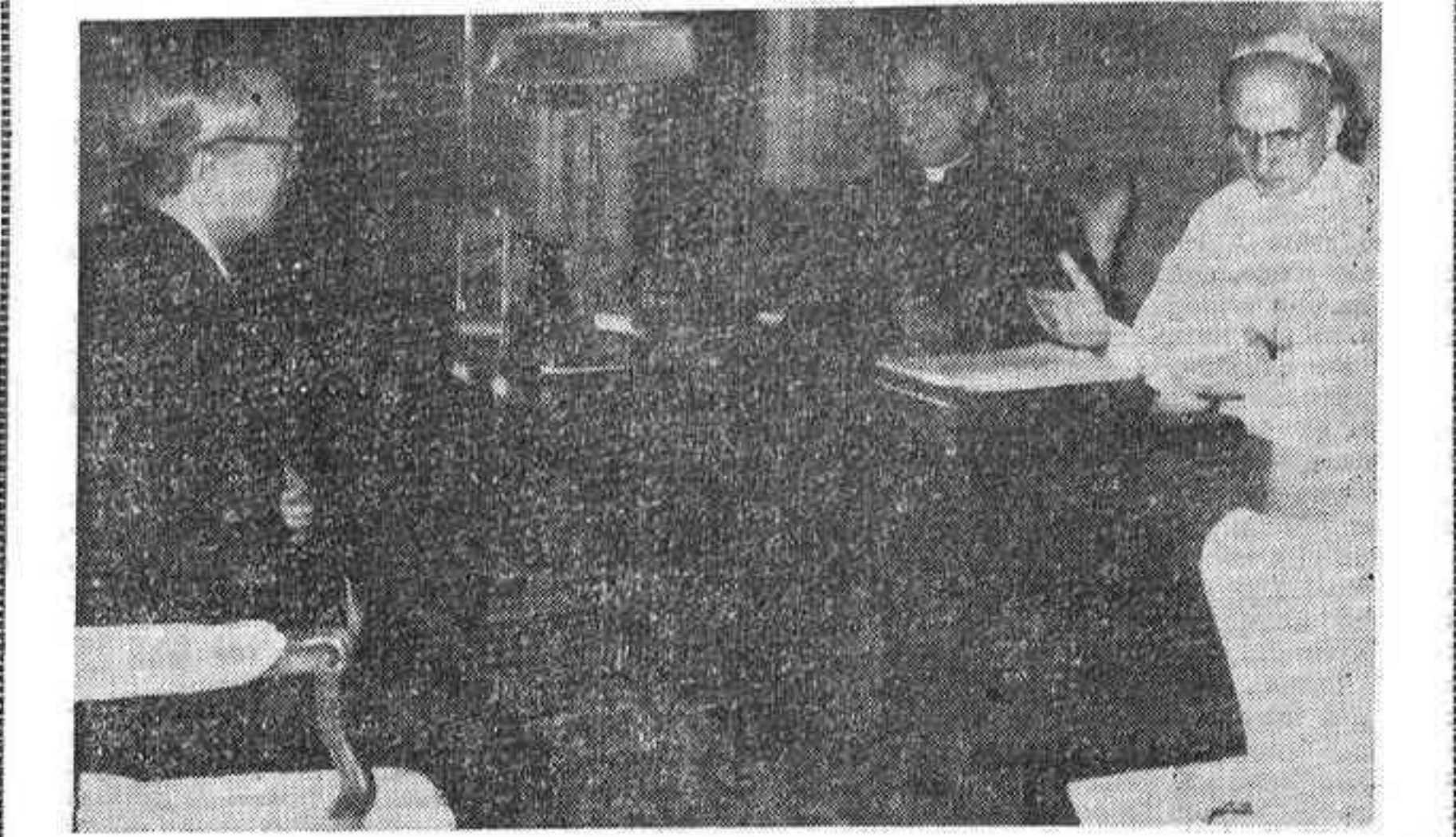
CIUDAD DEL VATICANO. —El Papa Pablo VI ha recibido en audiencia privada al secretario general de las Naciones Unidas. En la foto vemos al Pontífice y a Thant durante su conferencia, junto con el intérprete