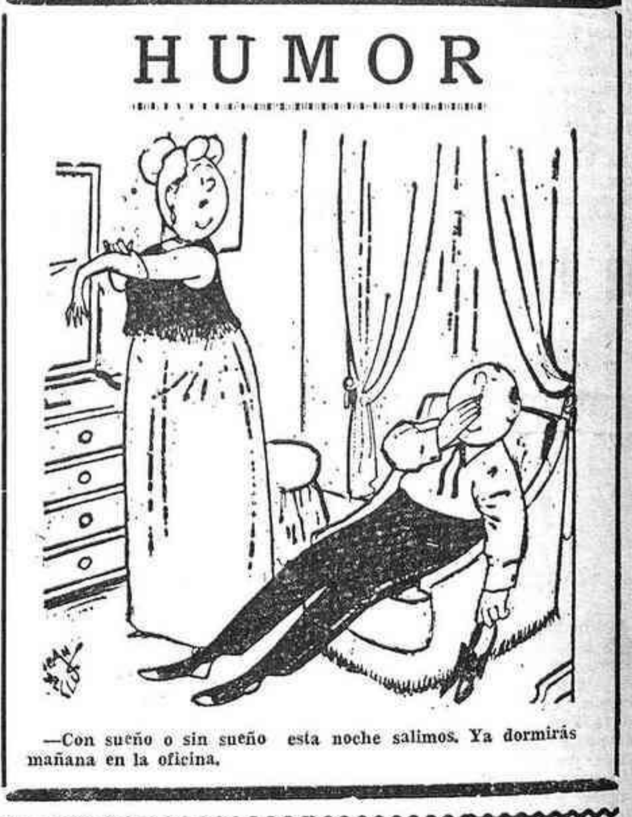
—Con sueño o sin sueño esta noche salimos. Ya dormiremos mañana en la oficina.

PFaffenhofen (Alemania Occidental) 9 (Efe-Reuter). — Un avión militar de la República Federal de Alemania se ha estrellado hoy cerca de la ciudad de Paffenhofen y ha muerto en el accidente el piloto y dos operados de cámara de cine que se habían abordo, según ha informado un portavoz del ejército.