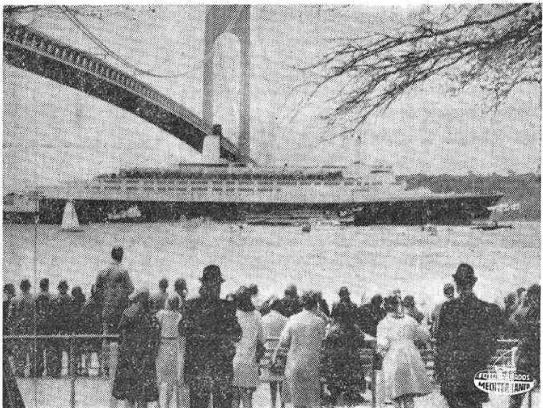
NUEVA YORK. — "El "Queen Elizabeth II" navega majestuosamente bajo el famoso puente de Brooklyn tras completar su viaje a esta ciudad. Numeroso público estacionado a lo largo de la orilla dio la bienvenida al lujoso trasatlántico.