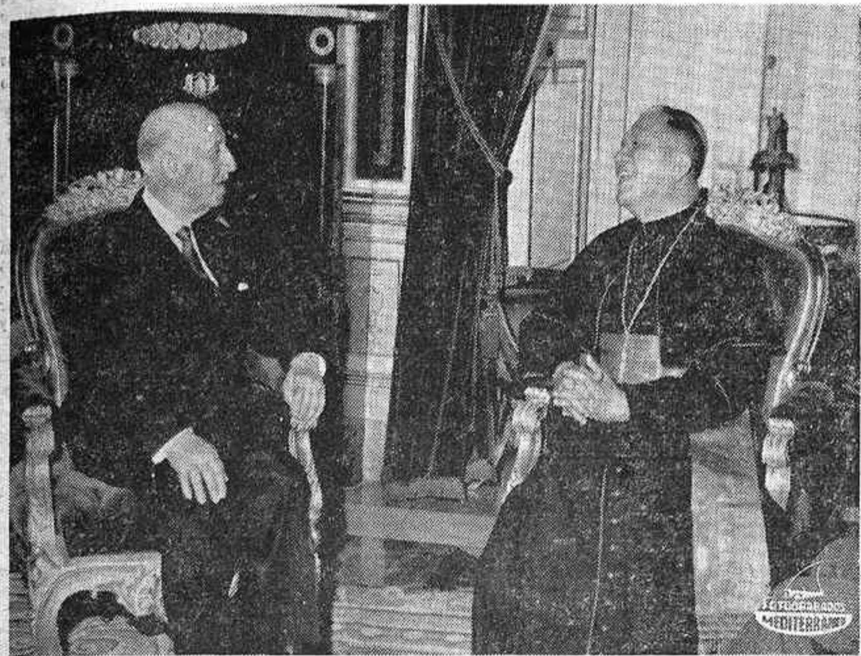
MADRID. — Un momento de la audiencia de S.E. el Jefe del Estado a Su Eminencia el Cardenal filipino Dr. D. Julio Rosales, que acaba de ser elevado a la púrpura cardenalicia en el reciente Consistorio por S. S. el Papa Pablo VI.