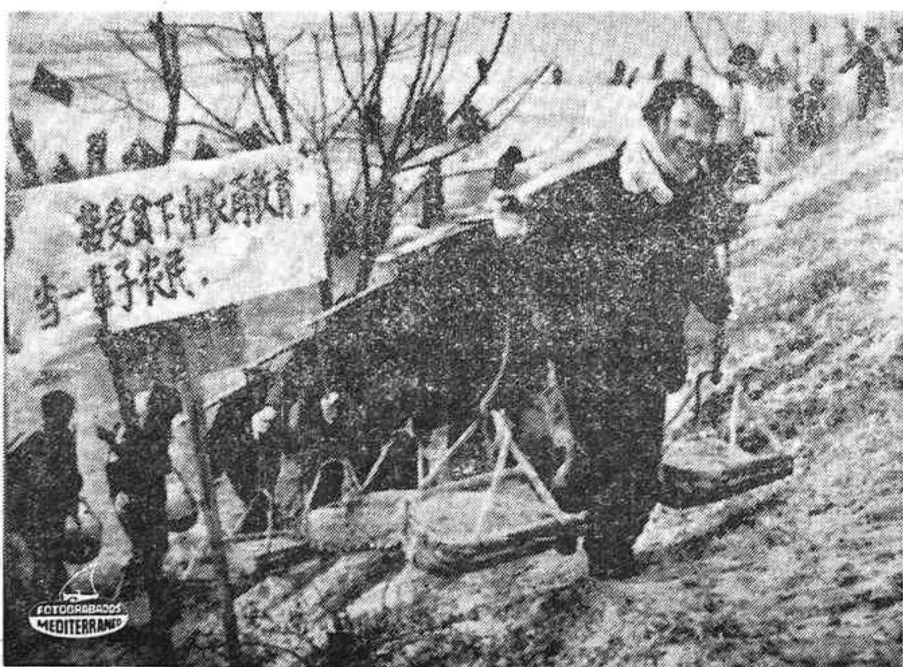
PEKIN. — Jóvenes de la Brigada de Producción de Turgabi, en Yuehyang, Provincia de Hunan, toman parte activa en los trabajos para la conservación de las obras hidráulicas de acuerdo con las máximas del Presidente Mao Tse Tung de que los jóvenes deben ir al campo para ser reeducados por los campesinos pobres.