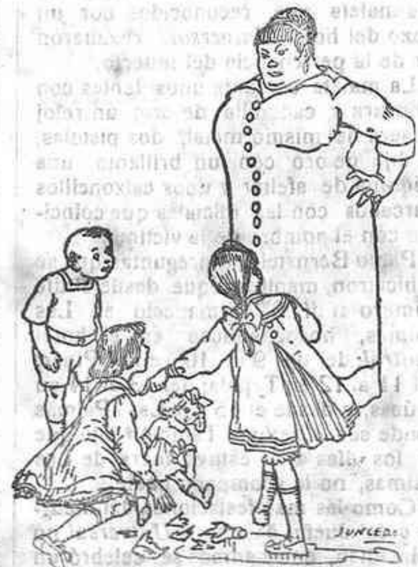
COSAS DE CHICOS

—Mamá, mamá. Ha sido Manolita. —Habéis hecho una nueva diablura? —No mamá, yo no fui. Fue la mufeca que se empeñó en probar la Peca-Cura. Jabón 1'25; Crema 1'75; Polvos 2; Agua 5 pesetas