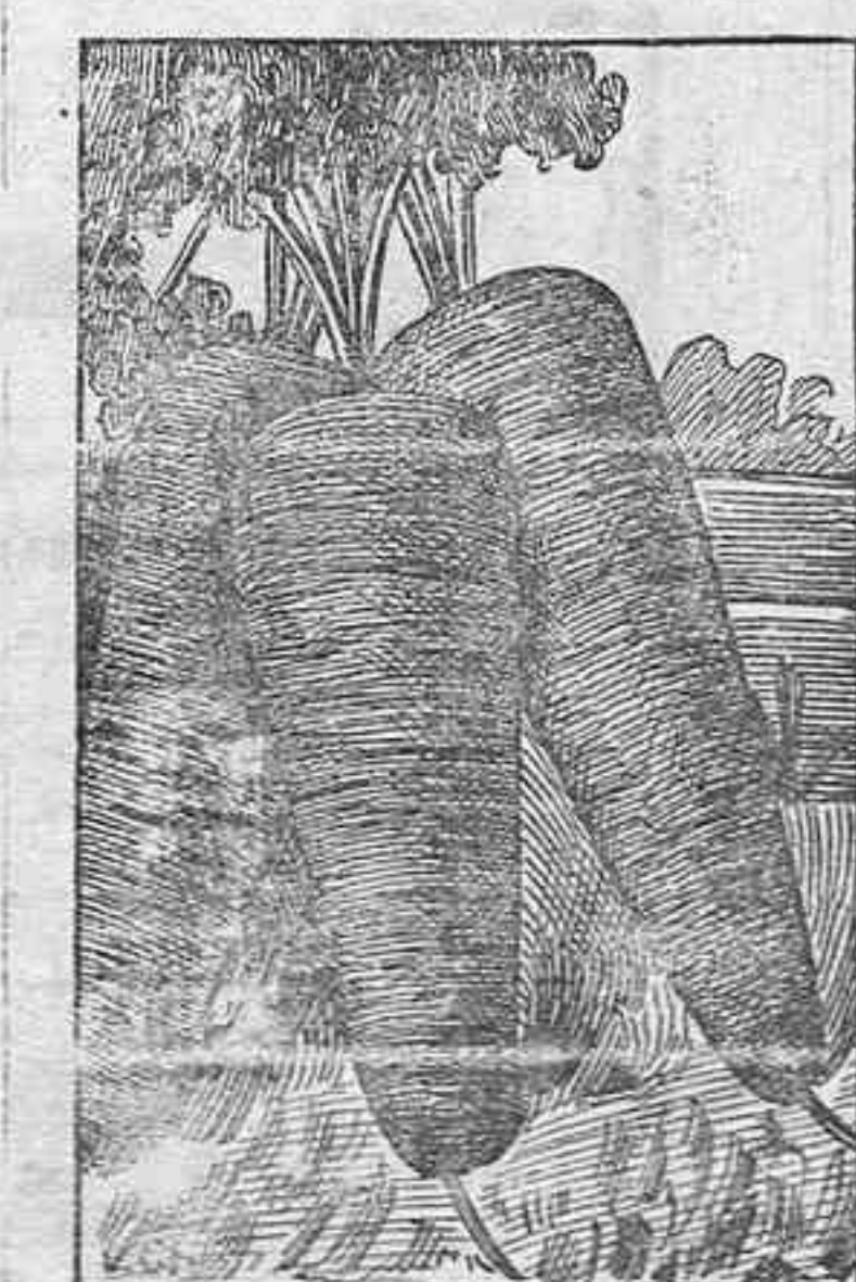
Zanahoria Medio Larga